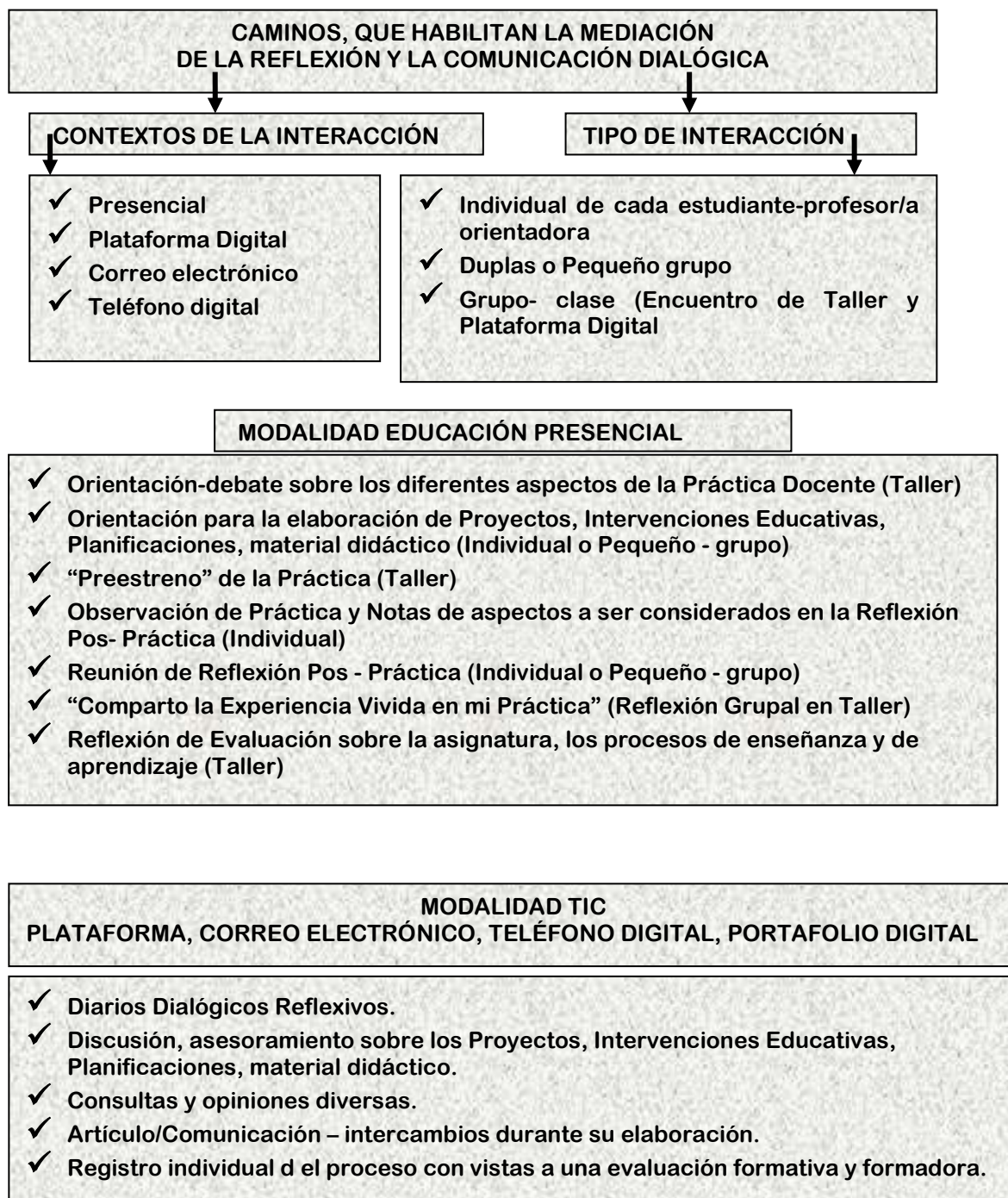
Figura 3. “Caminos” de la Práctica en el año lectivo 2010 o formas de trabajo en el proceso formativo de la materia Práctica