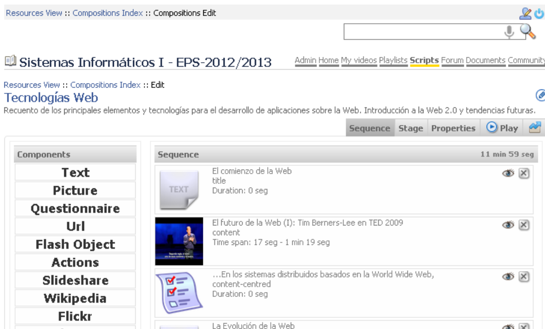
Figura 3. Vista de composición del material asistida por SMLearning

A continuación se describe las fases de trabajo propuestas como parte de la metodología de aprendizaje basada en la composición de objetos de aprendizaje multimedia-interactivos asistida por el sistema SMLearning.