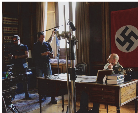
Figura 4. Momento del rodaje del cortometraje de investigación sobre España durante la Segunda Guerra Mundial titulado El emisario , producido en colaboración con el Grupo IDECA, en 2018.

culturales. Todos estos proyectos han tenido una huella formativa, con la colaboración a modo de prácticas de estudiantes de la Facultad. Si la docencia y la investigación son dos caras de la misma moneda y forman un binomio indisoluble en la universidad, a través del cual se produce un enriquecimiento mutuo, la experiencia del Grupo IDECA ha cristalizado, además, en la puesta en marcha de espacios de análisis externos a la propia Facultad, como el conjunto de cursos sobre cine profesional llevados a cabo en la Universidad Internacional Menéndez Pelayo, en su sede de Cuenca, entre los años 2013 y 2019, en los que han participado un gran número de profesionales del cine español de gran relevancia en muy diversas áreas.