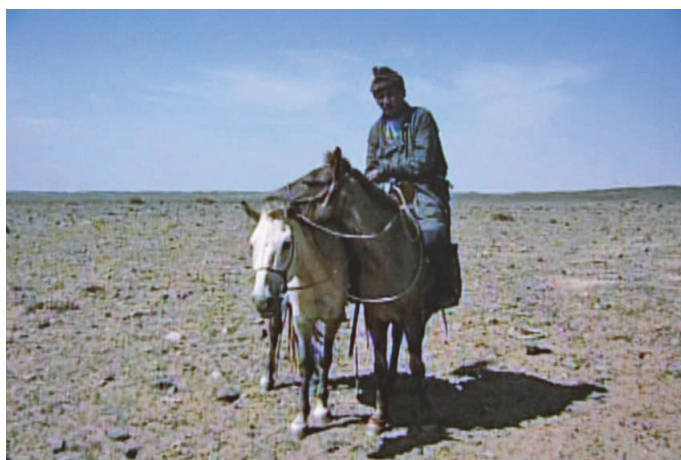
Figura 2. Fotograma del documental Mongoles del desierto de Gobi , de la serie RUTA SALVAJE , producido con la colaboración del Grupo IDECA, en 2000.

especialmente en posgrado, tanto en el terreno de la ficción como de la no ficción, en los que se han integrado también módulos de práctica en empresa. La serie documental RUTA SALVAJE , producida entre 1999 y 2001, desarrolló tres documentales de carácter etnográfico: Pigmeos Baká de África central , Mongoles del desierto de Gobi y Quechuas del Valle del Colca . En ellas se produjo un proceso de investigación antropológica y etnográfica previa, para sustentar un discurso conducente a dibujar el proceso de deterioro de la integración de estos pueblos en su medio en los últimos años. A esta serie siguieron otros documentales de investigación, como el dedicado al universo expresivo del cineasta Pedro Almodóvar titulado Inside Almodóvar (2003) que fue presentado en las jornadas de análisis sobre su obra celebradas en la Universidad de Harvard (Estados Unidos) en 2004.