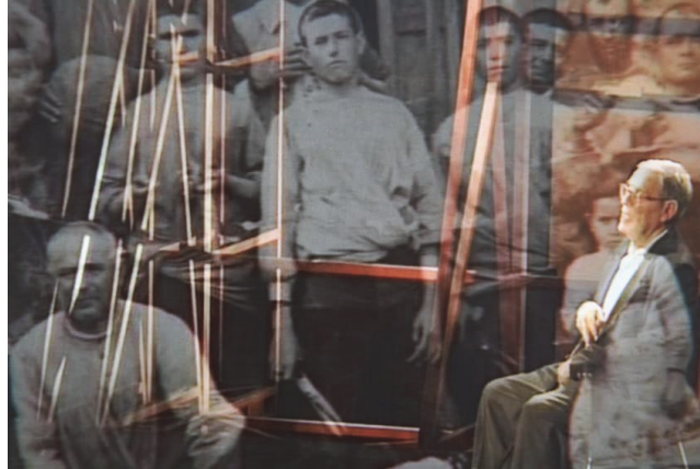
Figura 3. Fotograma del documental de investigación sobre la deportación titulado Memoria del tiempo devastado , producido por IDECA, en 2006.

El proceso de investigación y producción de contenidos continuó con otro documental centrado en la Deportación, titulado Memoria del tiempo devastado (2006), en el que se desarrolló un dispositivo a partir del testimonio de uno de los últimos supervivientes del campo de exterminio de Mauthausen, para una relectura de la experiencia de la guerra. En los últimos años, el desarrollo de contenidos ha estado más centrado en el ámbito de la ficción y el grupo IDECA prepara, para los próximos años, nuevos proyectos de investigación centrados en diversos problemas sociales y