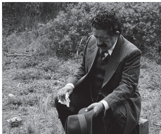
Figura 5. Momento del rodaje del medimetraje de investigación titulado Dirección única y centrado en la muerte del filósofo alemán Walter Benjamin, producido con la colaboración de IDECA, en 2019

a través de talleres formativos profesionales en el Máster de investigación. El otro eje que mencionábamos y que tiene que ver con el desarrollo de programas de prácticas en empresas, se halla sujeto a las tareas profesionales externas