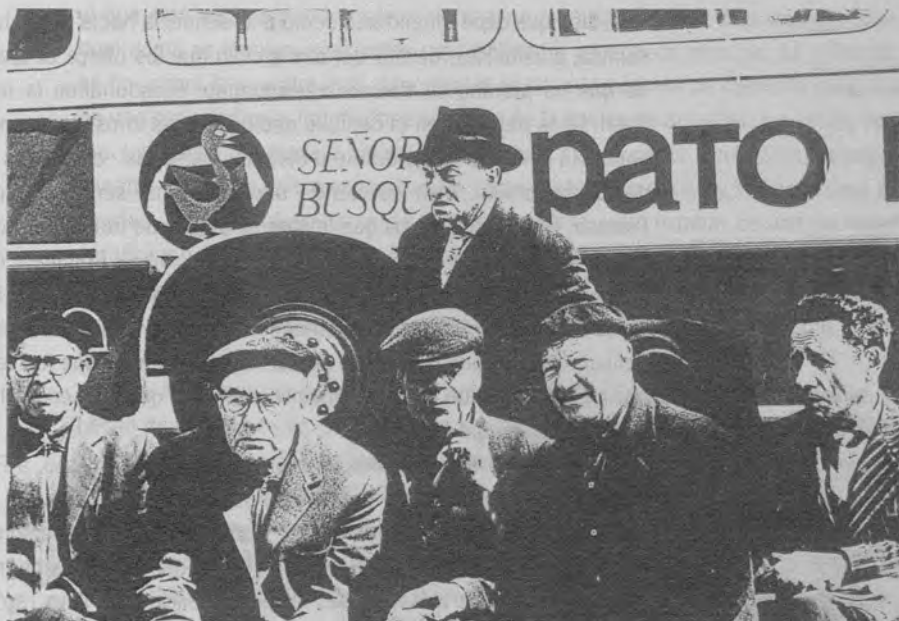
Juguetes rotos (Manuel Summers, 1966).

No obstante, hay quien atribuye el fracaso de esta película no tanto a que destilara un aire triste, casi fúnebre, como al hecho de que los iconos elegidos por Summers para evocar su pasado no tenían idéntica significación ante el resto de personas que la que gozaban en la memoria del cineasta: