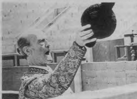
Juguetes rotos (Manuel Summers, 1966).

no llamase la atención a nadie. Por eso adopta una actitud de denuncia (era lo que estaba de moda entonces y lo que se esperaba de un documental al que se le suponía un ejercicio exclusivo de radiografiar críticamente la realidad social) a la par que refuerza la conexión entre pasado y presente. En primer lugar para intentar abrir una grieta por donde conseguir hacer entrar al público