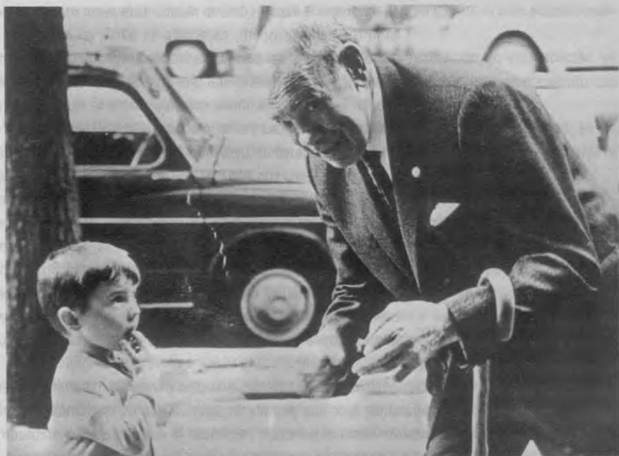
Juguetes rotos (Manuel Summers, 1966).

a unos elementos que motiven el interés del receptor por lo que se le está 'narrando'. La confusión entre realidad y ficción aparece, pues, mucho más definida en la investigación social llevada a cabo por periodistas que por sociólogos. El docudrama se desarrolla de acuerdo a esta pretensión: se trata de informar deleitando, lo cual no dista mucho de lo que después se ha venido denominando sensacionalismo.