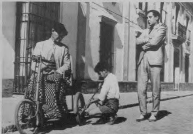
La niña de luto (Manuel Summers, 1964).

De acuerdo a esta precisión conceptual sobre lo que deben considerarse películas documentales frente a aquellas que sólo intentan aproximarse al género, habríamos de plantearnos si en España podemos hablar del desarrollo de un 'corpus de textos' lo suficientemente relevante como para justificar la existencia de esa comunidad de practicantes a la que alude Nichols. En nuestro país apenas ha habido síntomas que nos permitan inferir la existencia de una sólida tradición documental; las películas que se adscriben a estas formas de representación son de difícil análisis, pues aparecen como muestras aisladas de un género casi sin precedentes y con escasa continuidad. Son obras insólitas, perpetradas por el carácter singular de ciertos francotiradores, antes que películas adscritas a una convención preestablecida. Estas reflexiones resultan muy útiles de cara al estudio de un documental como Juguetes rotos , de Manuel Summers. Rodado en 1966, este largometraje escapa a cualquier intento de catalogación, pues no se tiene noticias de que en España se hubiera realizado antes una película documental tan libre, tan transgresora e irreverente con las convenciones de representación implícitas en el género.