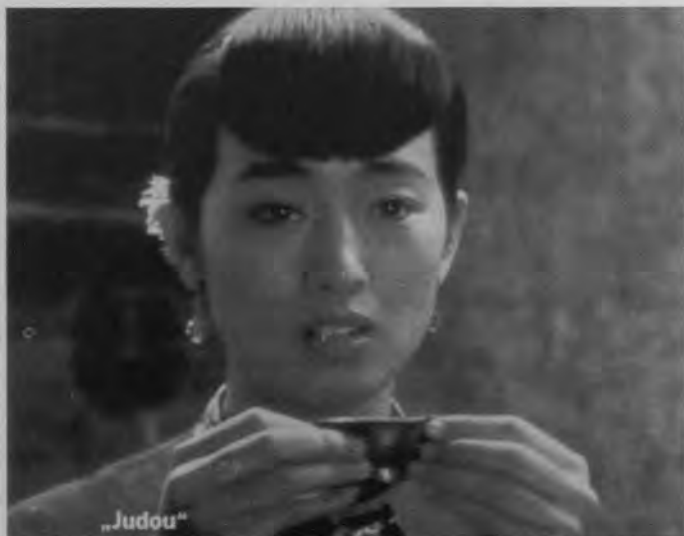
Semilla de crisantemo (Ju Dou, Zhang Yimou, 1990)

de la de Dirigido ), cuya repercusión comercial fue enorme en la primera mitad de los noventa, y el de Chen Kaige, que era denominado "de culto" en los primeros noventa, hasta su nominación al Oscar en 1995. Lo cierto es que la memoria y el recuerdo de las impresiones más recientes son importantes a la hora de juzgar y elegir y no sólo se ven influidos por lo cinematográfico. La revolución social iraní es un tema más reciente en las noticias que los sucesos de Tiananmen, acaecidos en 1990. Y evidentemente ambas cosas están relacionadas de manera clara con la presencia de estas cinematografías en festivales primero y nuestros cines después.