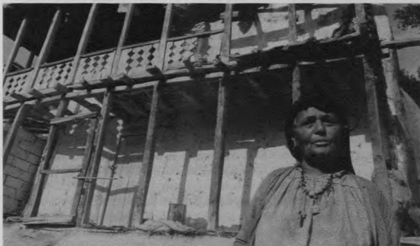
Y la vida continúa (Abbas Kiarostami, 1991)

Elijo al iraní Abbas Kiarostami como el cineasta que le ha dado al cine de los noventa una oxigenación que parecía perdida o, al menos, seriamente disminuida y que, además, es la figura más representativa de una cinematografía sorprendente que, en el marco de un estado teocrático, ha logrado un inusitado nivel expresivo. De manera particular para América Latina y los países del mundo no desarrollado, resulta ejemplar el aporte de Kiarostami a una estética que supera los márgenes de un estrecho realismo y a una propuesta de producción adecuada a las condiciones de nuestros países. Elijo Y la vida continúa (1991) como un título representativo de ese arte mayor con apariencia modesta.