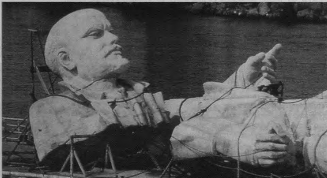
La mirada de Ulises (Theo Angelopoulos, 1995)