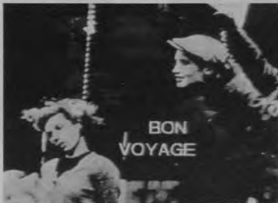
Histoire(s) du cinéma (Jean-Luc Godard, 1986-1998)