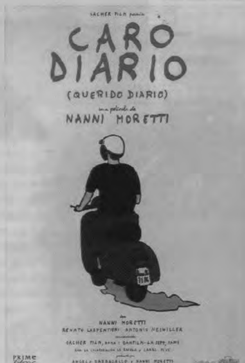
Cartel de Caro diario (Nanni Moretti, 1994)

En cuanto a los directores, me inclinaría por un Tim Burton o un Quentin Tarantino , un poco por motivos similares a los anteriores: su forma de concebir el cine (tanto desde los puntos de vista temáticos, narrativos o de la puesta en escena). Por último, espero que