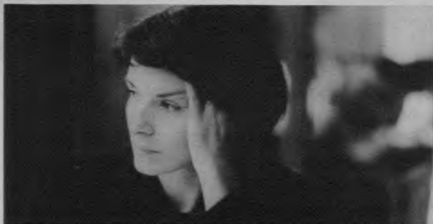
Azul (Krzysztof Kieslowski, 1994)

Película: La trilogía Tres colores: Azul / Rojo / Blanco (1993-1994), de Krzysztof Kieslowski, por su penetrante introspección del alma humana, por su acertado análisis acer-