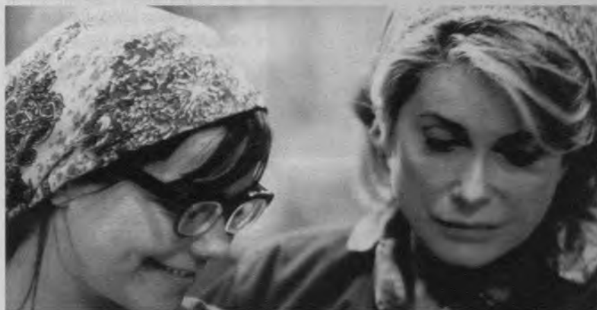
Bailar en la oscuridad (Lars von Trier, 2000)

Desde una perspectiva bastante cercana al punto de vista desde donde se contemplaba la película de Godard, debemos destacar también el rotundo respaldo dado al cine de autor, sobre todo europeo (Lars von Trier, Krzysztof Kieslowski, Nanni Moretti, Víctor Erice, ...), pero también oriental (Abbas Kiarostami, Wong Kar-wai) y, en menor medida latinoamericano, ya que sólo La mujer del puerto (Arturo Ripstein, 1991) y Amores perros (Alejandro González Iñárritu, 1999) se colaron entre las elegidas. Aquí parece más patente el consenso de la crítica, predominando los nombres de algunas figuras que han marcado claramente el panorama cinematográfico y han llenado multitud de páginas de críticas y reseñas en los últimos diez años. Películas como Europa , Rompiendo las olas o Bailar en la oscuridad han