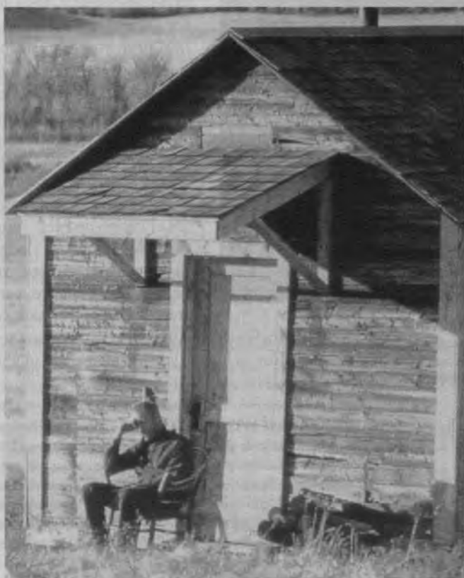
Sin perdón (Clint Eastwood, 1992)

Parece, pues, que frente al predominio del cine de autor, en el que el cine europeo mantiene la entidad de cine de peso y dentro del que, por otra parte, se agrupan producciones de muy diversa índole, se observa menos interés hacia el cine comercial, con o sin pretensiones artísticas, y hacia un cine cuyos canales de consumo sean, de alguna manera, alternativos. Algo que podría hacer pensar en un cambio del perfil académico, antes más cerca de la cinefilia y más apasionado por el cine estadounidense. También sería oportuno pensar sobre esa parte de las opiniones/reivindicaciones que definíamos como de resistencia. Una resistencia que evidencia, por un lado, la distancia que separa el ámbito de la crítica del académico y, por otro, revela una fractura en la que una generación más joven no está representada, ya que los productos filmicos y teóricos que se defienden no son los que conforman sus referentes culturales y cinematográficos. Debemos recordar que, como decíamos al principio, hay algunas opiniones que podrían haber configurado una visión más amplia de lo que fue el cine de la pasada década, pero sencillamente no obtuvimos esas repuestas en nuestra encuesta. Por supuesto, podrían también agregarse otras conclusiones a la vista de estos resultados, insistimos, siempre aproximativos, aunque creemos significativos, sobre el juicio y los criterios que predominan entre los que nos dedicamos al estudio del cine en el ámbito hispano. ☺