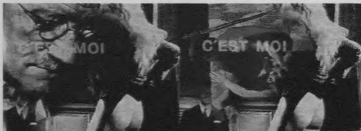
Histoire(s) du cinéma (Jean-Luc Godard, 1986-1998)

pero no por ello teórica ni estática, por inestable y exclusivamente personal que pueda ser, para un progreso futuro, es Histoire(s) du cinéma de Jean-Luc Godard.