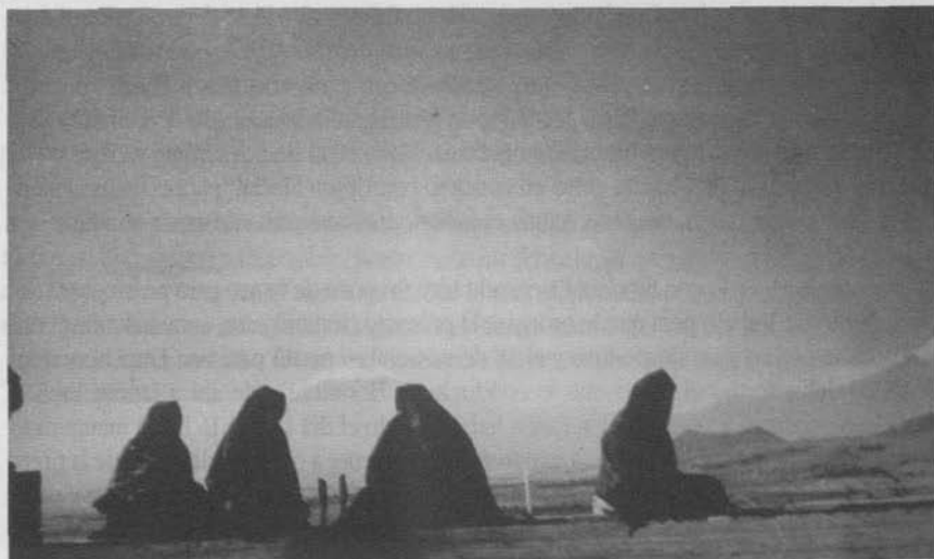
Versión de Alexandrov, bajo la dirección de Eisenstein, de las soldaderas de Orozco.

Los hados volvieron a cruzar los destinos de ambos hombres, pero también en esta ocasión impidieron que estrecharan mano porque continuaba el desinterés mutuo por conocerse. ¿Visitaría Eisenstein la exposición de arte mexicano pese a que México no figuraba en este momento en su proyecto? ¿Cuáles fueron sus impresiones en general y en particular sobre Orozco? Preguntas cuya respuesta quedará pendiente porque, como dije, me inclino a creer que no la visitó ya que a la fecha no conozco una referencia de él sobre tal evento. Pese a todo, pero sobre todo pese al desencuentro, México parece haber comenzado a atravesar por su mente (¿porque leyó la crítica sobre la exposición?) porque el 1 de noviembre compró en Nueva York Here Comes Pancho Villa: the Anecdotal History of a Genial Killer de Louis Stevens, editado ese año en Nueva York, que posiblemente leyó en el tren que tomó el día 3 para Los Ángeles, decidido a empacar sus cosas para tomar el barco que de San Francisco lo conduciría a Japón, vía Honolulu. Es el primer libro de tema mexicano adquirido en esta etapa de su vida, según los que se conservan todavía en su biblioteca. Su visa de permanencia en los Estados Unidos vencía el día 12, por lo que apenas tenía tiempo para levantar casa, empacar y tomar el barco de regreso.