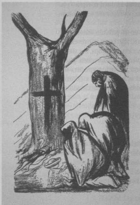
Imagen de las soldaderas de Orozco.

Eisenstein recopiló información sobre Orozco. Sus papeles conservan trazos biográficos del pintor, que no utilizó. Así como un artículo impreso de Alma Reed sobre el pintor, desprendido de una revista de la que no anotó el título, que habla de la trayectoria de Orozco en la que Eisenstein acotó la primera exposición del pintor en 1915, con la anotación «una protesta pública contra el dominio del imperialismo»; recibió también un inventario fotográfico del mural Prometeo , que, deduzco, Eisenstein no conoció in situ durante su estancia en Los Ángeles, pues, repito, durante su permanencia en Hollywood parece haber tenido un desencuentro con México. Es posible que Alma Reed a través de Aragón Leiva le remitiera esa información, pues el portafolio Alma lo tenía listo en diciembre de 1930, cuando lo remitió a periodistas neoyorkinos. Para ese momento, conocía ya los juicios de varios autores sobre Orozco, como los de Anita Brenner y Ernest Grüening, además del libro de Azuela; también había tenido oportunidad de conocer los murales in situ en la ciudad de México, como los de la Escuela Nacional Preparatoria y la Secretaría de Educación Pública, para tener una idea de la ubicación de cada artista dentro de la plástica mexicana. Adquirió, por