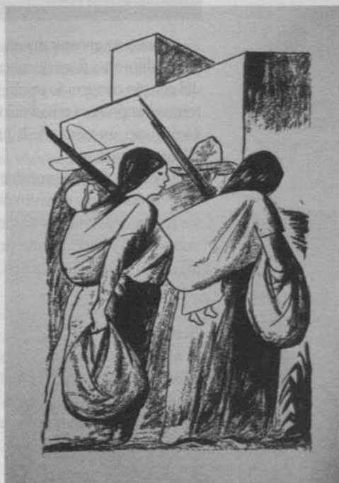
Imagen de las soldaderas de Orozco tomada del ejemplar de Eisenstein de la traducción al inglés de Los de abajo de Mariano Azuela. Museo Eisenstein de Moscú.

No es remoto que en las conversaciones entre Eisenstein y Aragón Leiva hubiera surgido el tema de Orozco, y que aquél le manifestara su admiración hacia éste. Aragón Leiva con seguridad se ofreció a ponerlo en contacto, ya que lo conocía bien, además de haber sido,