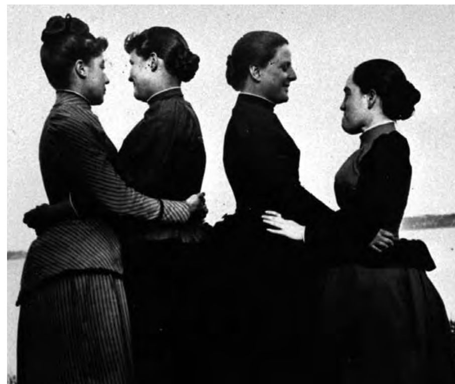
The Female Closet (1998)