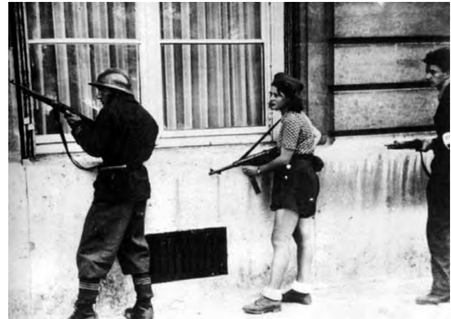
Resisting Paradise (Barbara Hammer, 2003)

que funcionan como balance de su relato/retrato y como apelativo a la audiencia. Un bombardeo de eslóganes en tercera persona del singular con los que invita a una toma de conciencia por parte del espectador o la espectadora: «EVITA LA ASIMILACIÓN», «CONVIÉRTETE EN UN YO DOBLE», «INVÉNTATE A TI MISMO», «MASCARADA», «PLANIFICA TU REPRESENTACIÓN», «ATRAVIESA CULTURAS», «MULTIPLICA LOS ROLES», «DUDA DE TUS RECUERDOS...». En definitiva, un llamamiento a la autodesignación de la identidad propia del pensamiento queer y a un travestismo en los roles de género de acuerdo a los momentos vitales y necesidades propias más allá de lo establecido por el orden simbólico patriarcal. Bajo este prisma, cabe leer también Tender Fictions como un filme autobiográfico que, gracias a sus fuertes resonancias teóricas, deconstruye la ideología del género que invita a superar la visión dual del mundo en categorías antagónicas (masculino/femenino) y, con ello, a desestabilizar la jerarquización de los mismos que ha realizado el patriarcado. Emerge un nuevo gesto micro-político en la película de Hammer que nos remite a ese yo contemporáneo que rechaza ser acotado y que aboga desde una perspectiva feminista, tal y como lo ha expresado Beatriz Preciado, por el des-reconocimiento y la des-identificación puesto que ambas serían condición y posibilidad de intervenir y transformar la realidad. 28 En la misma línea se sitúa Teresa de Laurentis, para quien este des-plazamiento es una fuente de resistencia de: