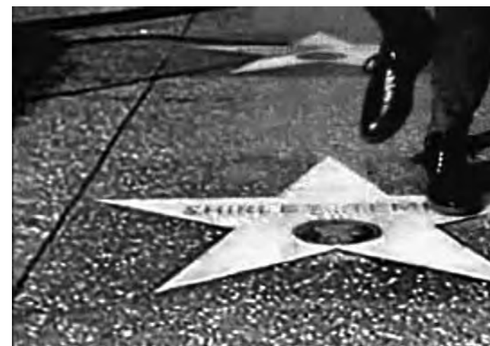
Tender Fictions (1996)