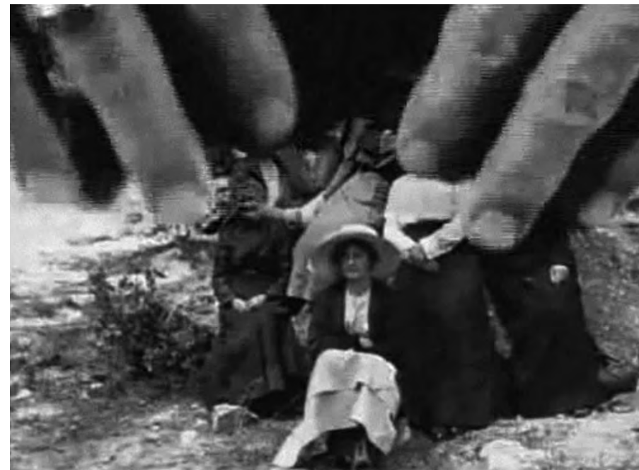
Tender Fictions (1996)

una mujer que ama a las mujeres y en concreto a una mujer, su respuesta, subrayada con un arpegio, será: «Oh, suena realmente bien». Tras relatar su primera relación sexual con una mujer, Hammer reafirma mediante una pregunta retórica su nueva identidad: «¿Era yo una lesbiana? Sí, era lesbiana».