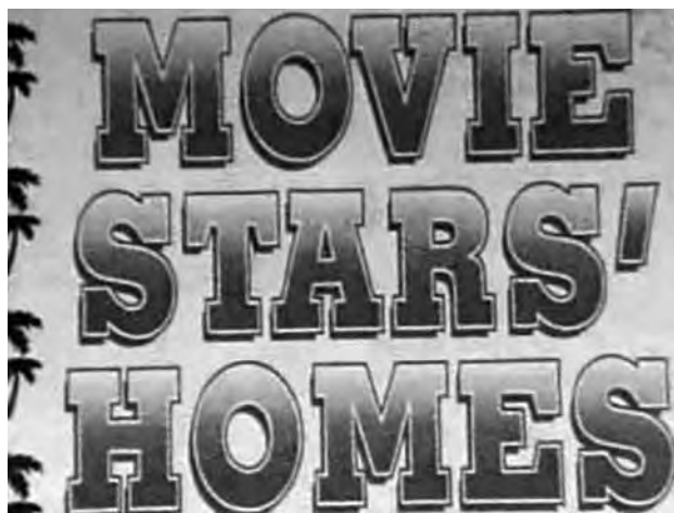
Tender Fictions (1996)