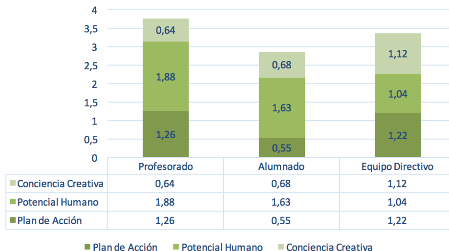
Figura 1. Valoración general del desarrollo educativo del centro