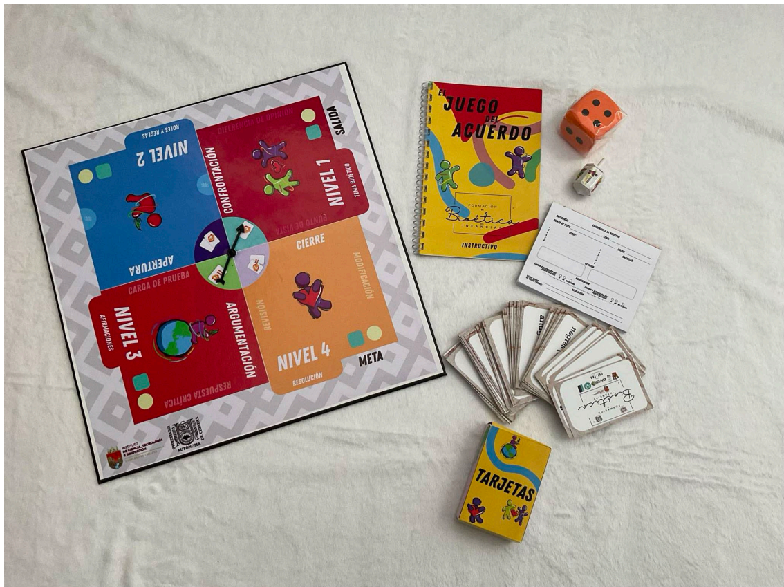
Ilustración 5: Piezas del Juego del Acuerdo

fotográfico pueden apreciarse las piezas que integran la herramienta lúdico-didáctica.