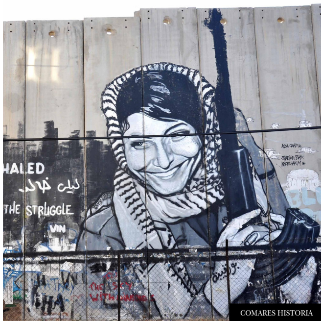
Figura 2: Portada del Libro “Existir es resistir” con la imagen de Leyla Khaled.

La nación palestina feminizada y representada como símbolo destaca por su caracterización. A diferencia de otros estudios de caso, por ejemplo, el de Indonesia, donde la nación se representa como un ser frágil y que necesita ser rescatado, protegido y cuidado de la crueldad de un poder externo (Sunindyo, 1998), la patria palestina no se representa como frágil, aunque sí con necesidad de protección, pero tiene fortaleza y eso la diferencia de otras representaciones de la nación feminizadas. Enloe (1989) sostiene que las mujeres han sido relegadas a un papel secundario en la construcción de la nación, frecuentemente simbólico, como icono para ser elevado o defendido, y son los hombres los actores reales que defienden la libertad, honor, patria y a sus mujeres. La patria palestina no tiene un papel simbólico menor, ya que se convierte en una forma de fortalecer la identidad al mismo tiempo que representa la lucha por la existencia de la nación en un ejercicio de memoria colectiva que se mantiene viva a través de la imagen y el símbolo.