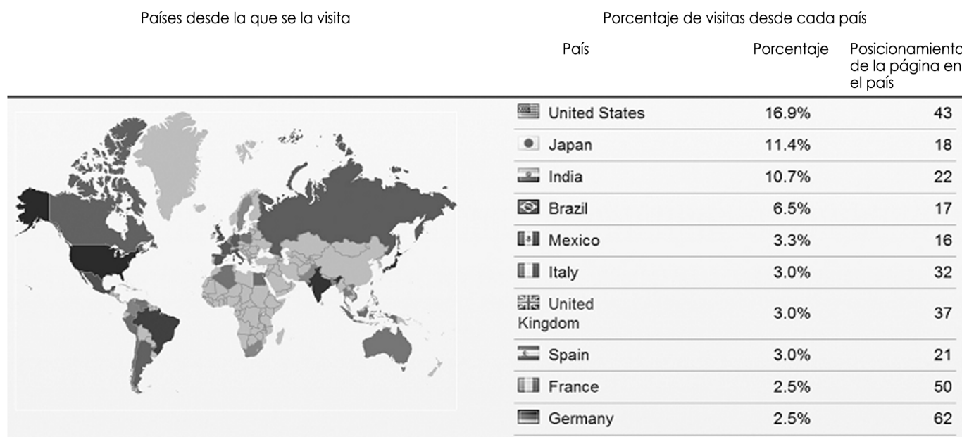
Figura 2. Consumo Mundial de XVideos. Se muestra una tendencia generalizada de consumo de países desarrollados o emergentes, exceptuando Asia Oriental. Estados Unidos encabeza la lista de países consumidores de xvideos (Alexa, 2014).