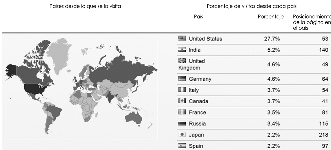
Figura 1. Consumo Mundial de Pornhubs. Se muestra una tendencia generalizada de consumo de países desarrollados o emergentes, exceptuando Asia oriental. Estados Unidos encabeza la lista de países consumidores de Pornhub (Alexa, 2014).

El 17.8% de este colectivo que consume pornhubs acceden a la página porque la conocen previamente (Alexa, 2014). Las palabras más introducidas en este portal son: