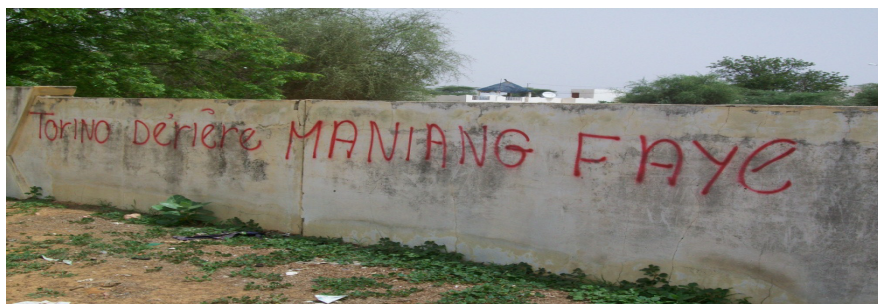
Foto: Apoyo a los emigrantes senegaleses residentes en Turín (Gouvernance de Louga, 2010) 7

Otros emigrantes, estratégicamente, apoyan a candidatos en las elecciones locales pensando en encontrar la mejor fórmula para adquirir privilegios a través de ellos, tales como la cesión de terrenos, mercados públicos, o la dispensa de pagos de tasas comunales. En la ciudad de Louga, una de las cuencas migratorias senegalesas, se crearon comités de apoyo en la víspera de las últimas elecciones locales. Esta fórmula fue vista por las poblaciones locales como una estrategia conducida por algunos emigrantes residentes en Turín, Italia, que pretendían más bien adquirir privilegios del candidato que resultara elegido alcalde. Por otro lado, estos emigrantes no cesaban de hacer declaraciones en nombre de la comunidad de emigrantes de Louga residentes en Italia a través de las emisiones de radios locales.