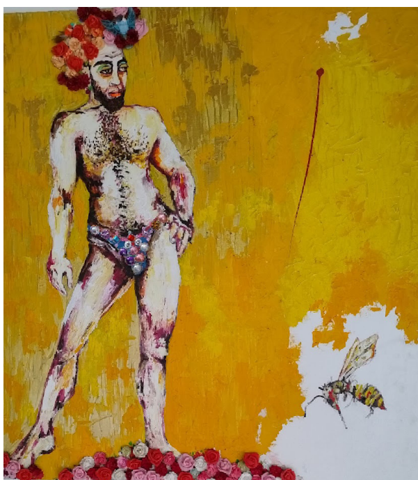
Artista: Guillermo Correa. Acrílico sobre lienzo y bisutería. 120 x 150 cms