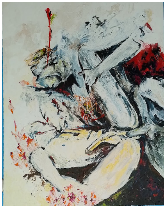
Artista: Guillermo Correa. Acrílico sobre lienzo. 100 x 90 cms.