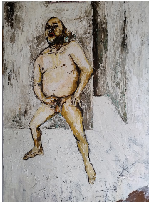
Artista: Guillermo Correa. Acrílico sobre madera. 80 x 60 cms