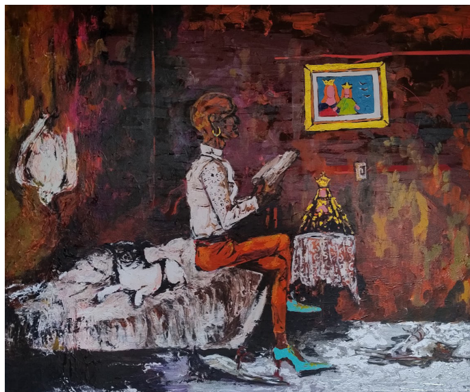
Artista: Guillermo Correa. Acrílico sobre lienzo. 120 x 150 cms.