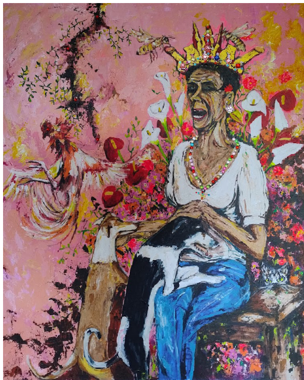
Artista: Guillermo Correa. Acrílico sobre lienzo y bisutería. 120 x 150 cms