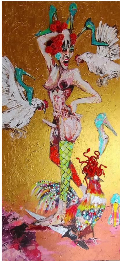
Artista: Guillermo Correa. Acrílico sobre lienzo y bisutería. 90 x 160cms