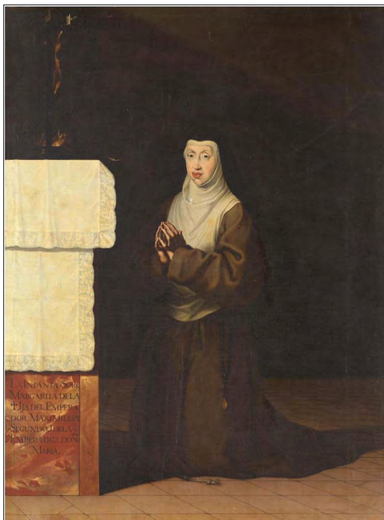
Fig. 5. Matías de Torres, sor Margarita de la Cruz, segunda mitad del siglo XVII, óleo sobre lienzo, 168 x 126 cm, Madrid, Museo Nacional del Prado, n° inv. P001275 © Museo Nacional del Prado.

Por tanto, y para entender las primeras noticias que nos llegan acerca de esta imagen, es importante destacar el control ejercido por fray Juan de Palma, como confesor y biógrafo de sor Margarita de la Cruz, sobre los recursos empleados por la retórica del poder para sacralizar todo aquello que girase en torno al mismo 12 . La labor