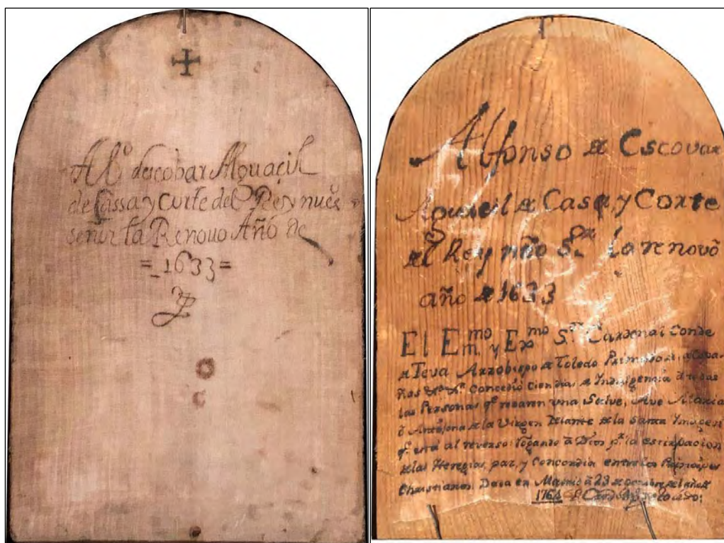
Fig 3. Detalle de la trasera (siglo XVII). Texto: “Alfonso de Escovar alguacil de casa y corte del rey nuestro señor lo renovó año de 1633” y Detalle de la trasera (siglo XVIII). Texto: “Alfonso de Escovar alguacil de casa y corte del rey nuestro señor lo renovó año de 1633”.

El reverendísimo y Excelentísimo señor cardenal, conde de Teva Arzobispo de Toledo, primado de Españas [...] concedió 100 días de Yndulgencia a todas las personas que rezaren una Salve, Ave María o Antífona de la Virgen delante de la sacra Ymagen que está al reverso rogando a Dios por la extirpación de las heregías, paz y concordia entre los príncipes cristianos. Dada en Madrid a 23 de octubre del año de 1764. El cardenal obispo de Toledo.