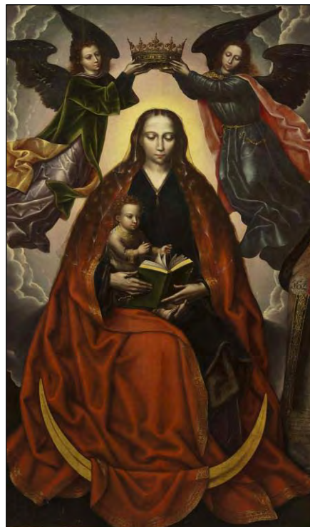
Fig. 10. Marcellus Coffermans, Coronación de la Virgen , siglo XVI, óleo sobre tabla, 180 x 102,70 cm, Sevilla, Museo de Bellas Artes de Sevilla, n° inv. CE0045P.