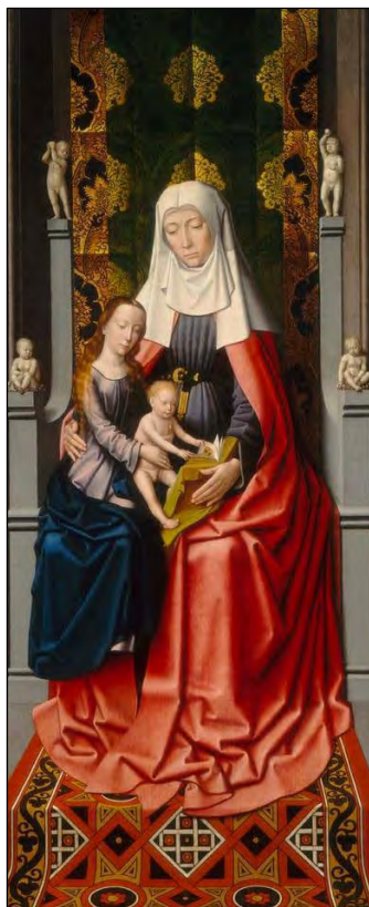
Fig. 8. Gerard David, Santa Ana, Virgen María y Niño Jesús, principio del siglo XVI, óleo sobre tabla, 232 x 96 cm, Washington, n° inv. 1942.9.17.b.

Es conocido el crecimiento experimentado por la ciudad de Amberes a inicios del siglo XVI y su repercusión, entre otros factores, en el auge de los gremios afincados en esta ciudad 41 . Entre ellos, cabe destacar la importancia del gremio de pintores que reunió a significativos referentes para la pintura flamenca como Bernard van Orley, Pieter Coeck van Aelst o Quentin Massys 42 . Sin embargo, el estilo de la tabla conservada en la fundación madrileña parece estar más próxima al trabajo de generaciones posteriores que también se beneficiaron del mencionado auge experimentado por esta ciudad. Por ello, parece oportuno comparar nuestra composición con la generación de seguidores de los primitivos flamencos activa en Amberes a mediados del siglo XVI. Dentro de esta última, encontramos la figura de