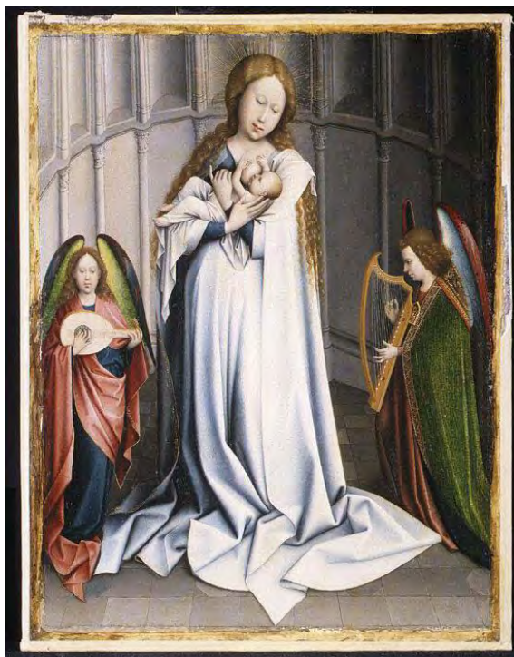
Fig. 6 Copia según Robert Campin, La Virgen en el ábside, óleo sobre lienzo, trasladado de una tabla, 45 x 35 cm, Nueva York, © Metropolitan Museum of Art, n° inv. 05.39.2