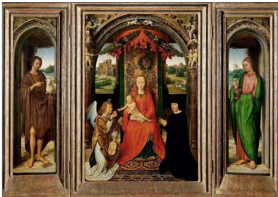
Fig. 7 Hans Memling, El Altar de los Santos Juanes, 1485-1490, óleo sobre tabla, 69,3 x 47 cm, Viena, n° inv. Gemäldegalerie 930.