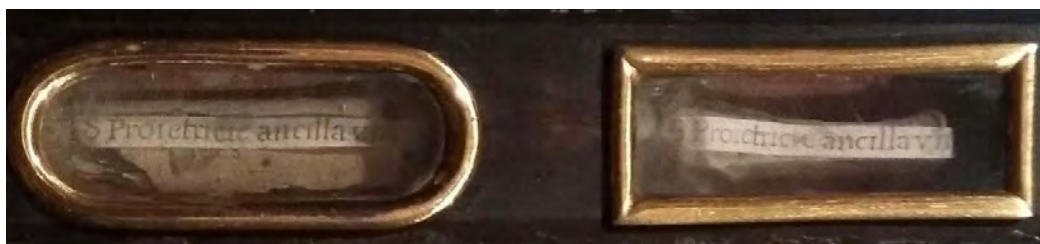
Fig. 4. Detalle de las reliquias y sus cartelas donde se repite el nombre "Santa Proetrice Ancilla virgen y mártir".

Además, este mismo listado nos describe obras como "una imagen de nuestra señora de la Fe de Flandes" o, "Dos capillas de nogal con imágenes de Nuestra Señora oprobadas que vinieron de Flandes" 8 . Pese a que no coincidan con la obra actualmente conservada, estas menciones, no solo nos remiten al ámbito de producción del que procede la Virgen de la Cuchillada , sino que, además, introducen un matiz significativo respecto a algunas de las tablas flamencas que se conservaron en el relicario, su estatus como imágenes "oprobadas". Efigies religiosas que habían sufrido algún tipo de agravio o lesión por manos heréticas y que, finalmente, habían sido rescatadas por fieles católicos. En relación a esta clasificación que los inventarios del siglo XVII hacen sobre las imágenes conservadas en el relicario y llegadas desde Flandes, resulta igualmente significativa la descripción que, sobre esta imagen, ya totalmente identificable, hacen un conjunto de inventarios datados durante la primera mitad del siglo XX. En ellos, la imagen que actualmente se cataloga bajo el título Virgen de la Cuchillada es descrita siguiendo la tradición oral de la propia comunidad en la que se ha conservado, donde fue conocida como "la rescatada [...] porque, según tradición, San Juan Capistrano, la rescató de unos herejes" 9 .