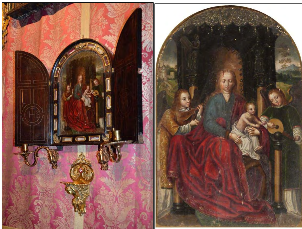
Fig. 1 Círculo de Marcellus Coffermans, Virgen de la Cuchillada , óleo sobre tabla, siglo XVI, 32 x 23 cm, Relicario del Monasterio de las Descalzas Reales en Madrid, Patrimonio Nacional, PN 00612499.