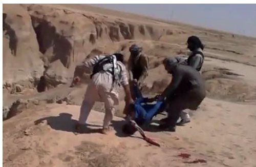
Fig. 6: Al Hota, Raqqa (Raqqa is Being Slaughtered Silently, RiBSS, 2017) https://www.raqqa-sl.com/?p=5012

por ISIS 35 . En otro sitio turístico es el llamado Al Hota , conocido por los arqueólogos europeos que excavan en el norte de Raqqa. Al Hota (significa el pozo en árabe) es un pozo natural enorme de profundidad desconocida. Varios proyectos de inversión turística habían sido planeados por el gobierno, pero este atractivo lugar se ha convertido durante la ocupación del ISIS en un cementerio o fosa de enterramiento colectivo de todos aquellos que estaban en contra del ISIS. Según la población local hay más de tres mil cadáveres arrojados dentro. Finalmente, ISIS ha vertido catorce cisternas de petróleo puro dentro y ha quemado sus crímenes, el olor a petróleo y carne quemada de los cadáveres humanos permaneció durante varias semanas.