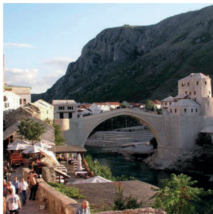
Fig. 1: El Puente de Mostar (UNESCO) https://whc.unesco.org/en/list/946/gallery/

La comunidad internacional trabajó en la restauración y promoción del patrimonio de Kosovo, puesto que se creía que podía usarse como herramienta de la coexistencia y el dialogo entre las comunidades en combate. La Unión Europea ha señalado que el patrimonio puede servir como un puente entre comunidades de diversas religiones y etnias 13 . La reconstrucción simbólica del Puente de Mostar