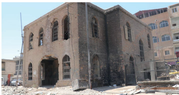
Fig. 4: Restauración del Museo Arqueológico de Raqqa (SDF, 2018).

Otras iniciativas se habían lanzado por varias ONGs como la Rama de Olivo en el sur de Siria con el fin de mejorar las condiciones de vida y educación con uso limitado del patrimonio. Otro ejemplo es la Organización de Visión en Raqqa, que ha hecho la restauración del Museo Arqueológico de la ciudad, bombardeado varias veces a partir de 2013 25 .