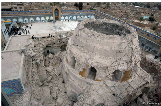
Fig. 3: Rehabilitación de la Mezquita de Al Askari (UNESCO) http://www.unesco.org/new/en/iraq-office/culture/samarra-shrine-restoration/

Otro ejemplo en Iraq fue la rehabilitación de la Mezquita y Santuario de al-Askari en la ciudad histórica y religiosa de Samara, que tiene importancia sobre todo para los musulmanes Chiitas porque alberga el santuario de un personaje religioso, el Imam al-Askari . En 2006 y 2007 el santuario fue bombardeado y el país estuvo a punto de estallar en una guerra civil entre las comunidades Sunitas y Chiitas de Iraq.