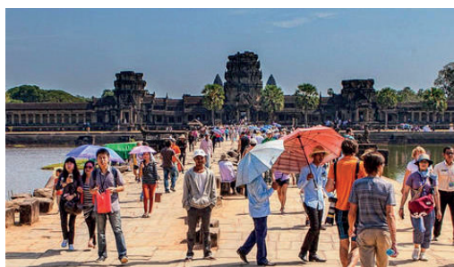
Fig. 5: Restauración de Angkor (UNESCO).

La experiencia de Asia Oriental es un ejemplo a seguir, una región que sufría de conflictos durante ciento cuarenta años desde la Guerra de Opio de 1839 hasta la Guerra Chino-Vietnamita 1979, y ofreció entre 1946-1979 el 80% de los fallecidos en conflictos en todo el mundo. Ahora en la zona reina la paz desde hace cuarenta años, gracias al crecimiento económico 32 . De la misma manera, en Camboya, la restauración de los templos de Angkor ha aumentado asombrosamente el número de visitantes y turistas internacionales un 10.000% en una década.