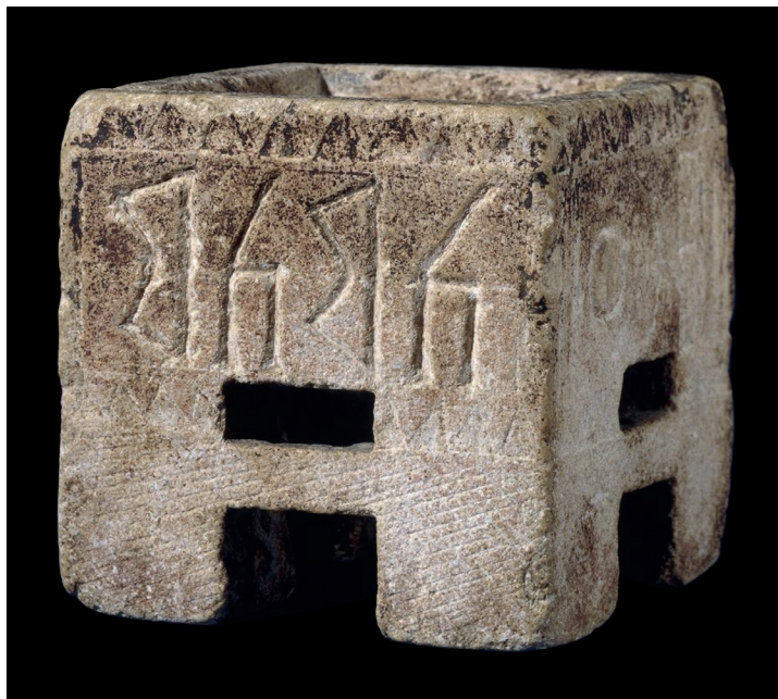
Fig. 5. Incensiere in pietra cuboidale yemenita con iscrizione in sud-arabico V-IV a.C. (© The Trustees of the British Museum).

su un incensiere da Lachish in Palestina 31 . In Egitto, invece, i 'legami essenziali' connaturati all'uso religioso dell'incenso pare abbiano avuto una maggiore resistenza, se gli gnostici Copti durante la dominazione romana lo intesero ancora come un medium della rinascita, in accordo dunque con il significato che la preziosa essenza sud-arabica aveva già nell'Egitto dei Faraoni, ma dopo aver traslato il suo ben noto 'odore di santità' dal paganesimo alla religione cristiana 32 .