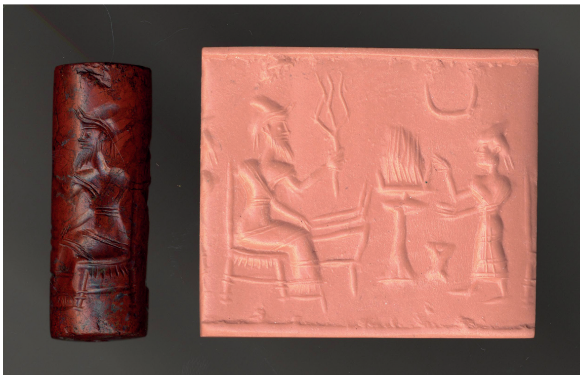
Fig. 2. Sigillo medio assiro in diaspro rosso BM 85486.

E certamente, l'addomesticamento del dromedario alla fine del secondo millennio a.C. permise di aggiungere alle rotte commerciali che dall'età protostorica risalivano il Tigri e l'Eufrate anche le piste del deserto e le vie carovaniere che collegavano la Penisola Arabica sud-orientale all'Egitto, alla Siria-Palestina e dunque alle coste del Mediterraneo orientale 18 . Tra la fine del secondo millennio e gli inizi del primo millennio a.C. fu infatti dai centri portuali di Ugarit, Biblo, Tiro e Sidone che, insieme a molte altre mercanzie, salparono per l'Egeo, spesso in preziosi contenitori finemente decorati, diversi beni esotici di natura organica, e tra questi anche le resine sud-arabiche.