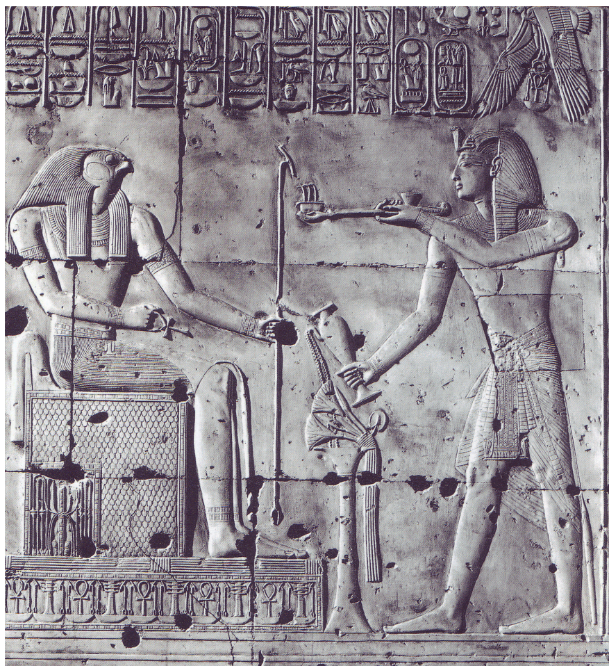
Fig. 3. Rilievo dal tempio di Seti I ad Abido (XIX dinastia) (da Wise 2009: 68, fig. 1).

Nel corso del primo millennio a.C., il commercio delle resine arboree fu controllato dai Sabei dell'Arabia meridionale, i cui re — già riconosciuti a capo di una potenza a carattere territoriale dai sovrani assiri dell'VIII e VII secolo a.C. 23 — furono capaci di organizzare lunghe carovane di cammelli e dromedari che raggiungevano il Medio Eufrate siriano e trasportavano ingenti quantità di incenso e mirra 24 . In alcuni casi, i commercianti dell'assai versatile bdellium , la resina confrontata nell'Antico Testamento con la manna, sembrerebbero anche aver esercitato una specie di monopolio, come lascia intendere la notizia che alcuni generali del re assiro Assurbanipal (669–626 a.C.) ne confiscarono 5.28 tonnellate ad un tale Nabu-bel-sumate, probabilmente un trafficante babilonese. Ed è possibile che questo commerciante gestisse proprio la tratta delle resine che dal Dhofar in Oman meridionale, giungevano nella Babilonia multiculturale e centro del mondo passando probabilmente per Dilmun (Bahrein) 25 e per Nippur, dove infatti vennero rinvenuti una grande quantità di incensieri cuboidali, decorati con semplici motivi di piccoli cerchi e fregi triangolari, come molti degli esemplari in pietra più antichi 26 . D'altronde è in questo medesimo periodo, ovvero nell'Età del Ferro II–III, che assistiamo anche all'incremento del commercio di aromi,