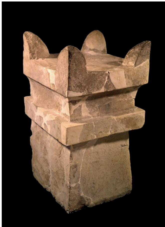
Fig. 4. Altare in pietra con funzione di incensiere da Megiddo, Età del Ferro II.

fragranze e dell'incenso Arabico nella Palestina meridionale 27 , dove non solo sono stati riconosciuti gli antichi bruciaprofumi di forma cuboidale e i contenitori su treppiedi in clorite spesso internamente rivestiti in metallo per ricevere la resina, ma anche i tipici incensieri di pietra, come quello di Megiddo, che terminano nella cyma egizia e rappresentano alte torri e parti della loro decorazione architettonica (fig. 4) 28 .