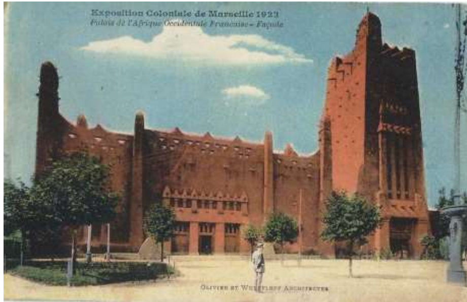
[Fig.1] Pavillon de l'Afrique-Occidentale française à l'Exposition coloniale de Marseille de 1922 14

Pour « l'Exposition Nationale Coloniale » de Marseille, une brochure spécialement consacrée à la Mauritanie est publiée – c'est aussi le cas pour les sept autres territoires de l'A.O.F.. En plus d'une évaluation des qualités touristiques du pays, celle-ci fait une présentation sommaire du pays, de son peuple et de ses traits culturels: