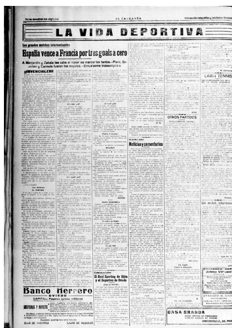
Figura 1: Muestra sección deportiva.

Surgirían, así, las primeras entidades deportivas, muchas de ellas de carácter multidisciplinar, entre las que podemos citar el Foot-Ball Club Escolar, emanado de la Unión Escolar Ovetense (1901) 42 , primer equipo de fútbol de Asturias 43 , el Sport Club Avilesino 1904 44 , así como la Unión Ciclista Gijonesa (1903) 45 , el Club Astur de Natación (1910) 46 y el Athletic Club Ovetense, este con una cronología más tardía. Estas primeras agrupaciones se irían estructurando y especializando con la creación de las primeras federaciones deportivas asturianas, como la de 47 fútbol 48 y la de boxeo, creadas en 1926 49 , y con el surgimiento de las primeras grandes competiciones locales. Entre estas, podemos destacar los campeonatos de natación (1920) 50 y la Vuelta a Asturias, impulsada por la Unión Ciclista Gijonesa en el mismo año 51 . Del mismo modo, sería a finales de las décadas de los 1920 y principios de la de los 1930 52 , cuando aparecerían los deportes de implantación tardía como el esquí, el waterpolo y el beisbol, entre otros.