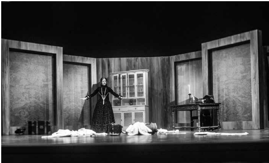
La escenografía jugaba con la luz y con las transparencias de las gasas.