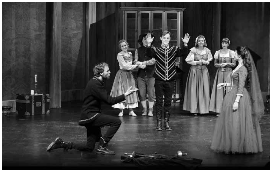
Final de la representación con la capa y la espada en proscenio.

Esta puesta en escena de La dama duende nos hablaba del triunfo del amor pero, a su vez, situaba el honor como parte indispensable del mismo, no hay amor sin honor: uno es reflejo del otro. La luz y la sombra, inspiradas en la pintura barroca, creaban una iluminación que, además de generar el sentido del tiempo oscilando entre la noche y el día, permitían que el espacio se iluminara u oscureciera al abrirse o cerrarse las puertas del cubo. Esta luz encerrada y filtrada por la escenografía generaba un efecto en el momento en el que doña Ángela declara su amor a don Manuel y este dice: «¿Qué haré en tan ciego abismo / humano laberinto de mí mismo?» (vv. 3007-3008, versión V), debatiéndose entre el honor que le empujaba a revelar el secreto a su amigo y anfitrión, don Luis, o su —ya en este punto de la trama— amor hacia doña Ángela. Justo ahora las puertas del cubo se