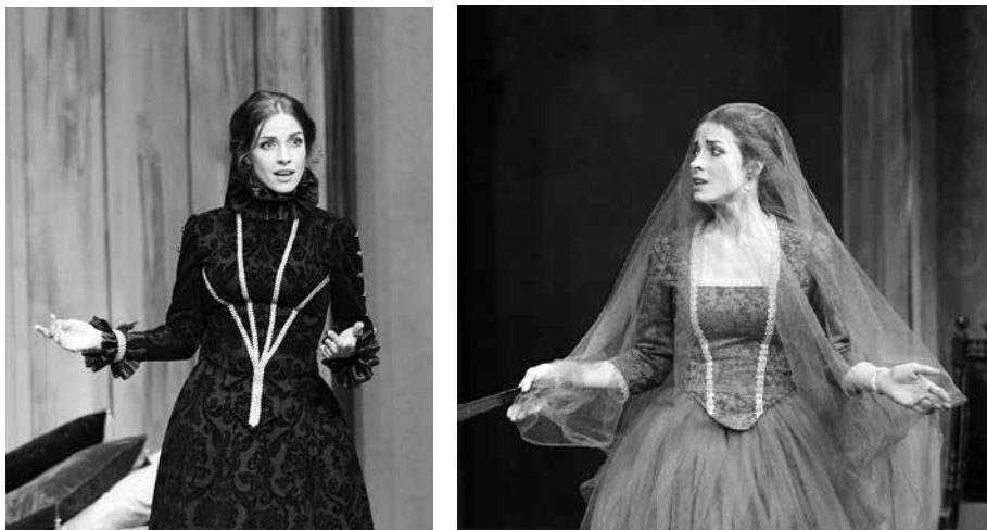
Cambios de vestuario de doña Ángela. El primero era negro y el segundo rojo y con el velo verde oscuro.

rostro y, por lo tanto, daba una imagen triste del personaje. Además de la cuestión dramática, de la libertad de la calle al encierro de la habitación, la elección del verde respondía a la búsqueda de los complementarios en la rueda de color, rojo el vestido y verde el velo, que generan un tipo de armonía cromática con especial fuerza visual.