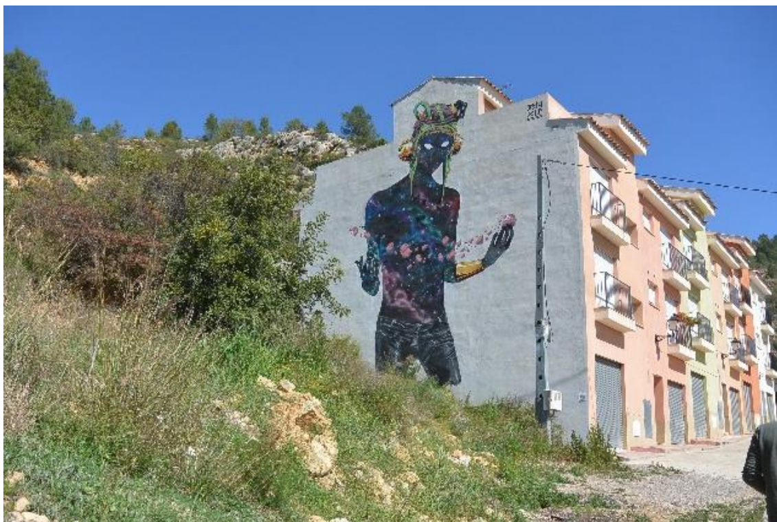
Fotografía 2. Obra “The visitor” del artista Deih, en la parte alta del pueblo

Concretamente en Fanzara, el tratamiento que se le da a la degeneración de los murales se dependerá de la obra en sí. “En muchas ocasiones tanto los artistas como los vecinos consideran que las obras deben tener una duración determinada, bien porque la degradación se considera parte de la pieza, bien porque detrás deban venir otras” (Luque Rodrigo, 2016, p.121). Puesto que el espacio disponible para la pintura de murales dentro del pueblo es limitado, el desgaste de algunas obras supone la posibilidad de un nuevo espacio para la creatividad; y así, adquiere una nueva dimensión lo inacabado, entendiéndose como una galería en constante expansión (Cuevas, 2015).