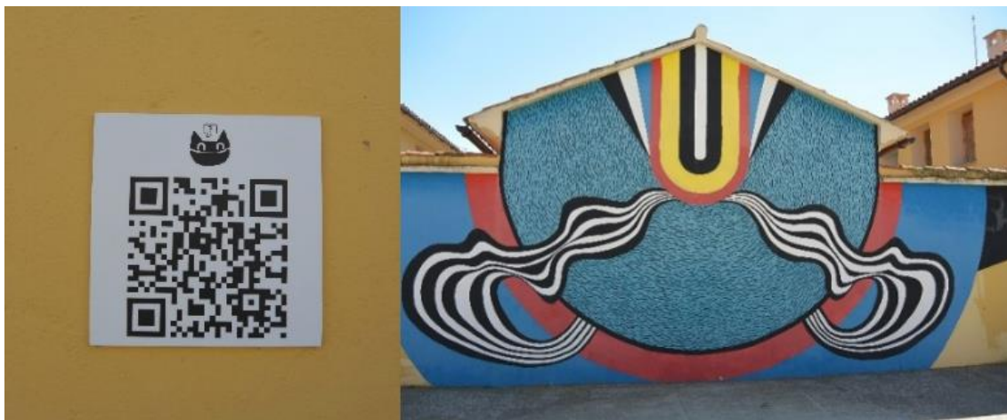
Fotografía 3. Código QR del mural 59, que al ser escaneado deriva a la obra del artista Joan Tarragó (a la derecha). Fotografía 4: Obra “Simetría” de Joan Tarragó.

se puede optar a un premio. Por otra parte, el registro de cada obra en la web, compone una suerte de catálogo digital en donde están inventariadas las piezas del museo.