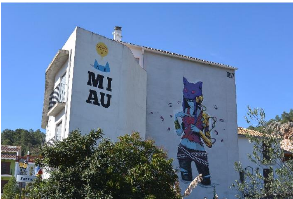
Fotografía 1: A la izquierda el logo MIAU del artista Pincho, y a la derecha la Gata del artista Deih.

El Museo Inacabado de Arte Urbano se identifica de manera directa con el paisaje de Fanzara; en otras palabras, el pueblo constituye el museo. Y, dado que las instituciones oficiales no le reconocen como tal, cabría preguntarse sí, más allá de lo decorativo y estético, el MIAU puede considerarse como museo. Para resolver esta interrogante, es necesario remitirse a las acciones, en esta dirección, que desde él se llevan a cabo.