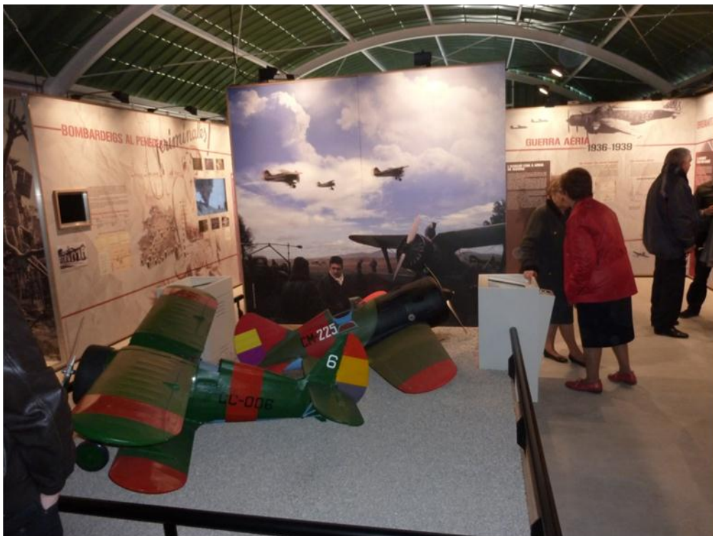
Figura 4. Museo didáctico del aeródromo republicano de Els Monjos (Barcelona).