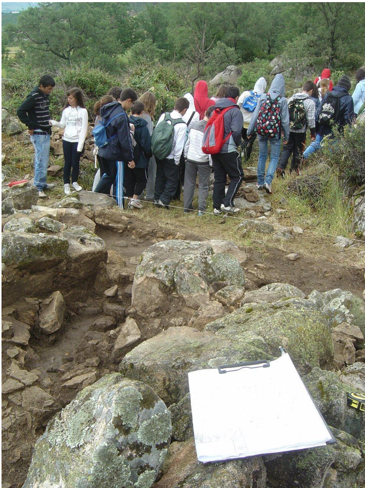
Figura 1. Estudiantes de secundaria en una visita guiada en las excavaciones de los restos del penal de trabajos forzados de Bustarviejo (1941-1957).

http://guerraenlauniversidad.blogspot.com.es/ .