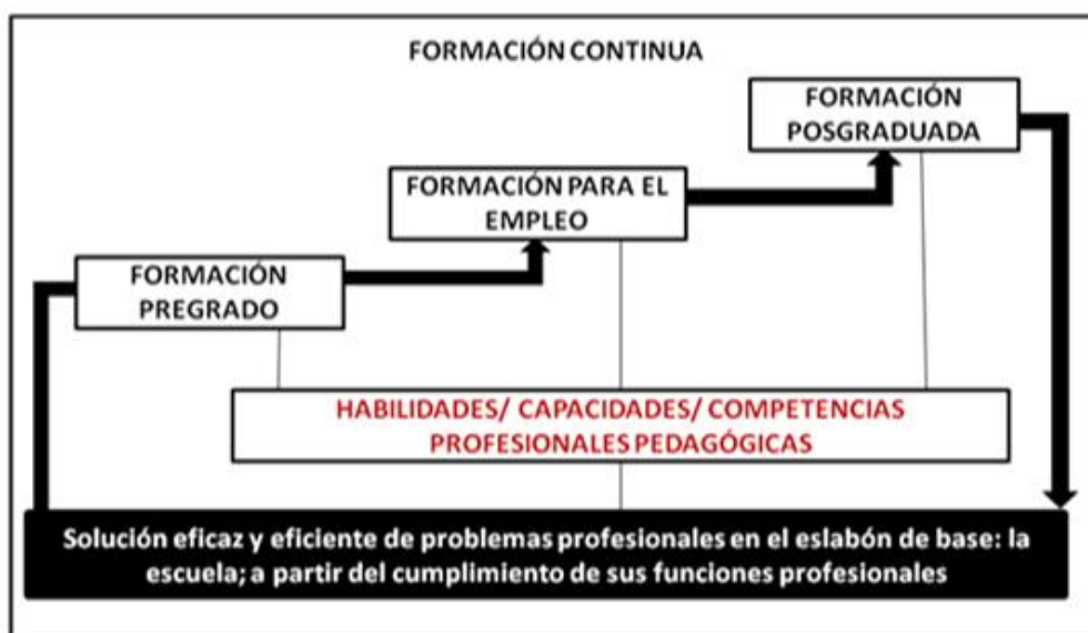
Gráfica 1. Modelo de formación docente en Cuba

La formación docente, en Cuba, se sustenta en un modelo de formación continua que inicia en la formación de pregrado, en el que se educa al individuo para su labor en el eslabón de base. Esta formación inicial se complementa, luego egresado, con la preparación para el empleo y las diferentes formas de formación posgraduada, es decir, la superación profesional –curso, entrenamiento y diplomado- y la formación académica –especialidad, maestría y doctorado-.