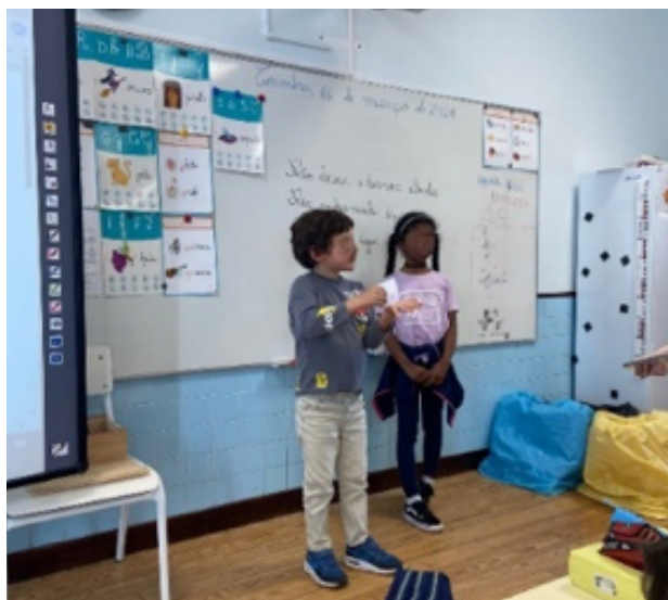
FIGURA 4. Discussão da tarefa – confronto de ideias sobre a poupança da água

Após este momento foi realizada a apresentação das ideias de alguns grupos, selecionados pelas professoras estagiárias, e ocorreu uma discussão em grupo-turma acerca das ideologias debatidas em cada uma das etapas de debate em pequenos grupos (Figura 4).