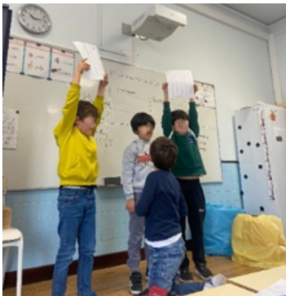
FIGURA 8. Discussão da tarefa - comparação de ideias sobre o gráfico de pontos e os seus elementos

Após este momento foi realizada a apresentação das ideias de alguns grupos, selecionados previamente pelas professoras estagiárias, e ocorreu uma discussão em grupo-turma (Figuro 8) acerca das tabelas de contagem, das representações gráficas e dos seus elementos constituintes e ainda das folhas de interpretação das representações gráficas construídas pelos alunos.