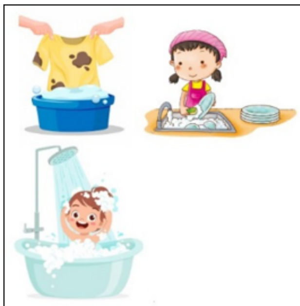
FIGURA 2. Imagens representativas do mau uso da água

Esta prática surge enquadrada no Dia Mundial da Água, sendo que no dia anterior à ocorrência desta sessão se ouviu e cantou a música “Dia mundial da água - Água, nossa amiga” de Alda Casqueira Fernandes, de modo a introduzir o tema a trabalhar. Posteriormente projetaram-se diversas figuras representativas do gasto desnecessário da água (Figura 2), assim como foi realizada a sua distribuição pelos vários grupos de trabalho.