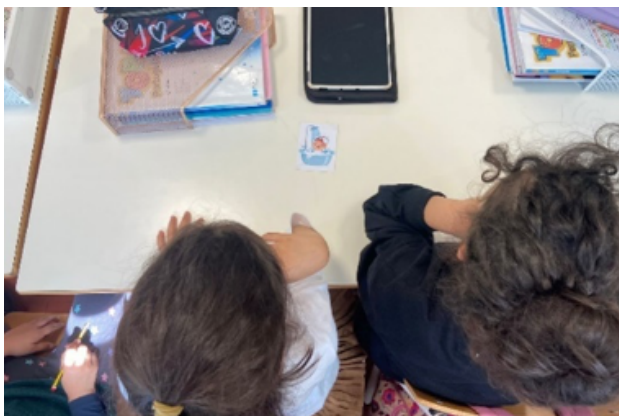
FIGURA 3. Realização da tarefa – debate sobre a poupança da água