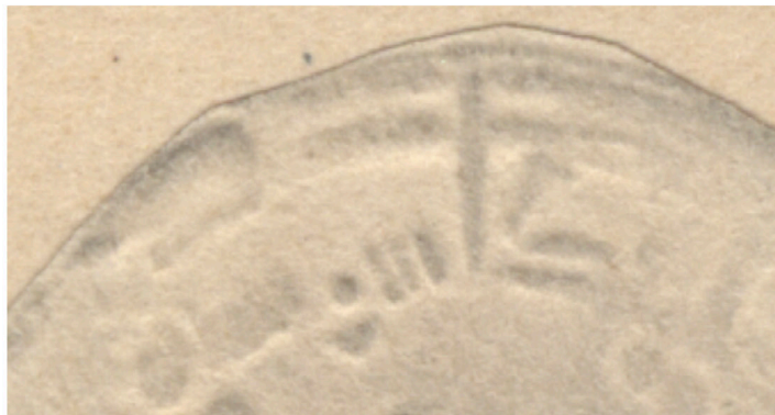
VII.3 Vives 676, detalle de la ceca Mint detail