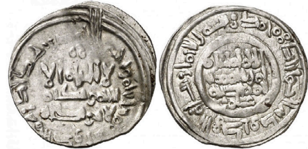
V.1.9 Áureo 18/09/2014, 285: 758