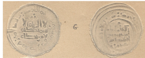
V.2.2 Repertorio Vives : Col. Gayangos Vives Repertoire: Gayangos Collection