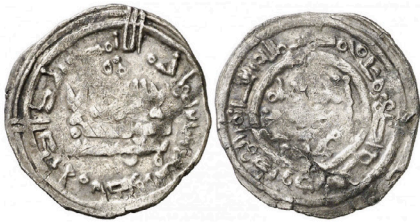
V.2.6 Áureo 14/12/2016, 285: 1254