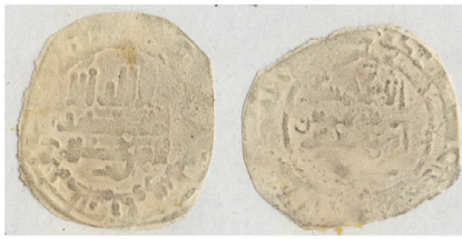
II.1 Col. Vives Vives Collection