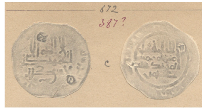
II.2 Repertorio Vives: Col. Codera Repertoire Vives: Codera Collection