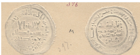
IV.1 Repertorio Vives: M.A.N. Vives Repertoire : M.A.N.