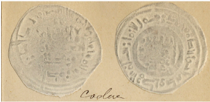
V.1.1 Col. Codera Codera Collection