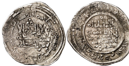
II.6 Áureo 23.05.2019, 232, 149