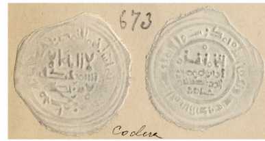
IV. 4 Col. Codera Codera Collection