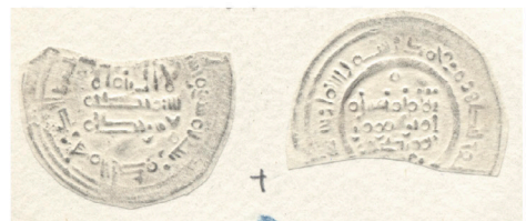
V.2.5 Colección Prieto Prieto Collection