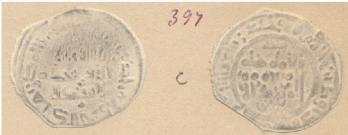
V.3.1 Repertorio Vives: Col. Codera Vives Repertoire: Codera Collection