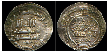
III.2 Tonegawa Collection