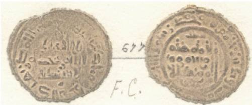
V.3.2 Láminas Vives: Col. Codera Vives Plates: Codera Collection