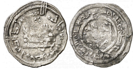
V.1.8 Áureo 03/12/2013, 1404: 256