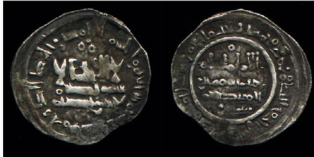
V.1.7 Tongegawa Collection