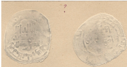
II.3 Repertorio Vives: Col. Vives s.f. Vives Repertoire : Vives Collection, no date