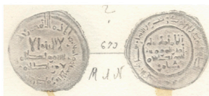
IV.2 Láminas Vives: M.A.N. Vives Plates: M.A.N.