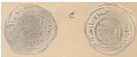
V.1.2 Repertorio Vives : Col. Codera Vives Repertoire: Codera Collection