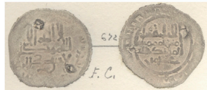
II.4 Vives Láminas : Col. Codera Vives Plates: Codera Collection