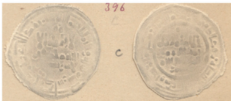
VII.1 Repertorio Vives : Col. Codera Vives Repertoire: Codera Collection