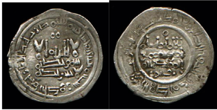
V.1.6 Tongegawa Collection