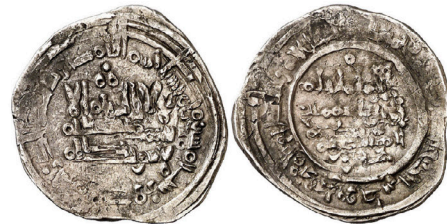
V.2.7 Áureo 23/05/2019, 232: 149