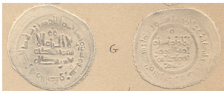
V.2.3 Repertorio Vives : Col. Gayangos Vives Repertoire: Gayangos Collection