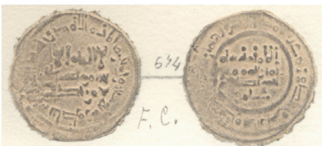
V.1.5 Láminas Vives : Col. Codera Vives Plates: Codera Collection