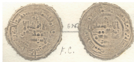
VII.2 Láminas Vives : Col. Codera Vives Plates: Codera Collection