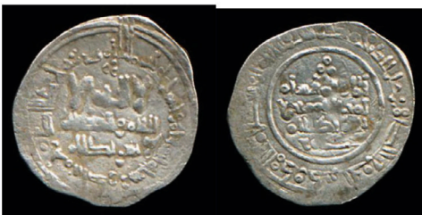
VI.1 Tonegawa Collection