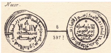
V.2.1 Codera 1879, Lám. X, 8 Codera 1879, Plate. X, 8