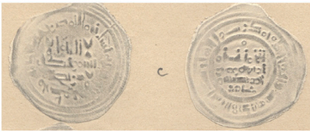
IV.3 Repertorio Vives : Col. Codera Vives Repertoire: Codera Collection