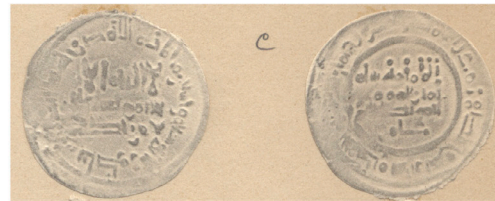
V.1.3 Repertorio Vives : Col. Codera Vives Repertoire: Codera Collection