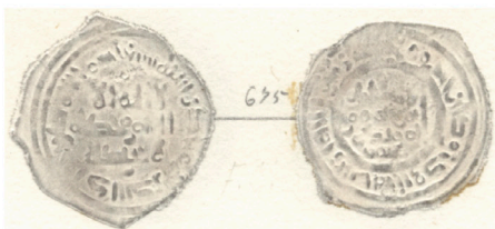
V.2.4 Láminas Vives : Col. Vives Vives Plates: Vives Collection