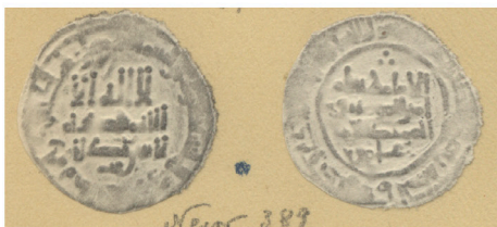
III.1 RAH, Vives 672 corr. A 389 RAH, Vives 672 correction a 389