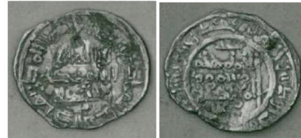
V.3.3 Miles 337c-d, ex Codera, ex HSA 15607 Miles 337c-d, ex Codera, ex HSA 15607