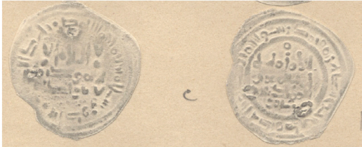
IV.5 Repertorio Vives : Col. Codera Vives Repertoire: Codera Collection