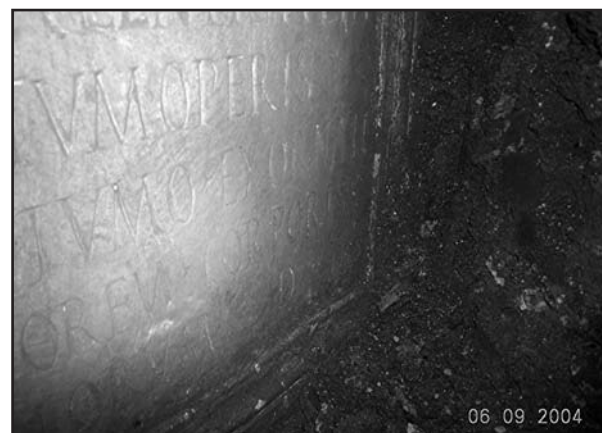
Fig. 6. Detalle de las líneas inferiores, en posición ya muy desfavorable. (Cortesía de la Delegación Provincial de Cultura de Sevilla, Junta de Andalucía; foto I. Rodríguez Temiño).

cubrirla; tiene de momento la clásica coloración oscura producto de un centenario enterramiento y ciertas condiciones de humedad. No tiene otras inscripciones o relieves en los laterales, que se presentan lisos y pulidos, mientras la cara posterior está apenas desbastada.