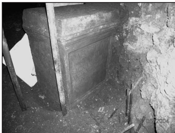
Fig. 3. El nuevo pedestal a Venus Genetrix Augusta, en el contexto de su aparición. Se aprecia su casi perfecto estado de conservación..

Los primeros editores, Tabales y Jiménez Sancho, seguidos por Stylow y Gimeno, supusie-