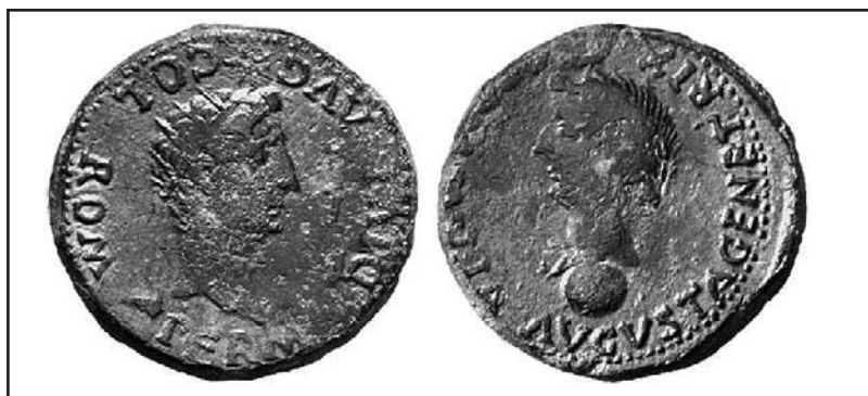
Fig. 7. Emisión de ases y dupondios de Hispalis en época de Tiberio (RPC, 73). En el anverso, Augusto a dcha. con cabeza radiada y el sidus sobre él, haz de rayos delante, la leyenda PERMISSU DIVI AVG(usti) COL(onia) ROM(ula). En el reverso, busto de Livia a izq, sobre globo terráqueo y bajo creciente lunar, con la leyenda IVLIA AVGVSTA GENETRIX ORBIS.

tos de Hispalis con los de otra colonia cesariana, igualmente fundada por César como consecuencia de aquellas decisiones del año 45 a.C.: Urso, la actual Osuna (SE) 27 . En el nombre oficial de la Colonia Iulia Genetiva Urbanorum Urso se repiten el nomen Iulium , las referencias a Roma (Romula = Urbanorum 28 ), y además el epíteto Genetiva, que alude sin duda a la propia Venus 29 . Pues bien, de ella procede la única de las leyes coloniales hispanas que por el momento conservamos, la lex Ursonensis (actual Osuna, SE) que, como es bien sabido, descansa sobre una lex Antonia de coloniis