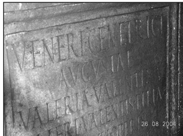
Fig. 5. Detalle de las líneas superiores de la inscripción.

El pedestal, de mármol blanco de mediana calidad, con coronamiento y basa (ésta aún no visible) separados del fuste por varias molduras, apareció de forma casual durante unas obras en el sótano de un edificio de la calle Argote de Molina esquina a Francos, en un contexto original, esto es, romano, pero en situación secundaria, quizá dentro de un hoyo o socavón del pavimento, una vez arruinado el edificio al que pertenecía. Se apreciaba junto a él una línea de suelo de ladrillos, dispuestos de forma inclinada sobre el pavimento mismo, que es de opus signinum . Éste se encuentra ahora en la cota de coronación del basamento. El pavimento no se aprecia sobre el pedestal, lo que hace suponer la existencia previa de ese hoyo, en cuyo interior se arrojó, se depositó o (más probablemente) cayó la basa. Su estado de conservación es casi perfecto ( fig. 3 ), presentando sólo unos pequeños golpes en el frente del coronamiento, seguramente de los trabajos que se realizaban al des-