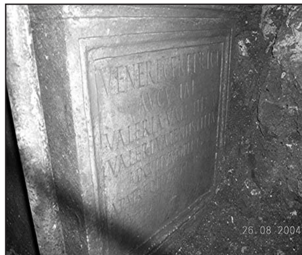
Fig. 4. Vista oblicua del campo epigráfico. (Cortesía de la Delegación Provincial de Cultura de Sevilla, Junta de Andalucía; foto I. Rodríguez Temiño).

La muy reciente aparición (agosto de 2004) en Sevilla de un pedestal gemelo del de Minerva Augusta , dedicado por otra hija de Valerius Valens , de cognomen Valentina , y esta vez a Venus Genetrix Augusta , se mostró muy oportuna, pues llegó en el momento en que nos hallábamos preparando las revisiones para el volumen 10 de Hispania Epigraphica (en la que me ocupo de la epigrafía de las provincias andaluzas). Su conocimiento