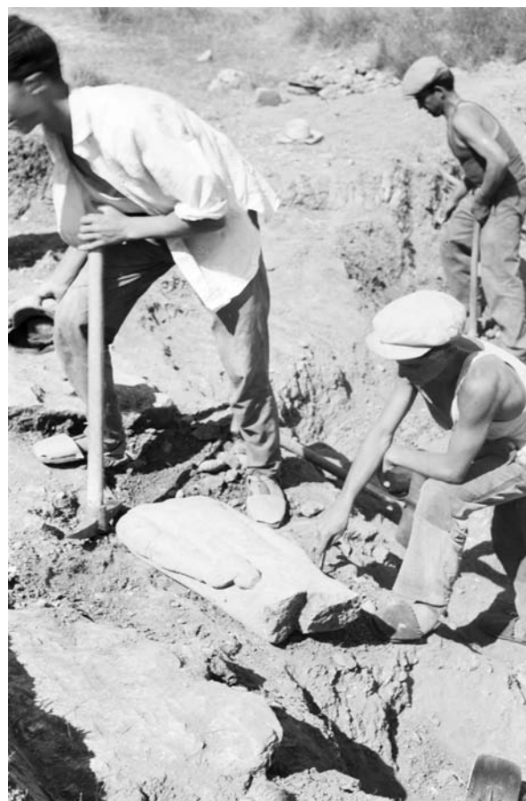
5. Momento de aparición de una escultura en la excavación del Cerro de los Santos. Campaña de 1962. ( Legado Fernández de Avilés , U.A.M.; n.º inv.0486).

El establecimiento de estas categorías partió, como es lógico, de una primera clasificación lle-