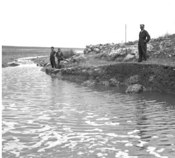
4. La Rambla del judío, junto al santuario ibérico del Cerro de los Santos (Montealegre del Castillo, Albacete), durante la excavación de 1963.

Su sólida formación científica, así como sus conocimientos idiomáticos por encima de la