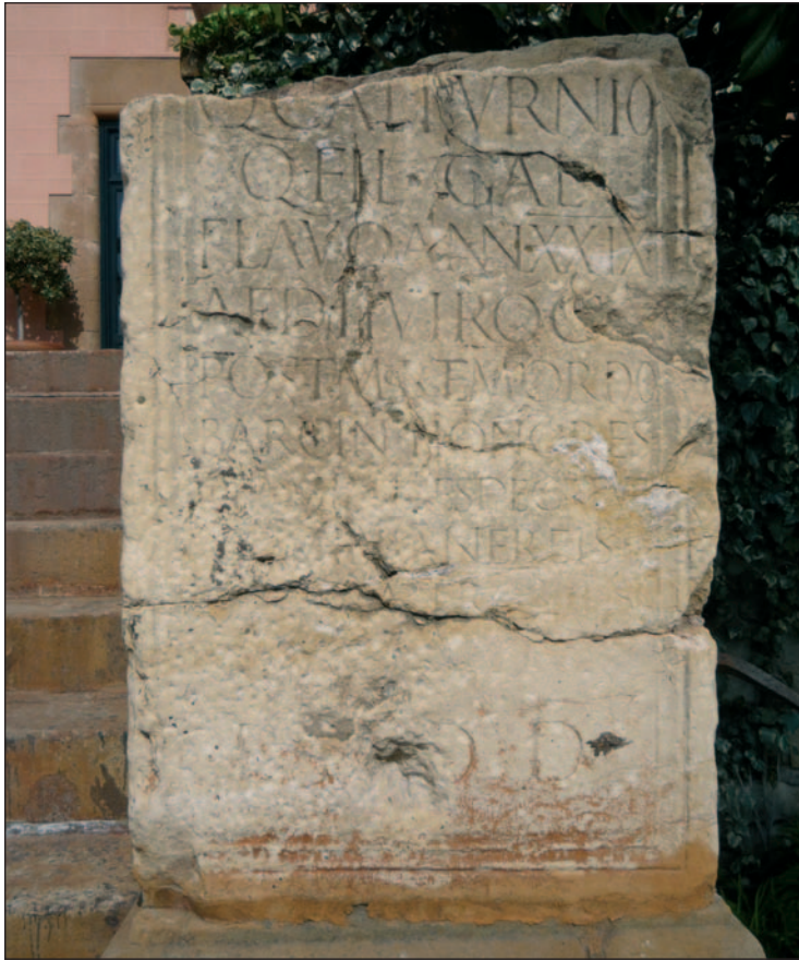
Figura 1.- IRC IV, 55 en su ubicación actual en el jardín de la Torre dels Lleons (Esplugues de Llobregat).