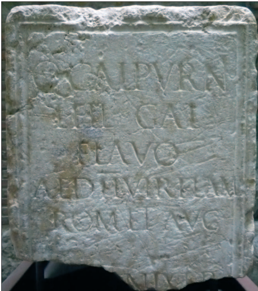
Figura 2.- Pedestal descubierto en la iglesia de Santa Maria del Pi, ahora en el recinto del templo romano.