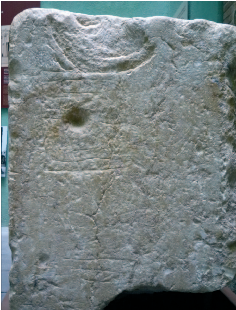
Figura 4.- Tablero de juego inciso en el lateral izquierdo del pedestal hallado en la iglesia de Santa Maria del Pi.