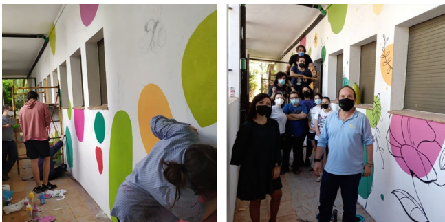
Figura 3. Parte superior boceto final de la fachada izquierda (mayo 2021). Alumnado realizando el proyecto e inauguración oficial.

Con un bagaje y una experiencia adquirida durante años, desde el RJBC podemos afirmar que la puesta en marcha de una línea de trabajo transversal como esta, que en principio no es uno de los objetivos tradicionales de los Jardines Botánicos, ha proporcionado una interacción muy interesante entre la comunidad educativa en general, la sociedad cordobesa a la cual se le facilita el acceso al complejo mundo vegetal y a una institución pública como el RJBC que debe prestar atención a un público muy diverso.