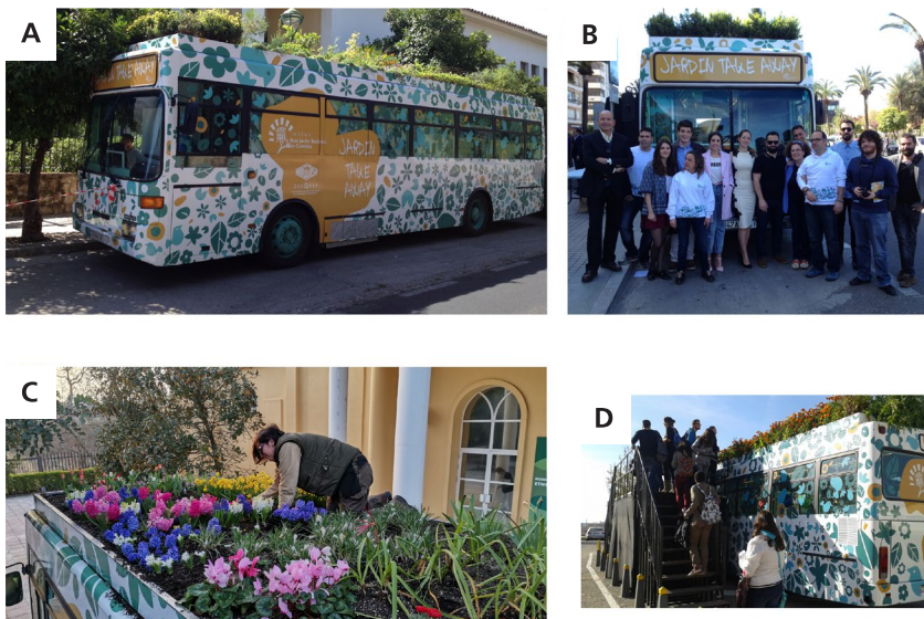
Figura 1. A) Exterior del Bus. B) Inauguración con equipo creativo y educativo del RJBC. C) Cultivo de bulbos en el techo del autobús adaptado para ello. D) Grupo visitando el jardín del bus.

de Córdoba) que aportó el bus, la Escuela de Arte “Mateo Inurria” que contribuyó con el diseño y el proyecto artístico, la Fundación Descubre que aportó la mayor parte de los fondos y el RJBC, autor del proyecto y que en todo momento supervisó el contenido educativo del mismo. El equipo artístico estaba compuesto por dos especialidades: arquitectura efímera encargados de realizar el diseño del espacio expositivo interior, y diseño gráfico que realizó el diseño exterior del autobús.