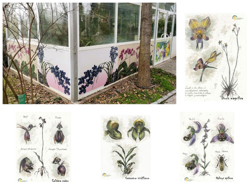
Figura 2. Fachada exterior del orquidario. Conjunto de tarjetas postales con las ilustraciones de orquídeas y polinizadores realizadas por Beatriz Rodríguez (alumna en prácticas).

En estas dos fachadas de más de 23 metros de largo y casi 4 metros de altura cada una, se puede observar una representación muy artística y esquematizada de lo que se podrá ver en el interior de las instalaciones (Figs. 3 y 4), teniendo en cuenta tanto elementos vegetales como animales, en un