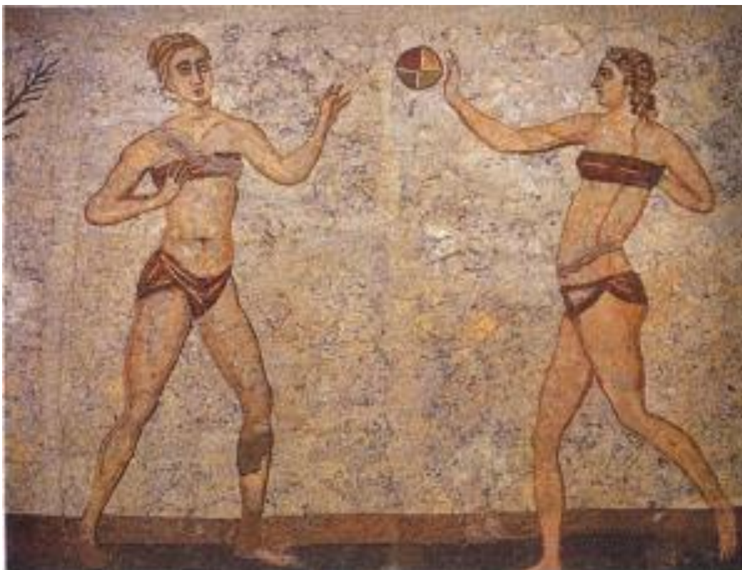
Ilustración 1. Juego del Harpastum. Mosaico en la Piazza Armerina. (Fuente: Harpastum, entre el fútbol y el rugby).

En el año 1892 el profesor de gimnasia Konrad Koch inventó el juego del Raffballspied , de características similares al balonmano actual, como método de entrenamiento para los gimnastas.