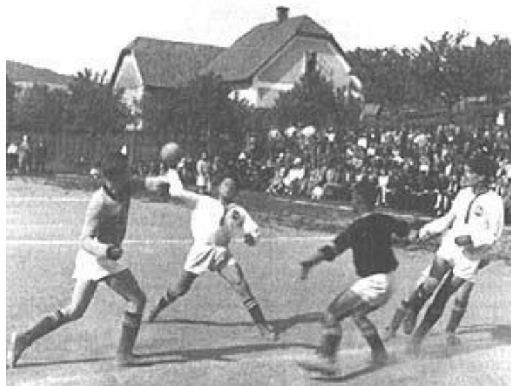
Ilustración 3. Balonmano en sus orígenes.