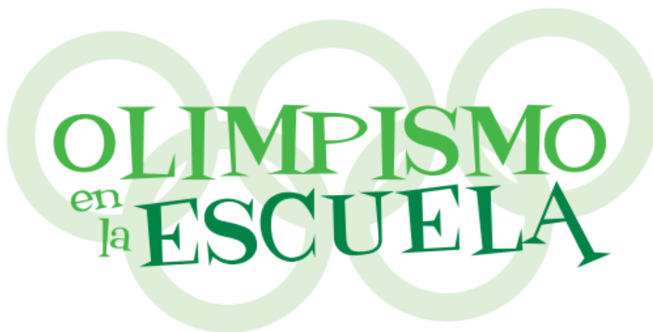
Ilustración 1. Logo del proyecto

Nuestro objeto de estudio es un programa educativo para educación primaria que gira en torno a la cultura olímpica y que fue ideado por la Fundación Andalucía Olímpica . Este proyecto, denominado “Olimpismo en la Escuela”, ha permitido educar en valores a cerca de 5.500 escolares pertenecientes a más de 50 centros de Educación Primaria de Andalucía durante el curso 2011-2012. Los profesores de Educación Física de estos centros adaptaron a su realidad educativa una unidad didáctica previamente diseñada sobre olimpismo.