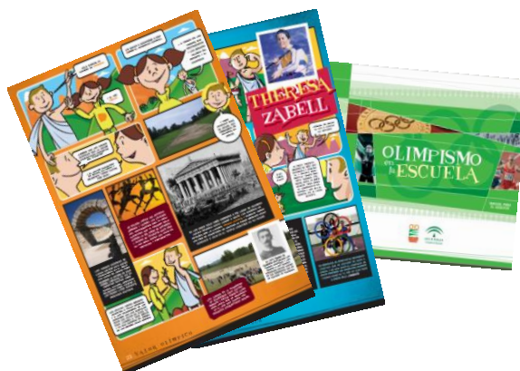
Ilustración 2. Recursos materiales. Cómics y guía del profesor

El programa “Olimpismo en la Escuela” facilita a los centros y profesores una unidad didáctica dirigida a los alumnos de educación primaria para ser desarrollada en la asignatura de Educación Física en su horario lectivo, aunque también puede realizarse en una semana cultural del centro. Esta planificación, formada por cinco sesiones, propone objetivos, contenidos y estrategias de aprendizaje y va acompañada de diferentes materiales curriculares: cómics, historias gráficas de deportistas olímpicos ejemplares, recursos de representación olímpica y manuales para el profesor.