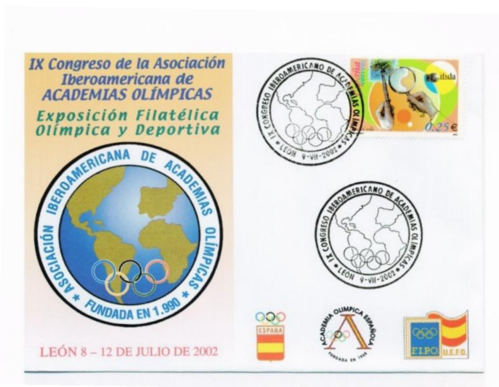
Matasellos alusivo al IX Congreso de la AIAO (Durántez, 2012)

Durántez Corral, C. (2012). El Comité Olímpico Español: Un siglo de historia. Citius, Altius Fortius. Humanismo, Sociedad y Deporte: Investigaciones y ensayos 5(2)- 2012, pp. 9-48. Centro de Estudios Olímpicos de la Universidad Autónoma de Madrid.