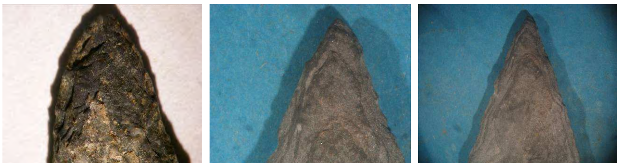
Fig. 24. Detalle de una punta arqueológica; Fig. 25-26. Detalle de las puntas experimentales

Si observamos la comparación de los detalles de las puntas (Fig. 24, en el caso arqueológico, y 25 y 26 en los casos experimentales), podemos ver una similitud en el retoque, que en ambos casos queda escaleriforme. Aunque, como ya se ha dicho antes, hay que salvar las diferencias en cuanto a las características de la materia prima.