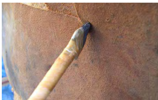
Fig. 10. Flecha nº 5 sobre el cuero superior