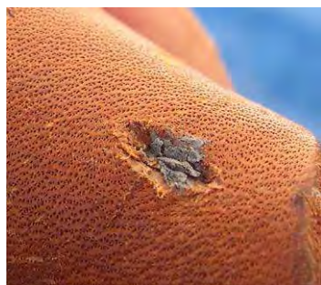
Fig. 14. Extremo distal en el cuero