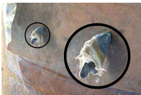
Fig. 8. Disparo flecha nº 4 sobre cuero