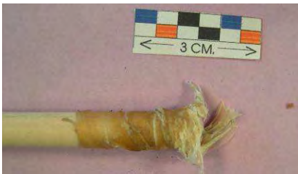
Fig. 5. Resultado disparo flecha nº 9

Para el disparo se ha utilizado un arco de iniciación recurvo de 35 libras, con una fuerza de entre 30 y 35 libras y se ha disparado sobre un saco lleno de serrín con varias capas de cuero de 0.25, 0.2 y 0.4 centímetros de grosor. La distancia desde la que se han lanzado las flechas ha sido de unos 6 metros.