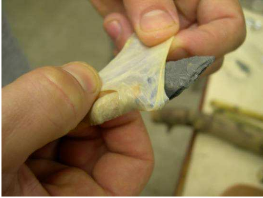
Fig. 3. Detalle del proceso de enmangado