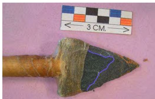
Fig. 11. Línea azul: fractura por exfoliación