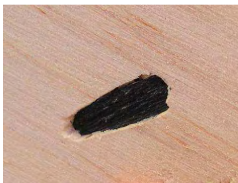
Fig. 16. Punta incrustada en la madera