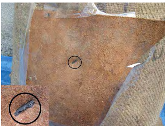
Fig. 6. Extremo distal de la flecha nº 2