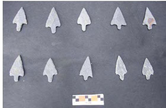
Fig. 2. Puntas de pizarra terminadas

Las 10 puntas que se han realizado (Fig. 2) han tenido todas una morfología de pedúnculo y aletas con unas mínimas y máximas de 3.6 y 4.5 cm de longitud, 1.9 y 2.6 cm de ancho y 0.3 y 0.5 cm de grosor.