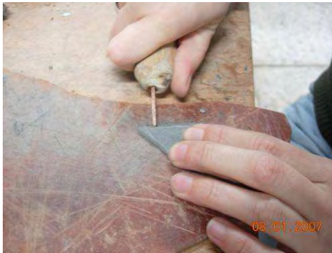
Fig. 1. Detalle del recorte de una punta