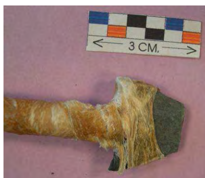
Fig. 17. Resultado disparo flecha nº 7