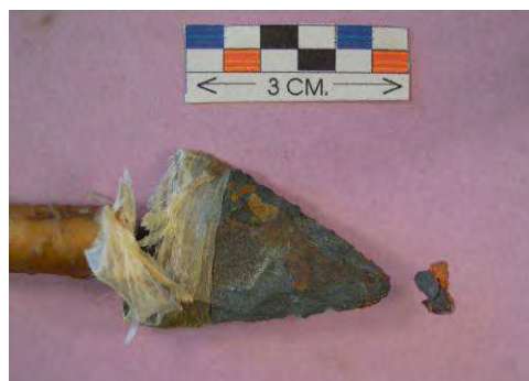
Fig. 13 Segundo disparo flecha nº 3