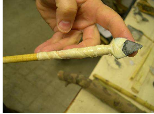
Fig. 4. Resultado del enmangado con tripas