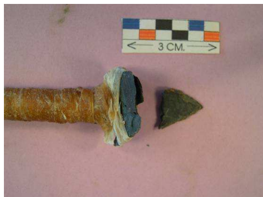
Fig. 7. Flecha nº 2 rota tras el disparo