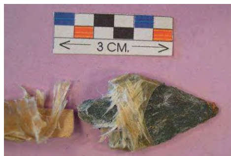
Fig. 9. Resultado disparo flecha nº 4