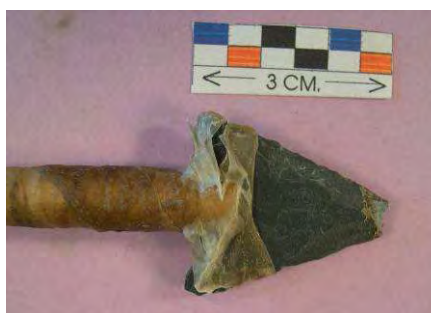
Fig. 15. Resultado disparo flecha nº 1