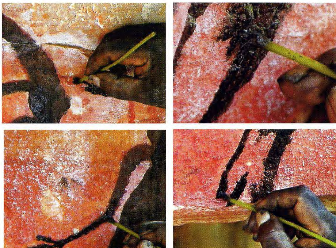
Fig. 1. Artista australiano usando un pincel vegetal (según Gerber y Radetzky 2000)

Pinceles y plumas. La observación en algunas figuras, como un antropomorfo del abrigo de La Vacada (Castellote, Teruel), del trazo con el que se realizó la representación nos hace pensar en el empleo de pinceles de pelo o de fibras vegetales. El uso de estos últimos se conoce perfectamente por etnología comparada entre los aborígenes australianos y los Hadza tanzanos, consistiendo en un tallo verde o rama leñosa no excesivamente seca y de la que uno de sus extremos se machaca, incluso con la propia boca, con el fin de obtener un frente más o menos plano compuesto por pequeños hilos o fibras que actúan a modo de las cerdas de un pincel (Fig. 1).