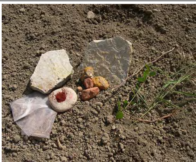
Fig. 2. Materiales empleados en la experimentación: lajas de roca caliza, pigmentos y elementos vegetales.