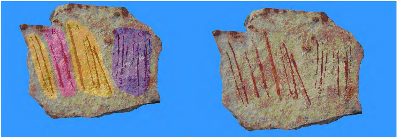
Fig. 3. A: muestra de trazos realizados con diversos tipos de pinceles vegetales. De izquierda a derecha: Ligustrum ovalifolium ; Ligustrum ovalifolium ; Arundo donax sin tratar; Punica granatum ; Punica granatum ; herbácea. El primer trazo por la izquierda tiene apenas 1 mm de grosor.

Realizamos diversos trazos lineales (Fig. 3) y tres elementos de carácter figurativo (Fig. 4), dos arqueros y un cuadrúpedo, empleando en su confección pintura obtenida a partir de diferentes ocre y vehículos, usando exclusivamente pinceles realizados con ramas de Ligustrum ovalifolium para el trazado de las representaciones reconocibles.