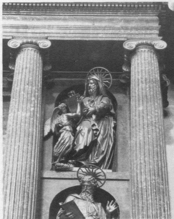
Fig. 4.- Monasterio del Escorial. Basílica. Retablo mayor. San Mateo.

el Mozo y por Julio Miseroni, y advirtiéndole que, o se facultan los recursos pecuniarios necesarios para las obras de las armas, o nada se podrá hacer 18 .