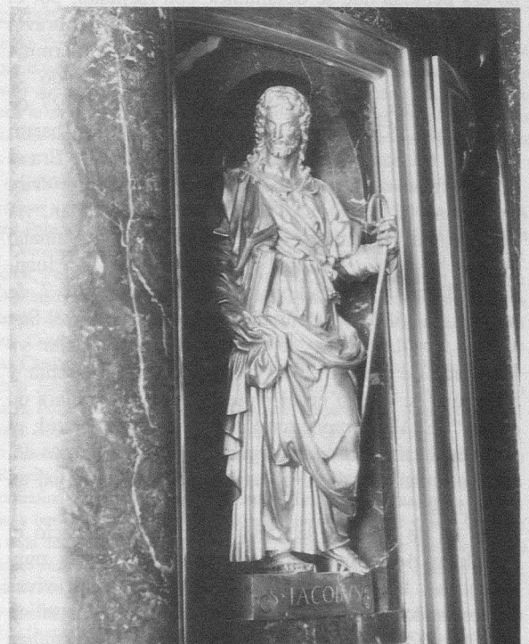
Fig. 15.- Monasterio del Escorial. Basílica. Retablo mayor. Custodia. Santiago.