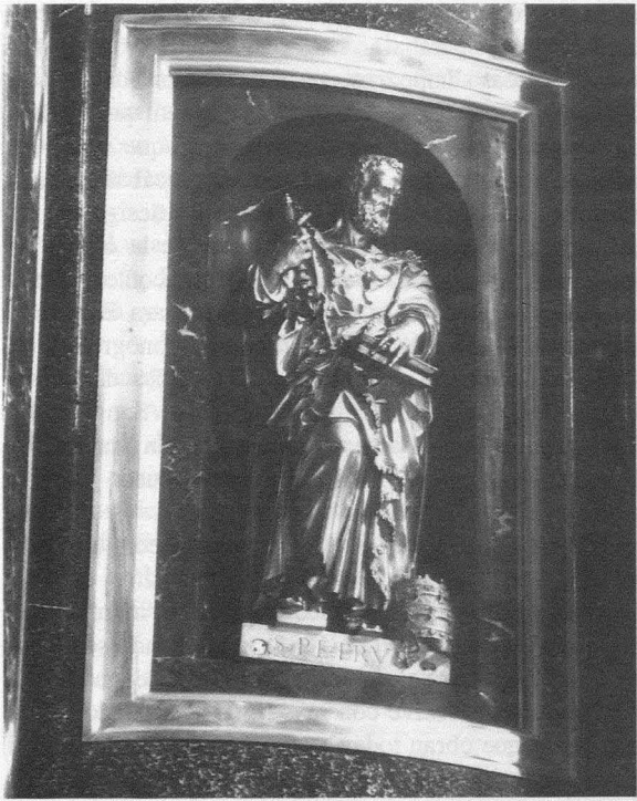
Fig. 12.- Monasterio del Escorial. Basílica. Retablo mayor. Custodia. San Pedro.