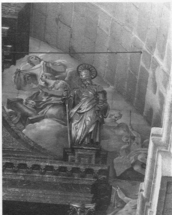
Fig. 6.- Monasterio del Escorial. Basílica. Retablo mayor. San Pablo.