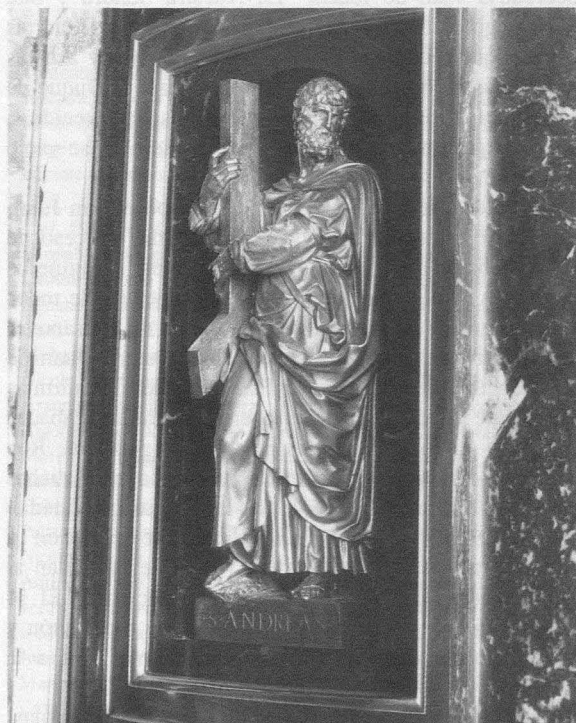
Fig. 14.- Monasterio del Escorial. Basílica. Retablo mayor. Custodia. San Andrés.