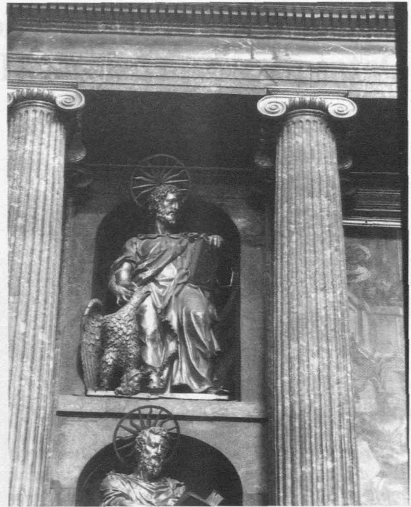
Fig. 2.- Monasterio del Escorial. Basílica. Retablo mayor. San Juan.

simple al estilo español. Todo quedó pendiente a la espera de la llegada del rey, para que él tomase una decisión, como lo escribe en carta de 30 de noviembre de 1585 11 . El tema concluyó con la erección de un altar en isla, la desaparición de los colaterales y la modificación de las gradas, como se recoge en el Primer Diseño. Disponer el altar exento ya lo experimentó Juan de Herrera, cuando proyectó la Catedral de Valladolid, apareciendo dibujado de esa manera en la planta general del edificio 12 .