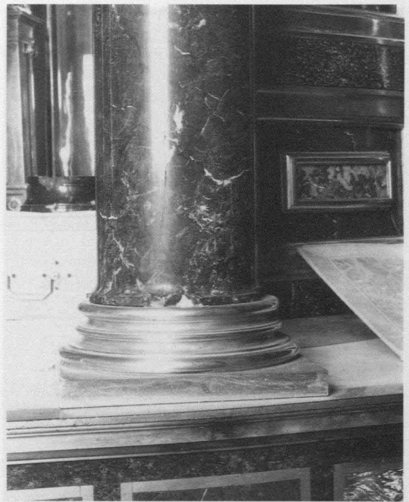
Fig. 9.- Monasterio del Escorial. Basilica. Retablo mayor. Custodia. Detalle de la base de una columna.