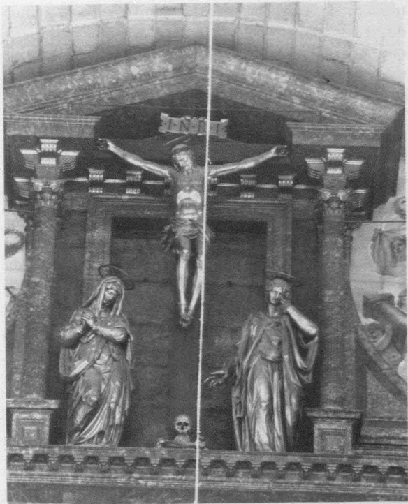
Fig. 7.- Monasterio del Escorial. Basílica. Retablo mayor. Calvario.

convencido por su hijo para que se reincorporase a la empresa, marchó hasta Venecia buscando escultores y cinceladores, "y se volvió sin uno" 32 . En estas condiciones no ha podido cumplir las promesas hechas de "que pasado la primavera se enviaría todo esto, que aunque en algo he mentido, no es mucho, porque cierto en este arte es más el ánimo del artista que lo que ella se dexa dominar, pero baste que por mi no entiendo que se haya faltado de proseguir ni se faltara, y esto lo tengo por muy averiguado y cierto como vuestra merced vera" 33 .