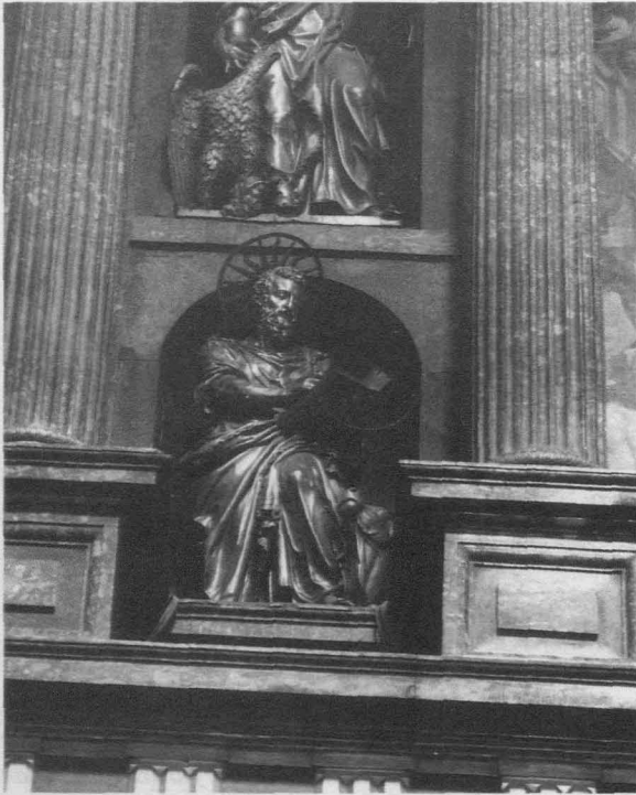
Fig. 1.- Monasterio del Escorial. Basílica. Retablo mayor. San Lucas.