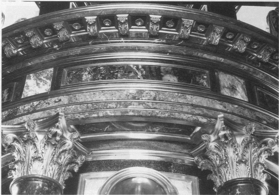
Fig. 10.- Monasterio del Escorial. Basilica. Retablo mayor. Custodia. Detalle de los capiteles y el entablamento.