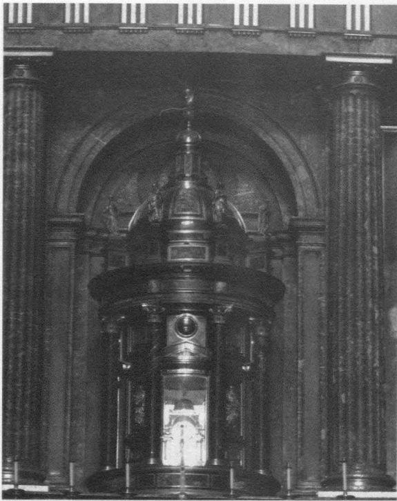
Fig. 8.- Monasterio del Escorial. Basilica. Retablo mayor. Custodia.