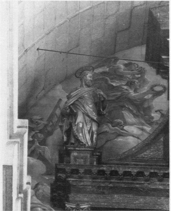
Fig. 5.- Monasterio del Escorial. Basílica. Retablo mayor. San Pedro.

Ninguno de los cálculos estaban descaminados. El edificio estaba en uso en 1586, los chapados de jaspe de la capilla mayor y oratorios estaban concluidos, a igual que las arquitecturas del retablo mayor y de los cenotafios, pero faltaba la pintura y la escultura, campos de los que no era responsable directo Juan de Herrera. Aun así, en abril de 1585 Luca Cambiaso había pintado la bóveda de la capilla mayor con la Coronación de la Virgen.