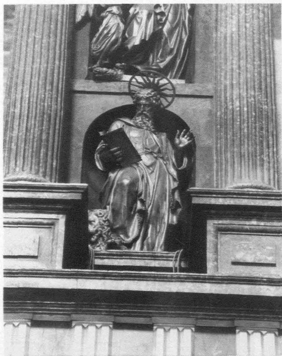
Fig. 3.- Monasterio del Escorial. Basílica. Retablo mayor. San Marcos.