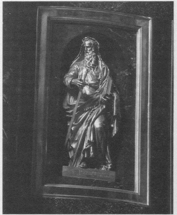
Fig. 13.- Monasterio del Escorial. Basílica. Retablo mayor. Custodia. San Pablo.