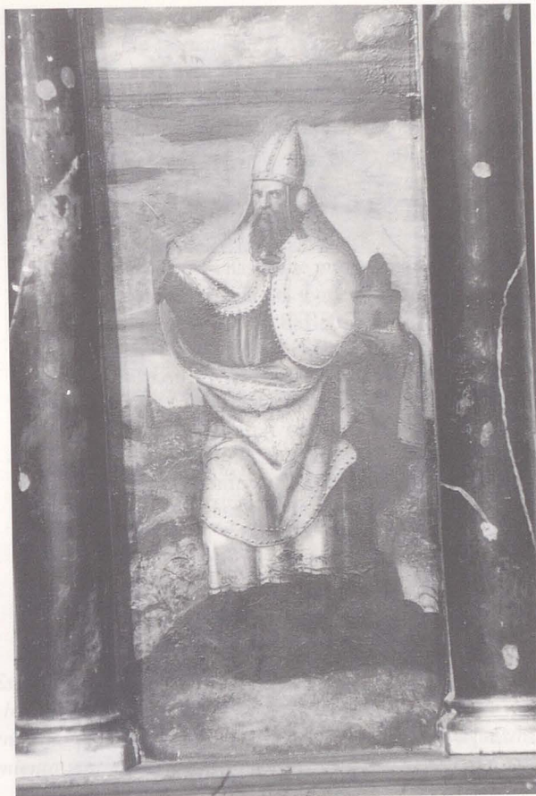
Fig. 6. San Agustín. Retablo de la Capilla Núñez de Toledo o de la Encarnación. Iglesia de Santo Tomé, Toledo.,