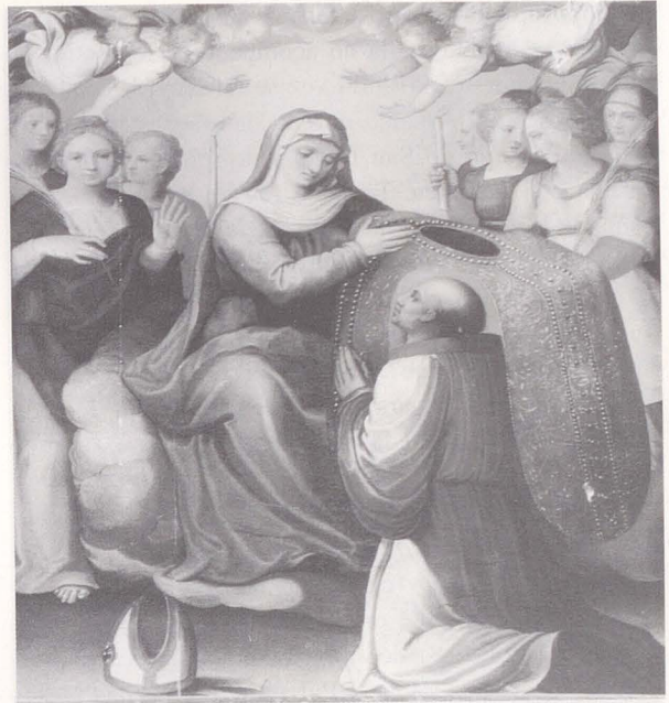
Fig. 4. Imposición de la Casulla a San Ildefonso. Parroquia de Numancia de la Sagra (Toledo).

Junto a estos dibujos de tema diverso, son inventariados proyectos de retablos, caso de onze trazas de retablos en cada papel una traza (247-257). Algunos de estos diseños serían los empleados en las obras retablisticas en las que se implicó Hernando: Santo Domingo el Antiguo, de Toledo; Colmenar; o el proyecto del retablo mayor de la Catedral de Burgos. Otros, como las dos trazas de el retablo de El Escorial (245-246), evidentemente no son de su mano 40 . La arquitectura, como lo había sido la escultura, es campo en el que es complicado determinar el grado de implicación de Ávila. La presencia de estas trazas, sin precisión alguna, no aclara este punto.