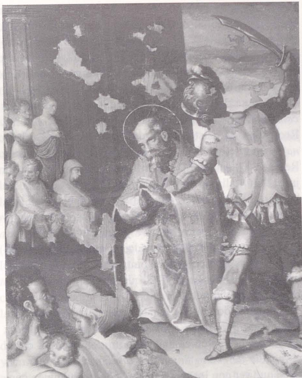
Fig. 2. Martirio de San Eugenio. Parroquia de Numancia de la Sagra (Toledo).