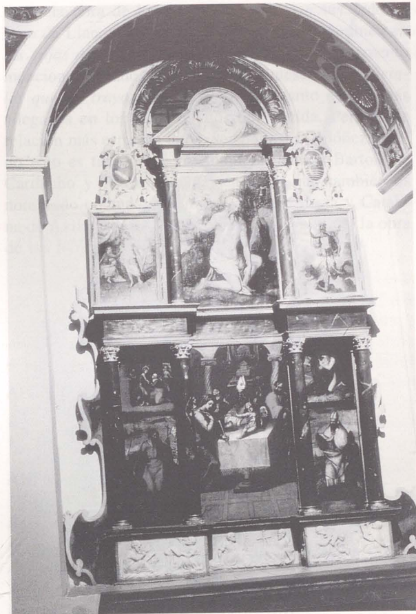
Fig. 5. Retablo de la Capilla Núñez de Toledo o de la Encarnación. Iglesia de Santo Tomé, Toledo.

de Diego de Soto, y cinco modelos para las cinco figuras de los dichos reyes 49 .