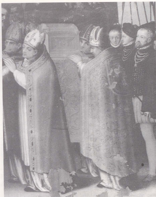
Fig. 3. Entrada del cuerpo de San Eugenio en Toledo. Parroquia de Numancia de la Sagra (Toledo).

Sevilla, y otro de cortes de platero (9) que no hemos conseguido localizar. Finalizamos este repaso con los títulos de Julio Onosandro De re militari (32) y el de viajes, también clasificable como de entretenimiento o de historia, de González Clavijo Historia del Gran Tamorlán (53), acompañada por el discurso introductorio de Argote de Molina.