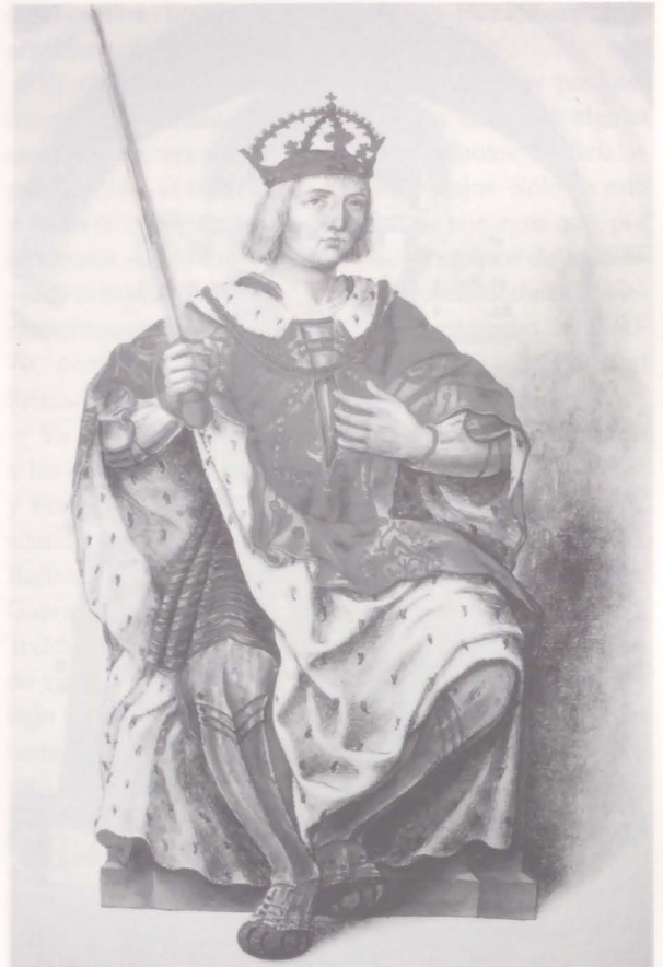
Fig. 8. Fernando el Católico. Libro de "Retratos, letreros e insignias reales". Museo del Prado, Madrid.

cargo de él Alonso de Ávila en compañía de Pedro de Torres, al dejarla inconclusa su padre 57 .