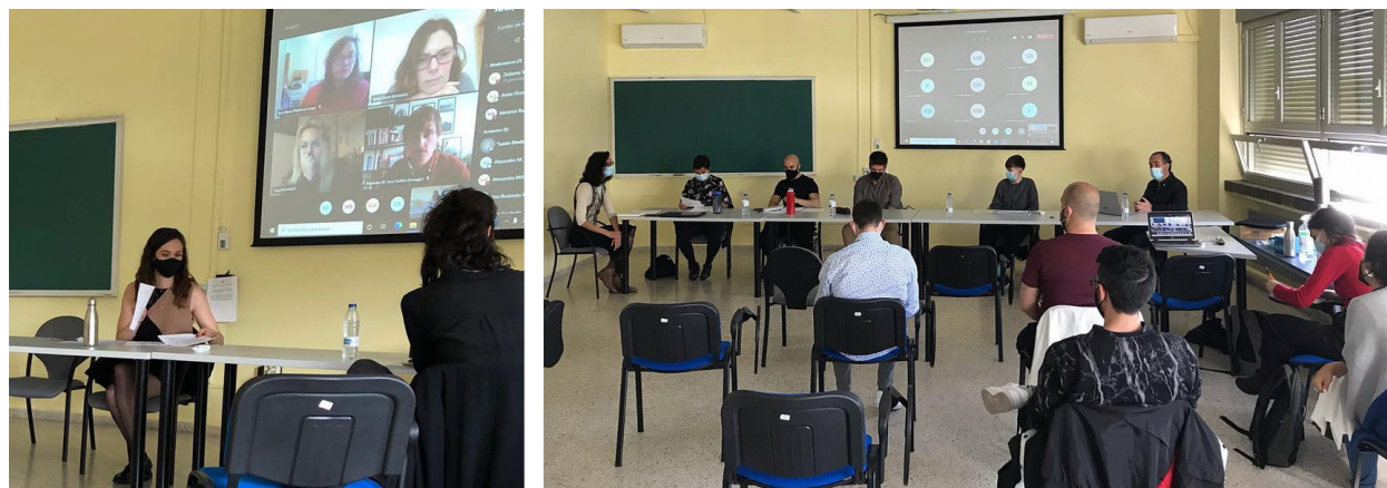
Fig. 3. Mesas de trabajo 3 y 4 de la sesión celebrada los días 22 y 23 de abril de 2021.

Desirée Vidal, “POST#Festival. Manierismo curatorial en tiempos trans”.