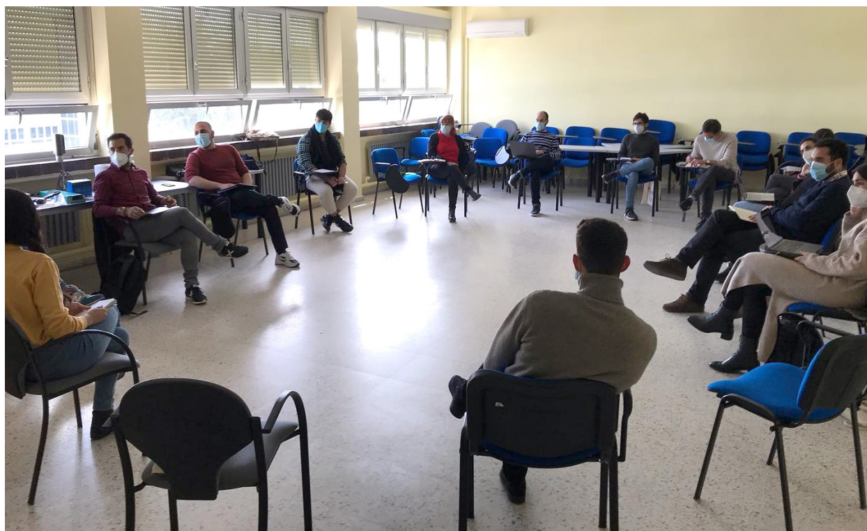
Fig. 5. Sesión predoctoral: A propósito del Simposio “Más que imágenes” (12 de abril de 2021).