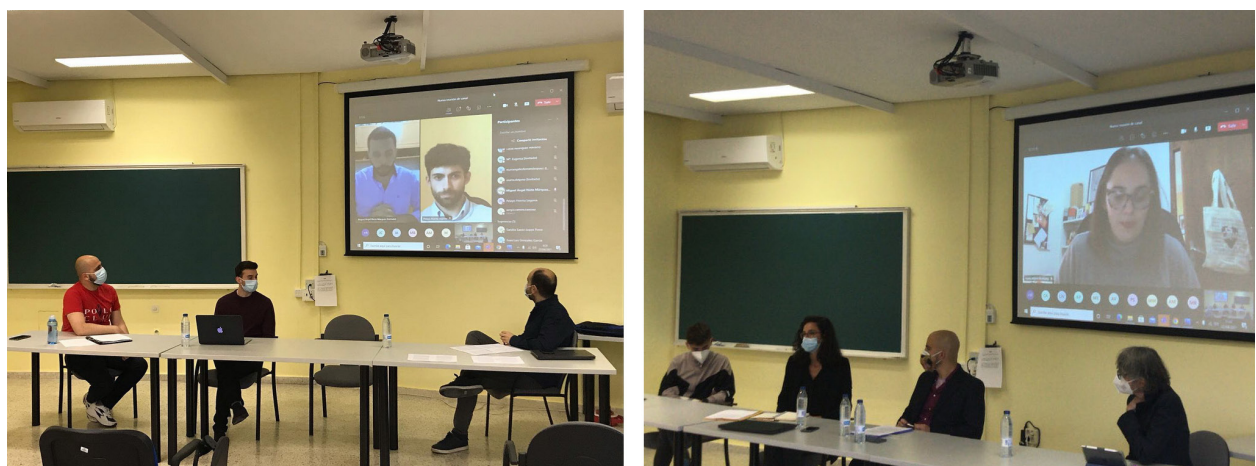
Fig. 2. Mesas de trabajo 1 y 2 de la sesión celebrada los días 22 y 23 de abril de 2021.

Diego Zorita, “La transformación utópica del medio poético en la poesía experimental española (1964-1975)”