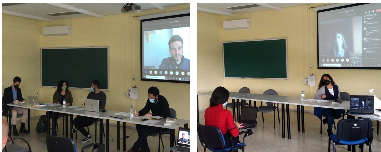
Fig. 4. Mesas de trabajo 5 y 6 de la sesión celebrada los días 22 y 23 de abril de 2021.

Rita Franco, “Francesca Caccini. Audacia e inspiración en una ‘Opera Prima’: La liberazione di Ruggiero dall’isola d’Alcina ”.