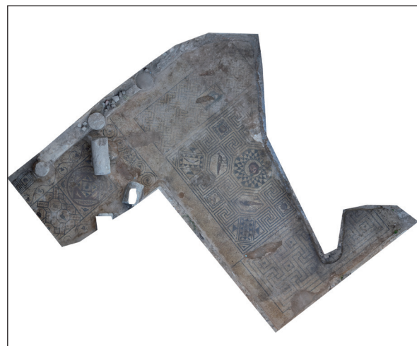
Figura 5. Imagen fotogramétrica del mosaico "de la medusa".

En el extremo norte de la habitación se documenta, adosado al anterior, un nuevo mosaico con un emblema central que representa un cuadrado con aves en los extremos enmarcando un círculo y cuadrados en el centro