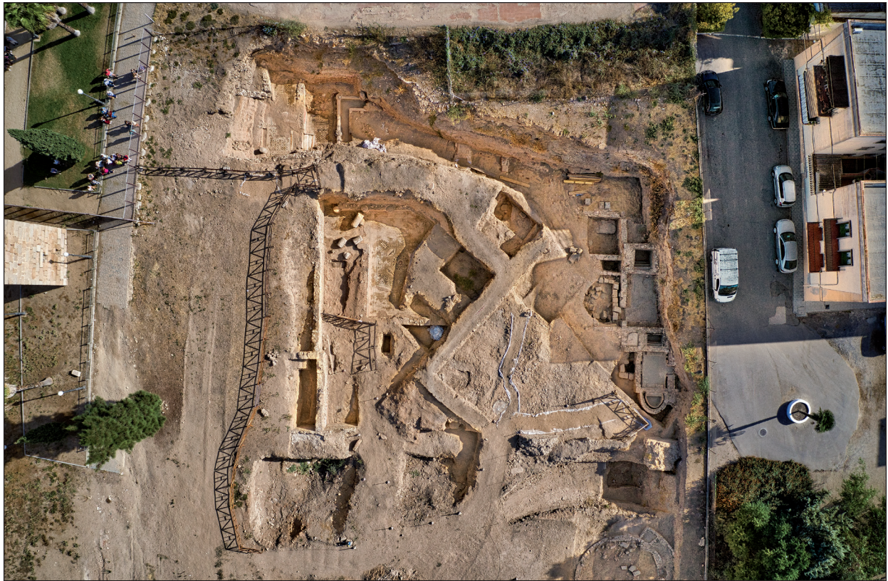
Figura 3. Vista General de las excavaciones.

en el informe de las excavaciones de 1976 y definir las características y dimensiones de dicho refuerzo. En el interior de la vecina alcazaba ya hemos señalado la presencia de un gran tramo de muralla en el que se puede apreciar dicho refuerzo formado por sillares reutilizados procedentes de edificios públicos romanos y de construcciones funerarias ya amortizadas cuando se realizó el refuerzo que tradicionalmente se fecha a lo largo del s. V (Mateos y Pizzo, 2020 (e.p.)). Junto a estos sillares, también se han reutilizado fragmentos de cornisas y otros restos de decoración arquitectónica, así como restos de pulvini procedentes de edificios funerarios (Beltrán y Baena, 1996: 105-131).