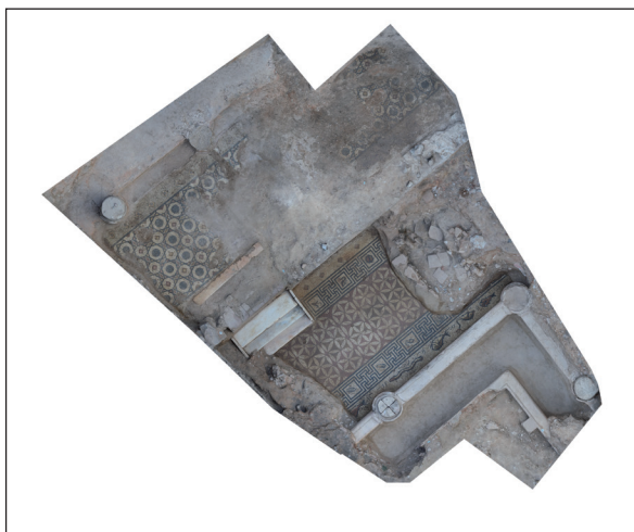
Figura 4. Imagen fotogramétrica de la zona de "los peristilos".

El segundo ámbito documentado en la vivienda coincidente con una estancia de 6 por 10 m, que se corresponde con el límite occidental de la domus y que se encuentra pavimentada con un mosaico policromo con un emblema central que representa una cabeza de Medusa. La habitación no está excavada en su totalidad ya que falta por conocer parte de la mitad sur.