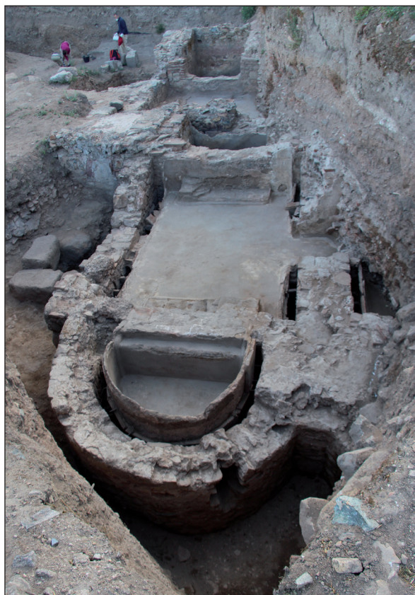
Figura 6. Vista general de la zona de las termas.

En el lado meridional del solar excavado se documentan los restos de un espacio termal del que se conserva tan solo su mitad norte. La zona visible de las termas posee una longitud de 17 m aproximadamente y está dividida en dos estancias (Fig. 6). El espacio oriental mide 6 m. Se trata de una estancia rectangular pavimentada con opus signinum que conserva en su extremo este una piscina cuadrangular a la que se accedía por 4 escalones. En el lado occidental se conservan los restos del caldarium de las termas a juzgar por el hypocaustum que se documenta en la zona inferior al que se accedería por un arco realizado con piezas de granito. Sobre él, se sitúa la habitación superior, pavimentada en opus signinum , que da paso a dos piscinas en el extremo oriental y a un alveus semicircular en el lado occidental con tres escalones de acceso. Destaca la presencia de una concameratio bien conservada que se documenta en todo el espacio central del caldarium y en el alveus de la zona oeste. El lado occidental del edificio termal se encontraba situado junto al lienzo de muralla, sobre la superficie que ocuparía anteriormente la vía que corría paralelo al muro de la ciudad.