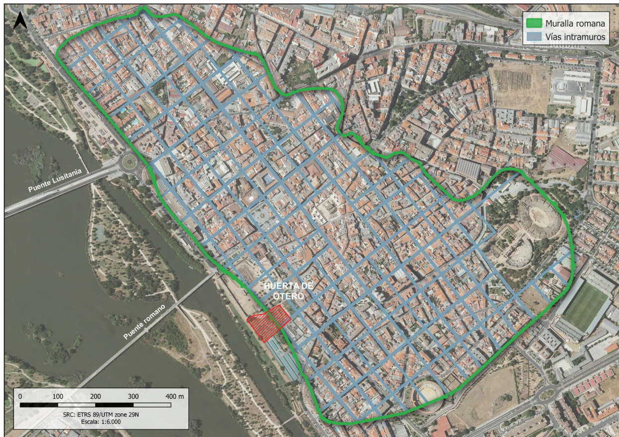
Figura 1. Planta de la ciudad romana de Augusta Emerita con la situación de los restos de la “Huerta de Otero”. (Departamento de Documentación del Consorcio de Mérida).

momento no se volvieron a realizar nuevas intervenciones hasta que a principios de 2019, el Instituto de Arqueología de Mérida y el Consorcio de la Ciudad Monumental de Mérida, con la colaboración de la Escuela Profesional de Arqueología “Diana” promovida por el Ayuntamiento emeritense, iniciaron un proyecto de investigación sobre esa zona arqueológica que actualmente se mantiene en curso.