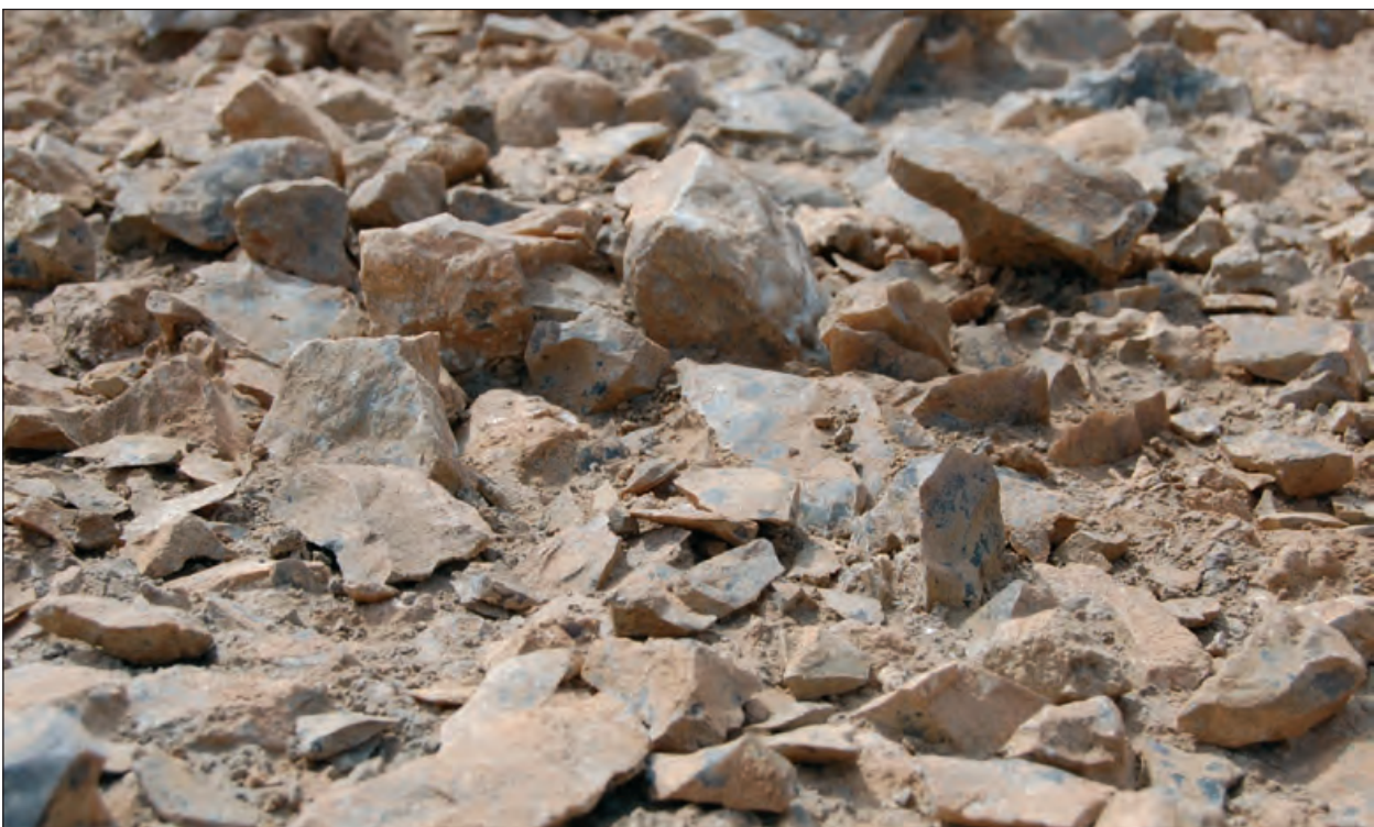
Figura. 4.- Distribución del material lítico musteriense de Parcela 32 (El Cañaveral, Madrid) donde se han detectado diferentes niveles de destreza en talla lítica.

Un aspecto interesante para determinar procesos de aprendizaje es el reaprovechamiento que se registra en el material lítico. En este sentido, está reconocida la práctica de talla de aprendices en núcleos abandonados por talladores expertos en yacimientos musterienses del centro peninsular como Parcela 32 (El Cañaveral, Madrid), donde existe constancia de la existencia de