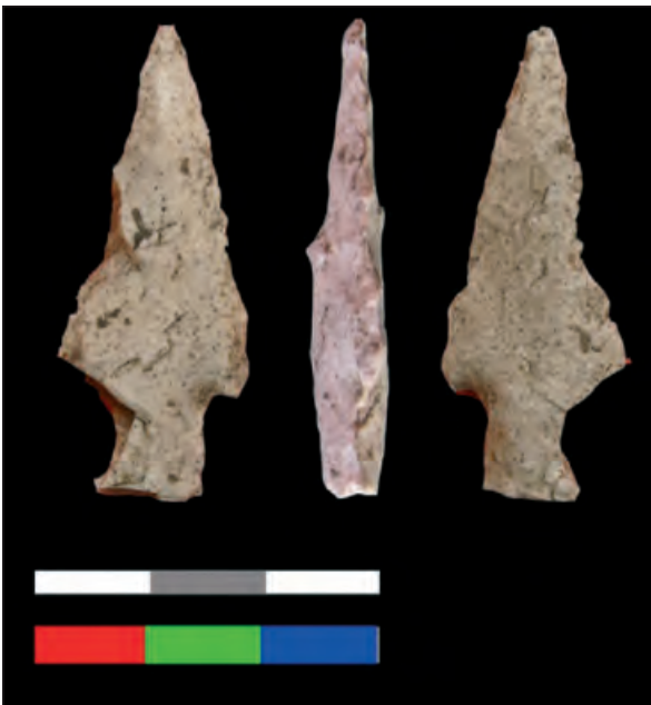
Figura 3.- Punta de pedúnculo y aletas solutrense con indicadores de baja destreza técnica (Cueva del Higueral- Guardia, Málaga).

la configuración (secciones o plantas o siluetas) o en la infra-explotación/configuración o sobreexplotación/configuración de los productos. En todos los casos, es posible apreciar una desviación del producto final respecto al modelo mental en que se basa (McPherron, 2000; Marks et al. 2001).