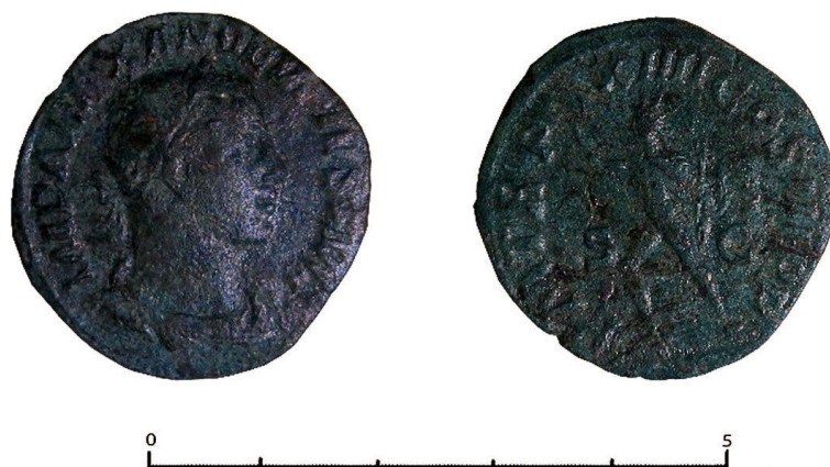
Figura 3. Fotografía del sestertius de Alejandro (222-235 d. C.), después de su restauración