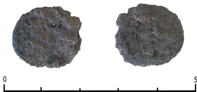
Figura 1. Documentación gráfica de una de las monedas antes de la intervención

Figure 1. Graphic documentation of one of the coins before the intervention