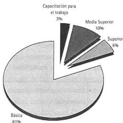
Gráfica 2 Matrícula del sistema educativo nacional 1998-1999

El gobierno federal, por conducto de la Secretaría de Educación Pública (SEP) ejerce la autoridad normativa, técnica y pedagógica para el funcionamiento de la educación básica.