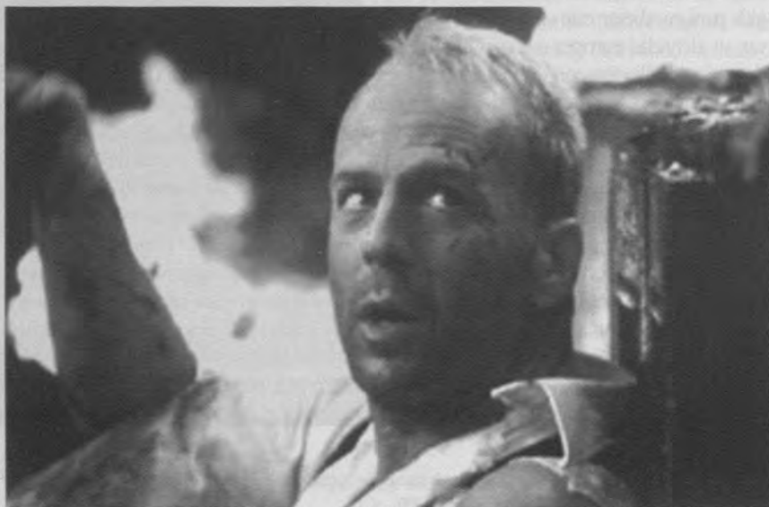
Bruce Willis en El quinto elemento (Luc Besson, 1997)

cia ficción, que es el género acotado en este estudio, un componente indispensable —obligatorio al menos desde el impacto que produjo la primera entrega de La guerra de las galaxias ( Star Wars , Geogr Lucas, 1977)— es la abundancia de lo que comúnmente se conoce como “efectos especiales”. Hasta tal punto son primordiales estos efectos que se ha atacado a buena parte de estos films, especialmente tras la revolución del diseño por ordenador, de ser un simple vehículo para hacer alarde de su evolución tecnológica dejando de lado las historias que se pretendían transmitir. Esta acusación es reveladora porque la ciencia ficción europea, dada su preferencia por subrayar el contenido de la narración y de otorgar mayor profundidad psicológica a sus personajes, se había resistido a abusar de ellos. Frente a lo que pueda pensarse, las restricciones presupuestarias de las producciones europeas no parecen ser la causa principal de su sobriedad estética, sino más bien el resultado de una forma diferente de concebir el cine. En cambio, Hollywood, avispadamente, ha hecho de la exhibición de los efectos visuales el sostén del género. El director de la película que nos ocupa, Luc