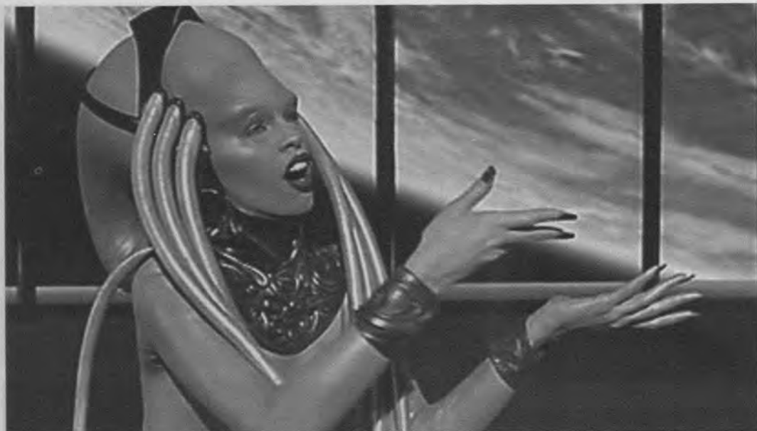
El quinto elemento (Luc Besson, 1997)