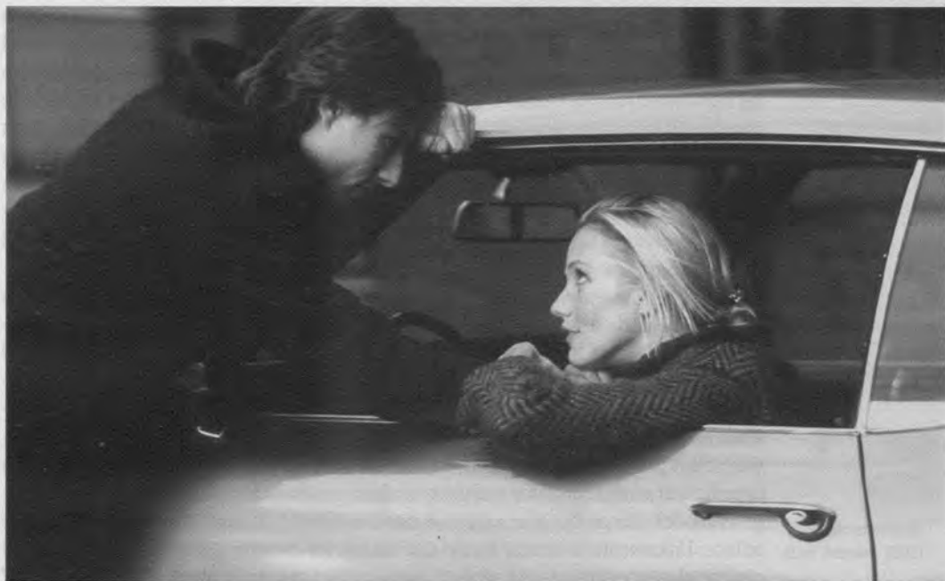
Vanilla Sky (Cameron Crowe, 2001)

modificaciones son determinantes porque la simpatía que sentimos hacia el héroe afecta en gran medida a la resolución del conflicto. Si se trata de un personaje que se ha ganado el cariño del público, éste querrá recompensarle al acabar la aventura; en cambio, si, como en el caso de Abre los ojos , no lo es tanto, se multiplican las posibilidades de que el final pueda ser abierto dejando al espectador la decisión de castigarlo o de ser benevolente con su destino. Esta máxima se cumple en la última escena de Abre los ojos , en la que el final se deja en manos de la interpretación de la audiencia, con tres posibles opciones: que César sea, después de todo, un perturbado; que, por el contrario, esté cuerdo y toda la historia haya sido un montaje del consejo de la empresa que dirige para que se suicide, o que la película entera forme parte de una fantasía creada por la realidad virtual. Como cabría esperar, Vanilla Sky es mucho más transparente y escoge una de las alternativas propuestas en el guión de Mateo Gil y Amenábar.