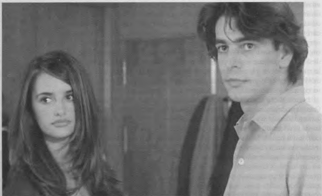
Abre los ojos (Alejandro Amenábar, 1997)