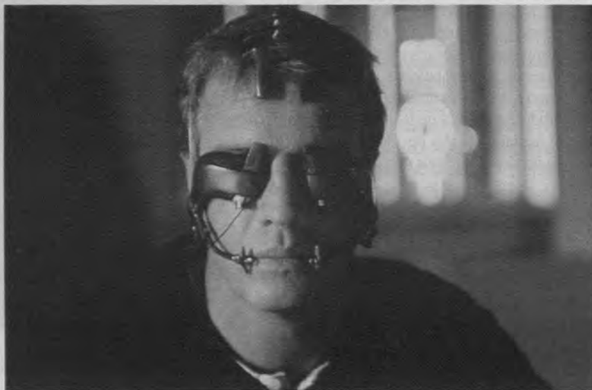
Nirvana (Gabriele Salvatores, 1997)