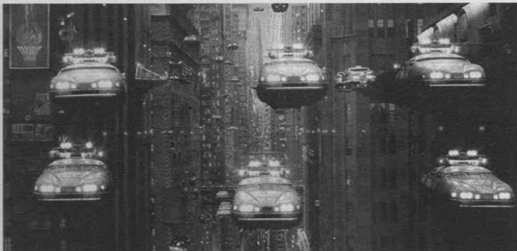
El quinto elemento (Luc Besson, 1997)

cia ficción, que es el género acotado en este estudio, un componente indispensable —obligatorio al menos desde el impacto que produjo la primera entrega de La guerra de las galaxias ( Star Wars , Geogr Lucas, 1977)— es la abundancia de lo que comúnmente se conoce como “efectos especiales”. Hasta tal punto son primordiales estos efectos que se ha atacado a buena parte de estos films, especialmente tras la revolución del diseño por ordenador, de ser un simple vehículo para hacer alarde de su evolución tecnológica dejando de lado las historias que se pretendían transmitir. Esta acusación es reveladora porque la ciencia ficción europea, dada su preferencia por subrayar el contenido de la narración y de otorgar mayor profundidad psicológica a sus personajes, se había resistido a abusar de ellos. Frente a lo que pueda pensarse, las restricciones presupuestarias de las producciones europeas no parecen ser la causa principal de su sobriedad estética, sino más bien el resultado de una forma diferente de concebir el cine. En cambio, Hollywood, avispadamente, ha hecho de la exhibición de los efectos visuales el sostén del género. El director de la película que nos ocupa, Luc