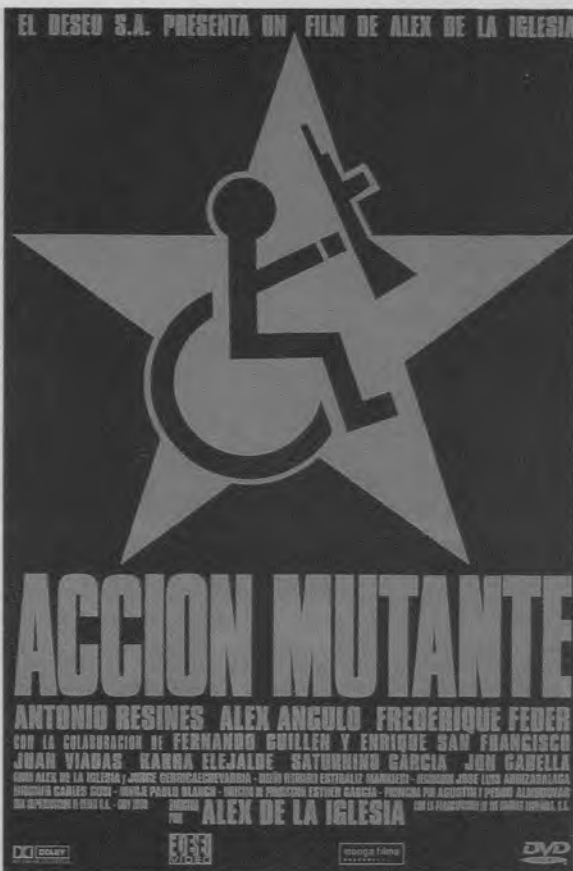
Cartel de Acción mutante (Alex de la Iglesia, 1993)