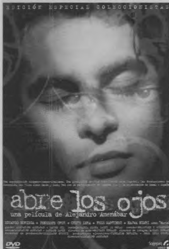
Cartel de Abre los ojos (Alejandro Amenábar, 1997)