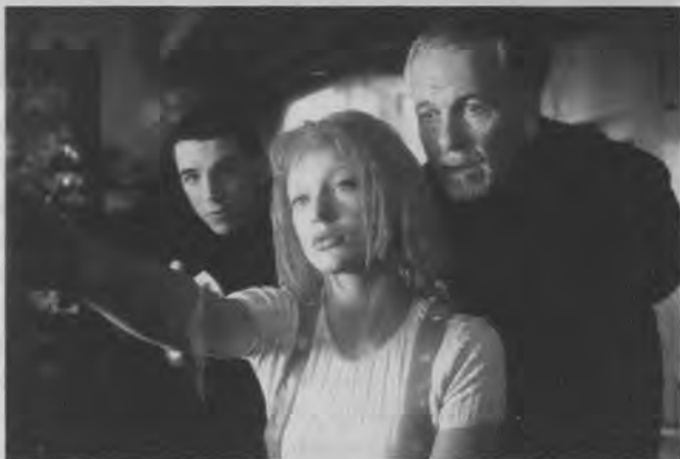
El quinto elemento (Luc Besson, 1997)

su autoestima y, de paso, consigue a la mujer de sus sueños. A Willis, un habitual del cine de acción violento cuyos papeles de duro socarrón —sólo habría que recordar su personaje en La jungla de cristal ( Die Hard , John McTiernan, 1988)— son para el gran público la promesa de diversión asegurada, se le une una plantilla de estrellas nada desdeñable, como le corresponde a toda película comercial que se precie de serlo. Milla Jovovich, que interpreta el papel de Leelo, no era, por aquel entonces, demasiado conocida como actriz, pero sí una famosa modelo. La narrativa hace referencia en varias ocasiones