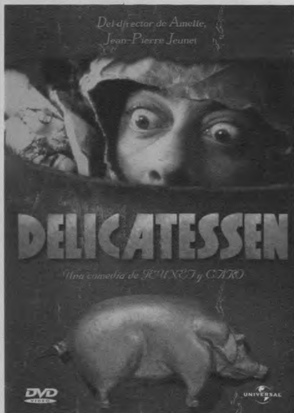
Cartel de Delicatessen (Jean-Pierre Jeunet y Marc Caro, 1991)

A pesar de las reticencias de Akerman acerca de la noción de identidad cinematográfica europea, su dictamen puede ayudar a delimitar este concepto. Existe suficiente acuerdo en el ámbito académico en que la definición contiene implícitamente un enfrentamiento con el cine comercial de Hollywood. Otro rasgo, aunque más borroso, es el hecho de que el director y sus principales colaboradores detentan la autoría y que estos films narren, como la directora señala, “historias personales”. Sin embargo, es precisamente el abandono de todos estos requerimientos (diferenciación del modelo hegemónico de Hollywood, rechazo a la política de autor y desdén por el relato de una historia intimista) lo que hace pensar que el cine europeo ha reducido la distancia con las producciones de las que tradicionalmente había intentado diferenciarse. No obstante, habría que afinar este juicio porque, de lo contrario, se corre el riesgo de ofrecer una visión maniquea del asunto. Cuando se pretende definir el cine europeo a partir de la contraposición con el estadounidense, a menudo el balance resulta desigual e interesado debido a que se compara el cine de entretenimiento de Hollywood, un cine popular con voluntad de