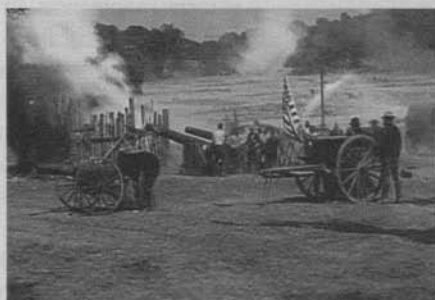
Figura 13: El nacimiento de una nación (D.W. Griffith, 1915)