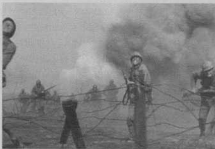
Figura 32: Sin novedad en el frente (Lewis Milestone, 1930)