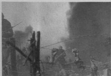
Figura 28: Sin novedad en el frente (Lewis Milestone, 1930)