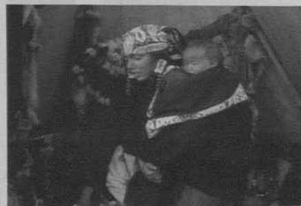
Figura 3: The Massacre (D. W. Griffith 1912)

Por resaltar el tema que más nos interesa aquí, es decir, la definición del espacio escenográfico, la pintura clásica tenderá a utilizar la naturaleza no sólo como elemento constructivo de la perspectiva a través de efectos de profundidad y las líneas que dirigen la mirada en el interior de la representación, sino como escenario cerrado al que asistimos desde un palco por la visión normalmente elevada. En el canon establecido desde el Renacimiento, el uso de bosques, montañas, colinas o ríos servirá fundamentalmente para construir las tres paredes sobre las que se disponen los contendientes. Esta perspectiva cambiará con la generalización de la fotografía en el siglo XIX y por el impacto de los panoramas, en los que el tema de la reconstrucción de batallas es uno de los más importantes y exitosos 13 . La ruptura de la cohesión centrípeta hacia el instante decisivo y la figura heroica del cuadro clásico por el desbordamiento de la visión en horizontal o en abîme , nos permiten establecer un paralelismo de los panoramas con la configuración de la escena de batalla del cine clásico de Hollywood 14 . También es determinante el peso narrativo de los detalles, los elementos singulares que obligan a fijar la mirada y la atención del espectador para abandonar momentáneamente la percepción global de un espectáculo tan abrumador para la visión.