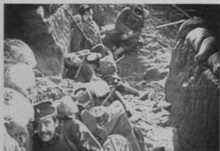
Figura 15: Corazones del mundo (D.W. Griffith, 1918)

En HW hay dos escenas principales de lucha, la centrada en el primer ataque alemán al pueblo francés donde viven los protagonistas y la que describe su reconquista final por los aliados. Entre ambas hay una serie de fragmentos menores que cubren una elipsis temporal a base de breves episodios de lucha que acaban con la toma del pueblo por los soldados alemanes mostrados generalmente como figuras grotescas y brutales. En el primero de estos segmentos se reproduce en parte el esquema de TBN , aunque la focalización en el protagonista es muchísimo mayor [figura 15]. Las imágenes se centran casi exclusivamente en él y sus combates cuerpo a cuerpo con los alemanes que intentan tomar su trinchera. El peso de los insertos (rifles que chocan, golpes) detallando la lucha confieren, en este caso, un cierto estatismo al ritmo del montaje. Esta dinámica sólo se rompe hacia el final del segmento, cuando se ordena la retirada de los franceses y entonces Griffith decide dar un tono verista a la escena con la utilización de planos generales de corte "documental" que deben pertenecer a una recreación filmada durante su estancia en Inglaterra o parte del material adquirido a operadores de guerra [figura 16].