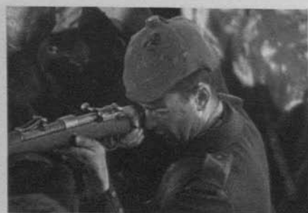
Figura 29: Sin novedad en el frente (Lewis Milestone, 1930)