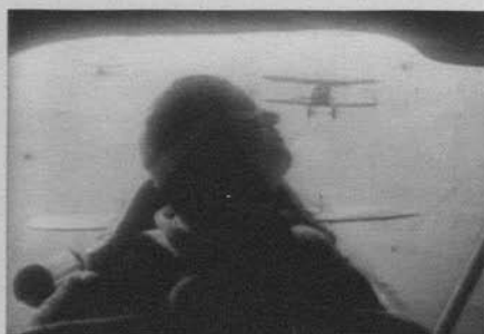
Figura 20: Alas (William Wellman, 1927)