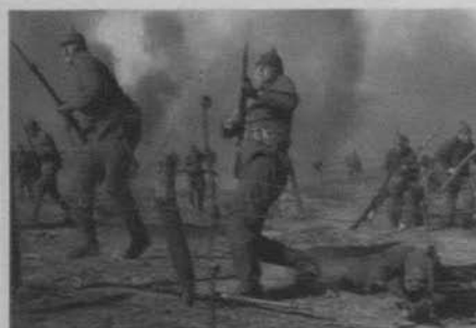
Figura 35: Sin novedad en el frente (Lewis Milestone, 1930)

de Walter Benjamin 25 sobre el silencio que se impuso al final de la Gran Guerra por la imposibilidad de transmitir esa experiencia, la realidad es que infinidad de obras literarias y cinematográficas, así como una afloración masiva de testimonios a finales de los años 20, permiten observar un esfuerzo por construir una visión subjetiva del trauma vivido. Como afirma Shlomo Sand: