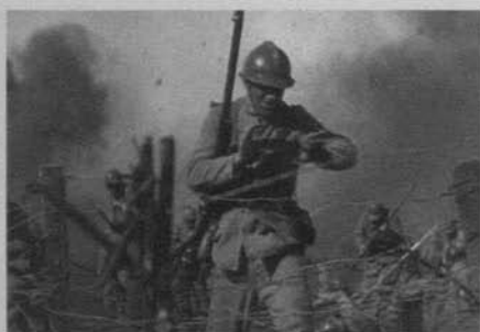
Figura 27: Sin novedad en el frente (Lewis Milestone, 1930)