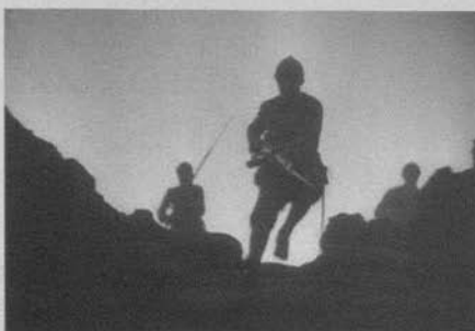
Figura 33: Sin novedad en el frente (Lewis Milestone, 1930)