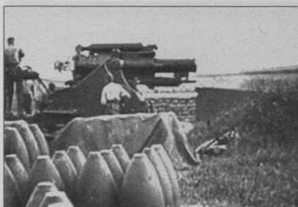
Figura 17: Corazones del mundo (D.W. Griffith, 1918)

Asentado definitivamente el modelo de continuidad de Hollywood por todo el mundo tras la Primera Guerra Mundial y establecido el patrón escenográfico como principal principio organizador 17 , el cine de los años 20 trata de encontrar nuevas vías estilísticas que, asu-