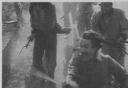
Figura 14: El nacimiento de una nación (D.W. Griffith, 1915)