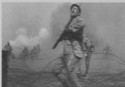
Figura 31: Sin novedad en el frente (Lewis Milestone, 1930)