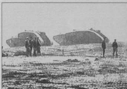
Figura 18: Corazones del mundo (D.W. Griffith, 1918)