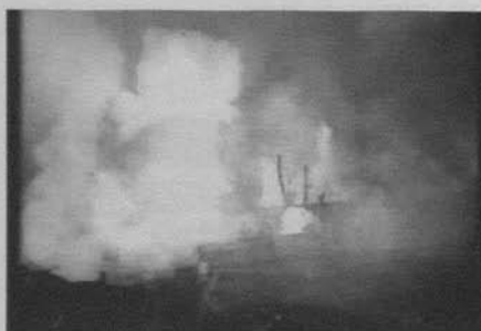
Figura 21: El gran desfile (King Vidor, 1925)