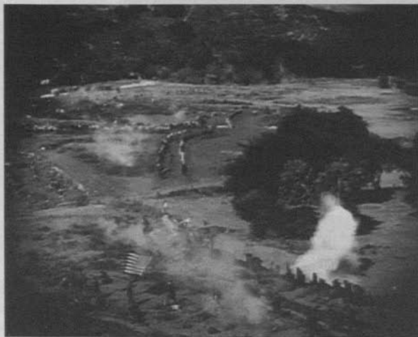
El nacimiento de una nación (D.W. Griffith, 1915)

Obviamente, la narrativización de la batalla basada en el salto de la visión panorámica a la aproximación del detalle tiene precedentes en la literatura clásica decimonónica que saltan a la mente de todos, desde la descripción de Waterloo en La Cartuja de