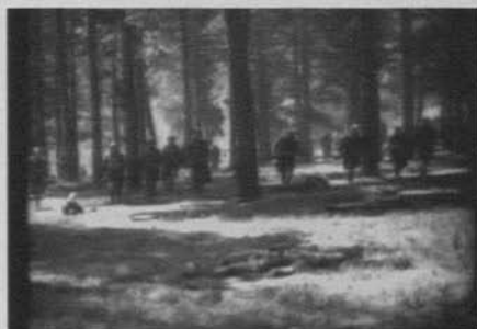
Figura 24: El gran desfile (King Vidor, 1925)

Así como la exploración de nuevas soluciones visuales es un elemento que define el valor del filme, hay también un planteamiento de índole narrativa particularmente interesante. La primera prueba de fuego de los soldados americanos consiste en atravesar un bosque infestado de francotiradores enemigos. El montaje y el emplazamiento de la cámara se concentran en crear un efecto visual vinculado a una estructura de suspense: los soldados, desplegados en columnas, van cayendo uno a uno mientras avanzan [figuras 24 a 25]. Vidor hizo que, en algunas proyecciones, la caída de los soldados fuera subrayada por un golpe de tambor en la sala de cine. Incluso Kevin Brownlow afirma que el director rodó la escena con un metrónomo 19 . La dilación temporal y el suspense trabajan la emoción del espectador y aumentan la incertidumbre. En cierto modo, esta nueva sensibilidad intenta transmitir el peso psicológico que supone el combate e implícitamente transforma la figura heroica y sin fisuras del melodrama de los años 10 en un tipo de personaje más denso y menos heroico. Una actitud que, con toda probabilidad, tiene que ver con las experiencias de la guerra que comienzan a poblar la literatura, el cine, las memorias biográficas e incluso el discurso histórico desde finales de los años 20.