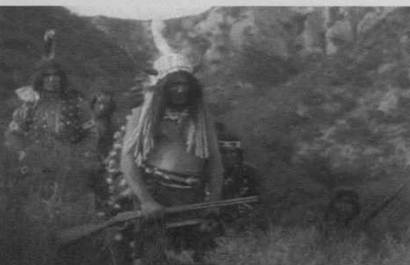
The Massacre (D. W. Griffith 1912)

Waterloo. Pero, ¿quién puede describir la ofensiva de Haig? Nadie la vio. Nadie vio ni una milésima parte de ella 6 .