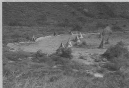
Figura 2: The Massacre (D. W. Griffith 1912)