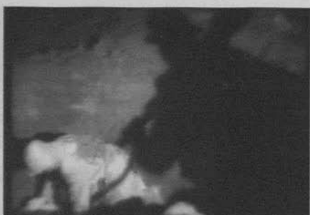
Figura 22: El gran desfile (King Vidor, 1925)