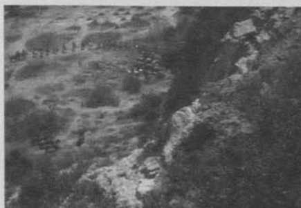
Figura 7: The Massacre (D. W. Griffith 1912)