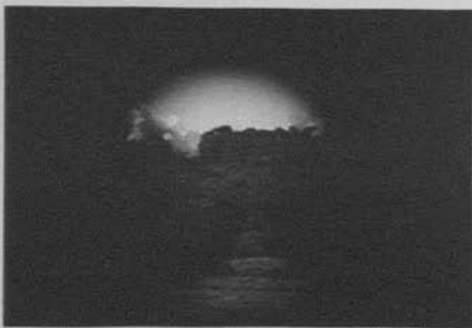
Figura 11: El nacimiento de una nación (D.W. Griffith, 1915)