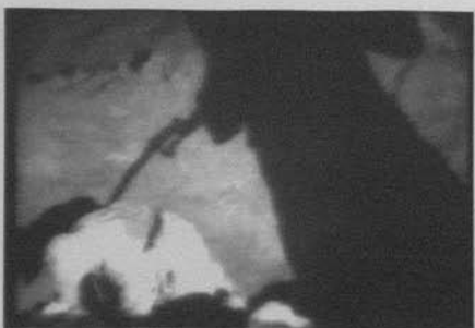
Figura 23: El gran desfile (King Vidor, 1925)