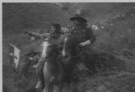
Figura 1: The Massacre (D. W. Griffith 1912)

Parma hasta la de Borodino en Guerra y Paz 11 . Pero además de la cuestión narrativa, el problema de la construcción de la escena de batalla y las soluciones para componer y orientar la mirada del espectador por el espacio se pueden relacionar con las encontradas por la pintura clásica desde los tiempos de Paolo Uccello 12 partiendo de algunas premisas básicas. Entre ellas destacaré las que considero más importantes: la definición clara de los contendientes, un patrón geométrico que convierta el campo de batalla en escenario sometido a los parámetros de la perspectiva, el papel decorativo pero también compositivo (sobre todo en el tratamiento de la profundidad y en el cierre de la perspectiva) de la naturaleza, la elaboración de líneas internas en la composición y en el tratamiento cromático que dirijan la mirada del espectador hacia los elementos más relevantes, la centralidad de las figuras protagonistas y el énfasis en recoger el instante decisivo en el que se decide el choque o se produce el momento heroico.