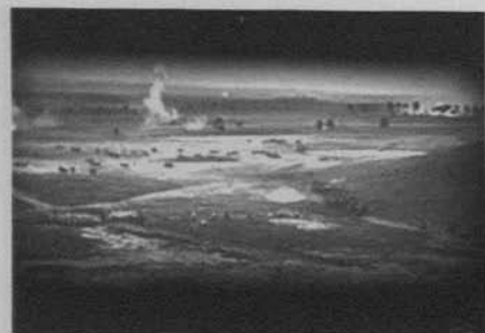
Figura 16: Corazones del mundo (D.W. Griffith, 1918)

La aparición de este tipo de imágenes lleva por primera vez a una indeterminación del espacio escenográfico que había trabajado anteriormente para comenzar a componer fragmentos de vistas alejadas o detalles descriptivos que recuerda la estrategia de los panoramas. En cualquier caso, algunos de los estilemas y soluciones empleados en TBN o Intolerancia volverán a aparecer. En uno de los enfrentamientos posteriores, por ejemplo, Griffith utiliza de nuevo el travelling acompañando una carga de los franceses semejante al del pequeño coronel en TBN .