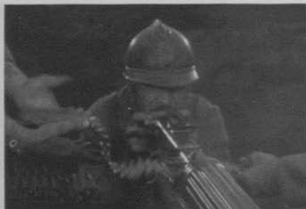
Figura 34: Sin novedad en el frente (Lewis Milestone, 1930)