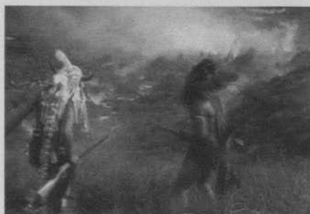
Figura 6: The Massacre (D. W. Griffith 1912)