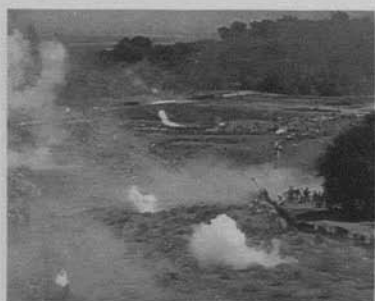
Figura 9: El nacimiento de una nación (D.W. Griffith, 1915)