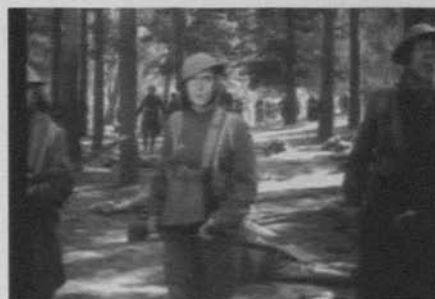
Figura 25: El gran desfile (King Vidor, 1925)