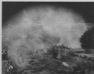
Figura 8: El nacimiento de una nación (D.W. Griffith, 1915)