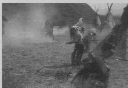
Figura 5: The Massacre (D. W. Griffith 1912)