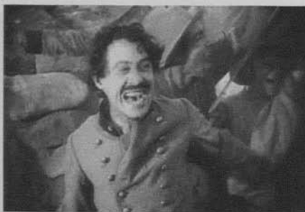
Figura 10: El nacimiento de una nación (D.W. Griffith, 1915)