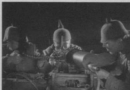
Figura 30: Sin novedad en el frente (Lewis Milestone, 1930)

El cine de los años 20 centrado en la Primera Guerra Mundial es particularmente interesante porque toca temas cercanos a los espectadores del momento y, por lo tanto, desarrolla un papel social que, más allá de la propaganda, lleva implícitos procesos que van desde el duelo y la memoria a la construcción de una identidad nacional y que hacen de su recepción un problema para los historiadores de la cultura y de las mentalidades. A pesar de tantas veces referido pasaje