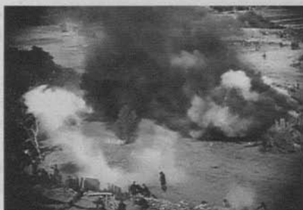
Figura 12: El nacimiento de una nación (D.W. Griffith, 1915)

La decepción de Griffith ante la guerra moderna como material dramático y las nuevas tendencias en el estilo filmico que se desarrollaban en el cine europeo requerían, por lo