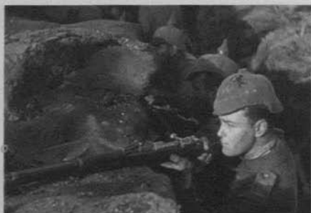
Figura 26: Sin novedad en el frente (Lewis Milestone, 1930)