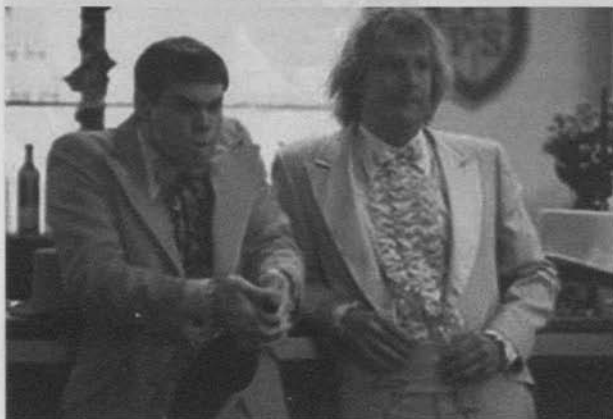
Dos tontos muy tontos (1994)