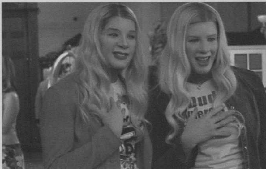
Dos rubias de pelo en pecho (2004)