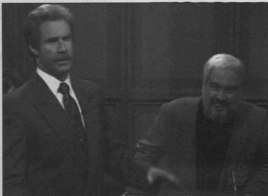
Will Ferrell (izq.), en un sketch de SNL