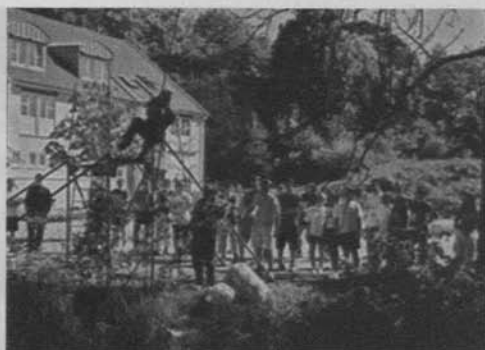
Humor amarillo (Takeshi's Castle)

participantes, que simulan ser guerreros, deben tomar el castillo, para lo que han de someterse a determinadas pruebas de actividad física; los accidentes aparecen por doquier, algunos de ellos provocados tras lanzarse de boca contra una puerta o caídas a agujeros cubiertos de barrizales, así como golpes con piedras escurridizas que pueden propiciar dislocaciones corporales, todo ello muy similar al estilo de la comicidad de los dibujos animados, ya sea de las animaciones manga o de los tradicionales Disney o Looney Tunes 17 , y como clara metonimia de la tortura que se visualiza en las ficciones cinematográficas. A su vez, las pruebas van acompañadas de los comentarios