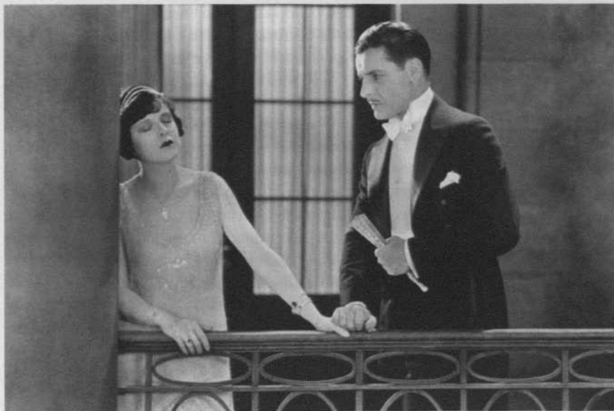
El abanico de Lady Windermere (Ernst Lubitsch, 1925)

Estas intrépidas maniobras estéticas, emprendidas durante la década muda de los años veinte a título individual por estos (y otros) cineastas de vocación corsaria, van engrosando el utillaje expresivo del Hollywood sonoro de los años treinta enriqueciéndolo considerablemente. Lo que no obsta para que algunos de aquellos que siguieron fieles a los preceptos de máxima visibilidad característica del modelo hegemónico que vengo denominando —no sin cierta vacilación porque el tono despectivo que conlleva está aquí absolutamente fuera de lugar— exhibicionista o voyeurista consiguieran elevar el rendimiento estético del llamado séptimo arte a sus más altas cotas, como queda patente, por ejemplo, en las comedias que Chaplin facturó a renglón seguido de Una mujer de París , haciendo abstracción de sus recientes probaturas elípticas. El prematuro final (motivado por su incompatibilidad manifiesta con los jerifaltes de la industria) de la trayectoria cinematográfica de Eric von Stroheim imposibilitó, por ejemplo, que un cineasta (a la postre esencial) que venía cifrando su inimitable estilística en la exploración sistemática de las potencialidades de ese modelo de gestión visual que ciñe su campo de operaciones al perímetro del encuadre, e invirtió todas sus