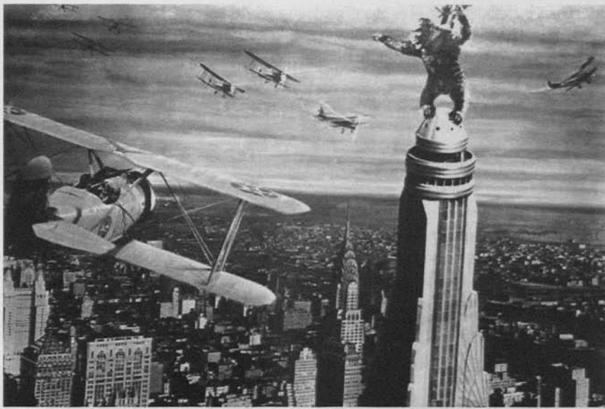
King Kong (Merian C. Cooper y Ernest B. Schoedsack, 1933)

corolario en el nivel plástico. De hecho, toda la primera parte del filme, la que concluye con la irrupción de Kong y está filmada con procedimientos convencionales, responde grosso modo a unos planteamientos estéticos asimilables al realismo filmico , en tanto que el resto de la película, polarizada en la magnética presencia del orangután gigante y, por consiguiente, resuelta toda ella mediante la técnica en aquel tiempo revolucionaria del stop-motion , acredita una suerte de poesía del efecto especial que subvierte punto por punto los presupuestos de cualquier realismo filmico.