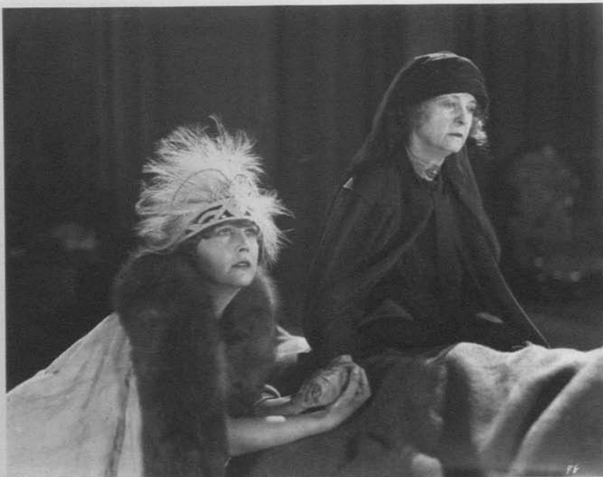
Una mujer de París (Charles Chaplin, 1923)

cias facturado por el rey de la comedia, Una mujer de París es un discurso genuinamente elíptico que surge en torno a la ostensible omisión de Charlot, así como —dato que nos conduce al meollo del asunto— de la presencia en pantalla del sujeto (el propio Chaplin) que lo encarnaba. Quiere decirse que este magistral artefacto estético emplea la más sofisticada imaginaria visual que concebirse pueda para, en énfasis elíptico, hacer filmicamente presente esa ausencia radical del autor (Charles Spencer Chaplin) quien, sin que sirviera de precedente, 3 abandonó su hábitat natural, el encuadre, para ponerse a resguardo detrás de la cámara. En definitiva, Chaplin se las ingenia (dando fe de su ingenio inagotable) para estar (omni)presente en un filme en el que sólo se le (entre)ve fugazmente.