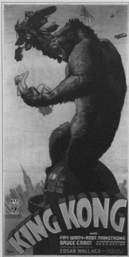
Cartel de King Kong (Merian C. Cooper y Ernest B. Schoedsack, 1933)

convertido en coto vedado para los adultos. Pero creo que resultará mucho más enriquecedor en términos heurísticos valerse de las específicas circunstancias que concurren en la práctica concreta del remake , habida cuenta que ese singular ejercicio cinematográfico surge como concreción práctica de la idea de réplica(nte) y, por consiguiente, se ofrece como la vara de medir más precisa para cotejar los resultados artísticos de lo que un perspicaz denominó el genio del sistema frente a los de esa ciclópea maquinaria o hidra industrial de mil cabezas que campa a sus anchas hoy en día.