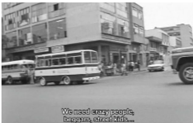
Agarrando pueblo , (Luis Ospina y Carlos Mayolo, 1977).

A pesar de todo, Deleuze sostiene una proyección utópica de y hasta cierto punto fascinada con las cinematografías tercermundistas. Aunque sin caer en una mirada etnocéntrica como la que se construye muchas veces sobre los imaginarios y representaciones visuales y simbólicas de América Latina y de lo latinoamericano, desde los centros de producción y circulación de los dispositivos de saber/poder. En el caso del cine, si bien se desarrollarían colectivos cinematográficos identificados con prácticas revolucionarias, utópicas o críticas con