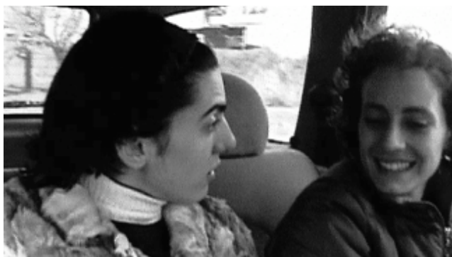
Los rubios (Albertina Carri, 2003).

Habría entonces que decir que los conceptos de imagen-movimiento e imagen-tiempo, memoria y cuerpo, éste último encarnado en un pueblo en devenir, con los cuales Deleuze quiere comprender al cine latinoamericano, encuentran aquí su límite. Porque esa memoria del futuro –del pueblo que falta pero que vendrá– presente en la cinematografía tercermundista de los años sesenta y setenta era un proyecto truncado que, en el momento que Deleuze escribe, se está recuperando de la violencia ejercida por los golpes de Estado. Pero si todavía no nos desprendemos de estos conceptos, como si fueran categorías vacías, es porque su potencialidad sigue intacta, ya que aquello que fracturó esta memoria fue una crisis negativa –ya no el estado de crisis permanente potenciador de devenires– cuya finalidad era el exterminio de los cuerpos, del pueblo que devenía. El regreso a la democracia en los países latinoamericanos recomenzó otro período para las incipientes cinematografías y para la memoria colectiva donde esta cuestión pasa a ser central, aunque ya no en el sentido de la memoria de todos los pueblos oprimidos sino de las recientes de las dictaduras.