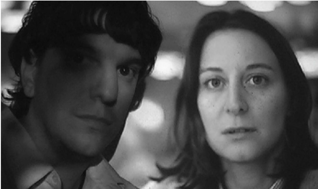
« M » (Nicolás Prividera, 2006).

Si retomamos el hilo del análisis deleuziano, que no se limita al cine latinoamericano aunque encuentra en este las potencialidades de un cine político diferente al cine europeo, pareciera que este yo del que se habla muchas veces como lugar de enunciación en el cine, se sitúa en el mismo lugar que el devenir minoritario, el cual, según Deleuze, conformaría una memoria política colectiva o un cine de autor, aunque no necesariamente un cine militante. Sin embargo, el filósofo no se habría detenido en esta persona. Por el contrario, habría ampliado el espacio enunciativo a una cuarta persona del singular. La posibilidad de esta