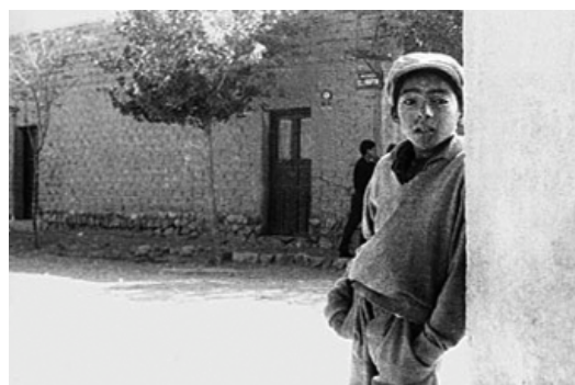
La hora de los hornos (F. Solanas, O. Getino y G. Vallejo, 1968).

En este sentido, el cine ya no sería entendido como lenguaje de entretenimiento sino que, en consonancia y tensión con el desarrollismo, la teoría de la dependencia, la filosofía y la teología de la liberación, se volvía un elemento más