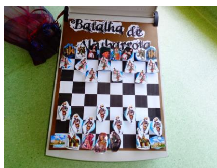
Figura 5. Fotografia do projeto “Scanner-Xadrês com Batalha de Aljubarrota”