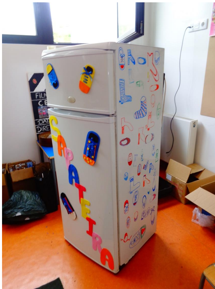
Figura 8. Fotografia do projeto “frigorífico-sapateira”