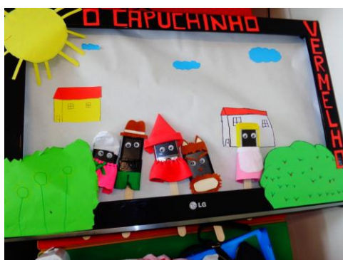
Figura 6. Fotografia do projeto “Écran de telemóveis como suporte de história do Capuchinho Vermelho”