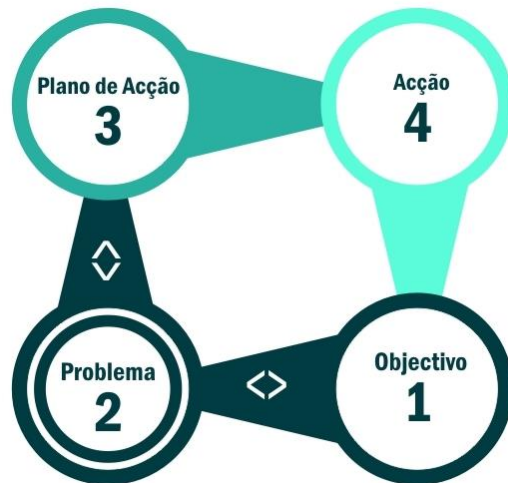
Figura 1. O método de resolução de problemas de quatro passos

Sendo a duração das sessões dos métodos de grupos grandes incompatível com o escasso tempo disponível com os alunos, fomos buscar modelos já trabalhados em estudos anteriores, sobre procedimentos de resolução de problemas em grupos com menos de 12 elementos (Sousa et al., 2014) e sua aplicação no contexto do ensino (Sousa, Monteiro e Pellissier, 2015). Estes estudos descrevem a construção de um modelo de quatro passos, compreendendo as etapas de Definir o Objetivo, Definir o Problema, Planear a Ação, e a Ação propriamente dita (figura 1). A sequência de divergência (<) e convergência (>) é mantida apenas durante as etapas de Definição do Objetivo e de Definição do Problema, para que existam mais opções disponíveis para escolher.