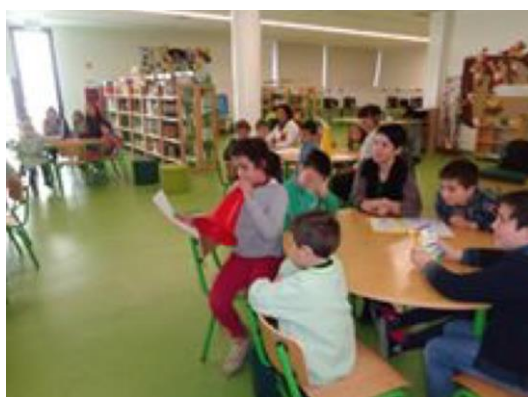
Figura 2. A porta-voz anuncia o eletrodoméstico escolhido com o “megafone”