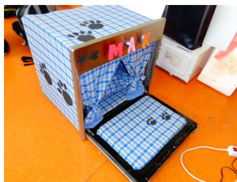
Figura 7. Fotografia do projeto “forno para casota de cão”