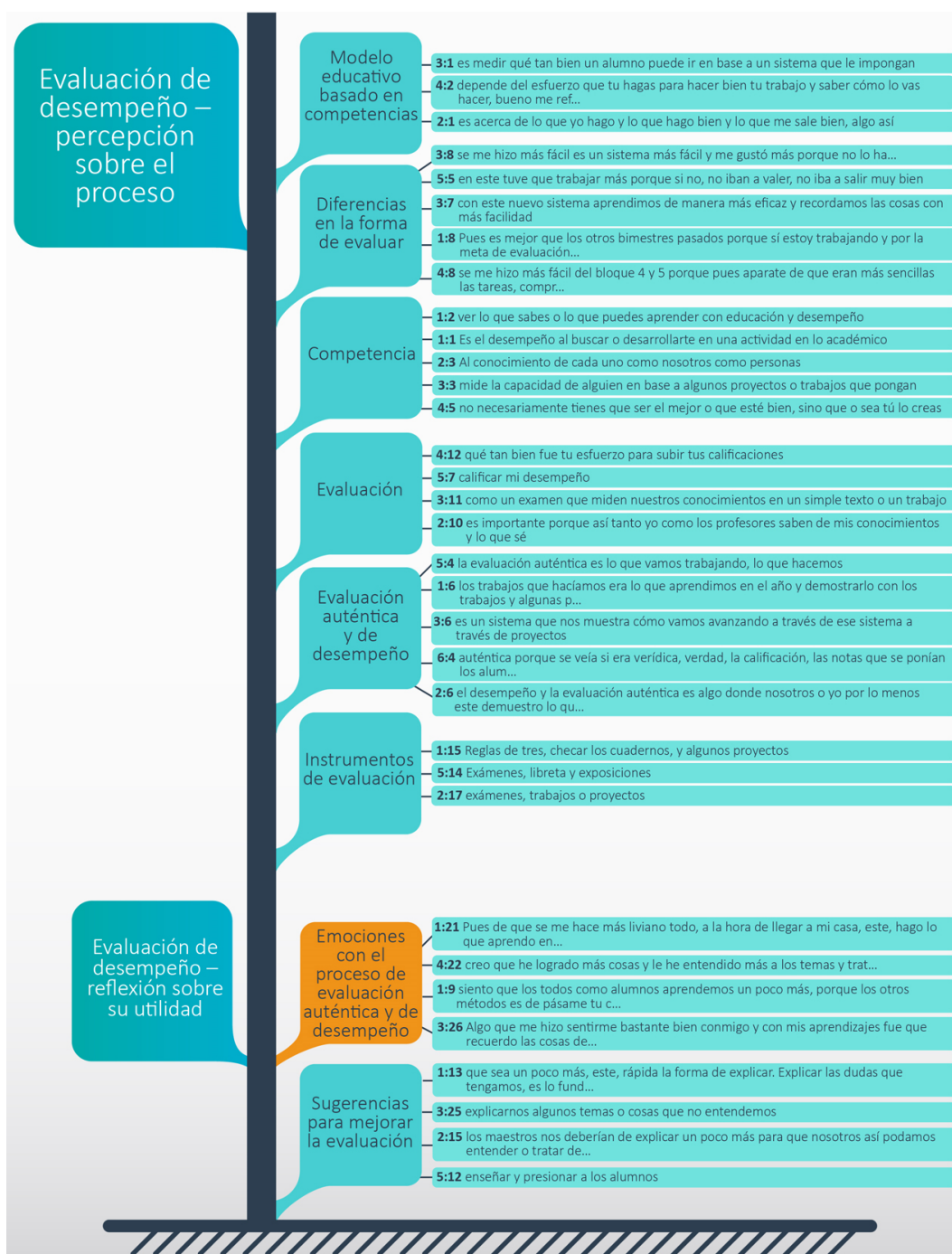
Figura 1. Familia de categorías emergentes sobre evaluación de desempeño: percepción sobre el proceso, analizadas a partir del proceso de indagación sobre la evaluación de desempeño y auténtica