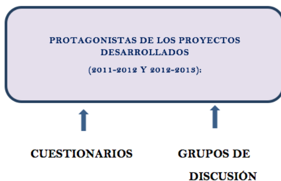
Figura 3. Informantes, técnicas de recogida de información y análisis de la misma