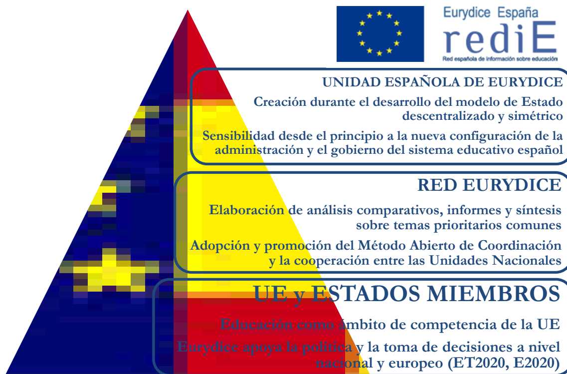
Gráfico 2: Los tres contextos que llevan a que la Unidad española de Eurydice se convierta en Eurydice España-REDIE y adopte el modelo de cooperación europea para realizar su trabajo en las Redes europea y española de información sobre educación.

Fuente: Elaboración Eurydice España-REDIE